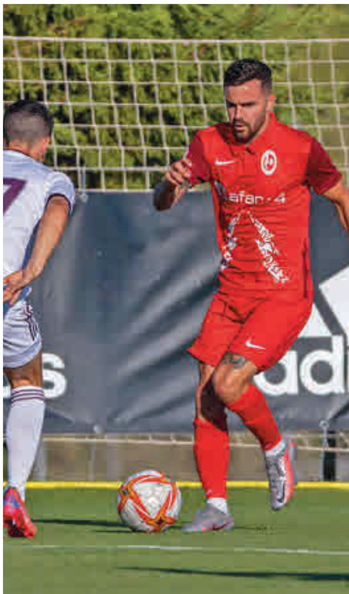
El Rayo aspira a regresar a Segunda tres años después