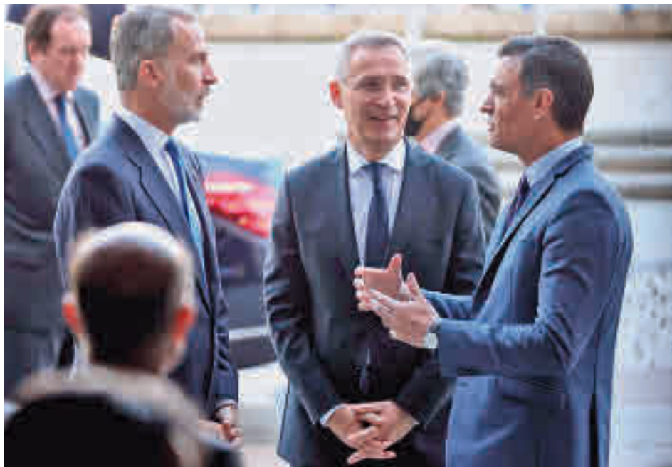
Pedro Sánchez se reunió con Jens Stoltenberg

Pedro Sánchez anuncia un incremento del gasto en Defensa ante las amenazas externas • El Rey Felipe VI pide más atención a la frontera Sur