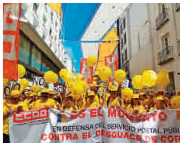
Protesta de los trabajadores de Correos

Según han informado los sindicatos a Europa Press,