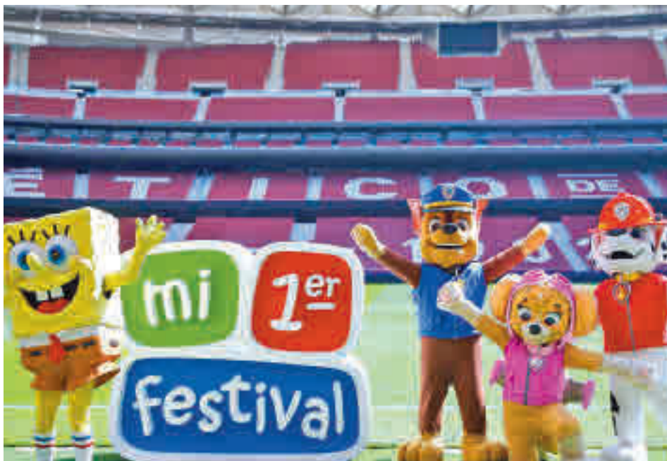
Bob Esponja y La Patrulla Canina estarán en el Wanda Metropolitano

» Teatro Municipal. Domingo 5, 19 horas. Precio: 5 euros.