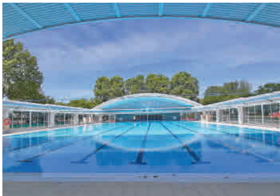
Piscina municipal de Fuenlabrada

El recinto ya fue objeto de reforma el pasado año cuando se acometieron obras de mejora tanto del merendero