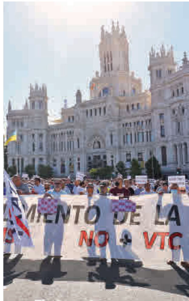
Manifestación de los taxistas contra la nueva ley

presentantes de los taxistas, que se concentraron el miércoles en el centro de la capital para mostrar su rechazo, aseguran que el nuevo texto les condena "a la indecencia". "Vamos a ir hasta el final para denunciar la corrupción y los políticos vendidos. Somos au-