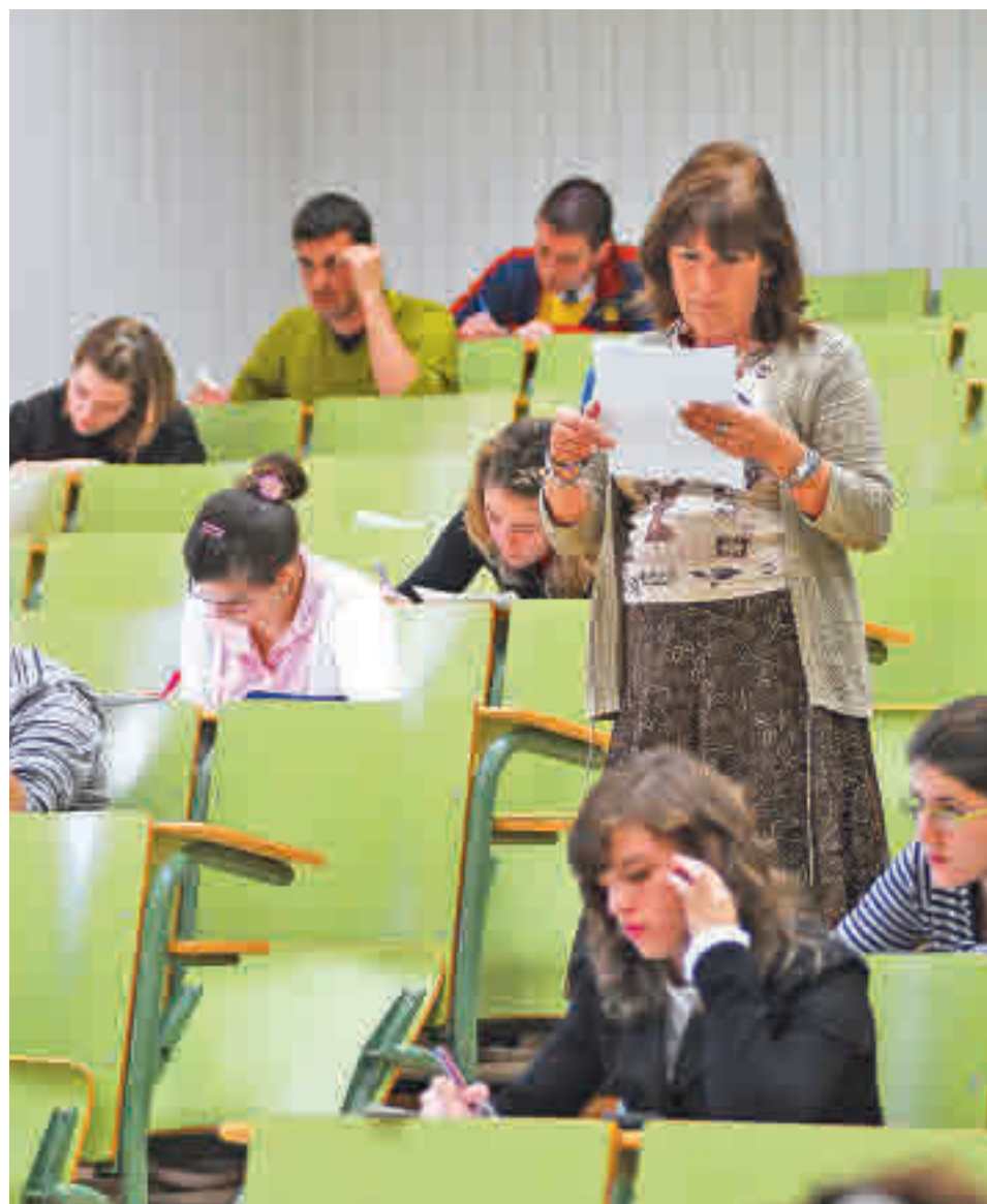
Alumnos haciendo las pruebas de acceso a la universidad

Marcarse hábitos es fundamental para crear una rutina y ceñirse a ella. Al igual que es importante organizar un tiempo para el estudio diario, no se deben dejar de lado otras tareas ni actividades que favorezcan el descanso, como la realización de los hobbies