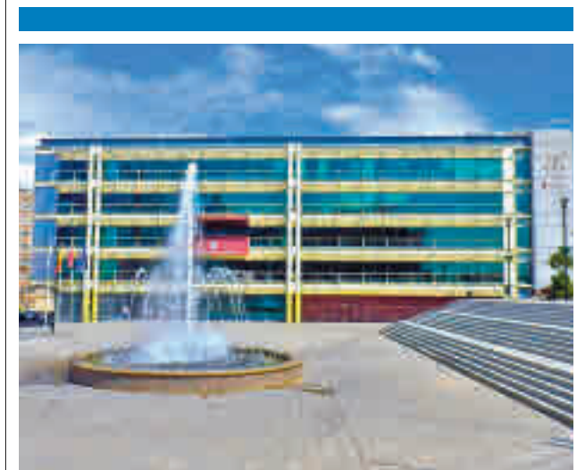
Ayuntamiento de Fuenlabrada

En total se han recibido 552 solicitudes de 21 centros públicos y concertados de ESO, Bachillerato y Formación Profesional. El Ayuntamiento ha aprobado de manera provisional 450 de ellas y ha abierto un plazo para que el resto solventen pequeñas cuestiones pendientes. El objetivo del Ayuntamiento es ingresar a los centros esta beca antes de que finalice el mes de junio, para que los beneficiarios puedan disponer de él antes de partir a su destino.