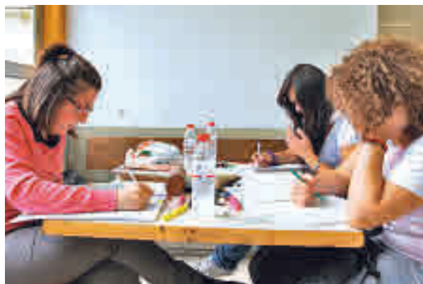
Alumnos preparando la selectividad

leccionar la mejor opción (56,3%). Así lo revela la XVII Encuesta Tendencias Universitarias 2022 que ha realizado la Universidad Francisco de Vitoria (UFV) entre 3.532 estudiantes de Bachillerato que cursan sus estudios en 4.000 colegios e