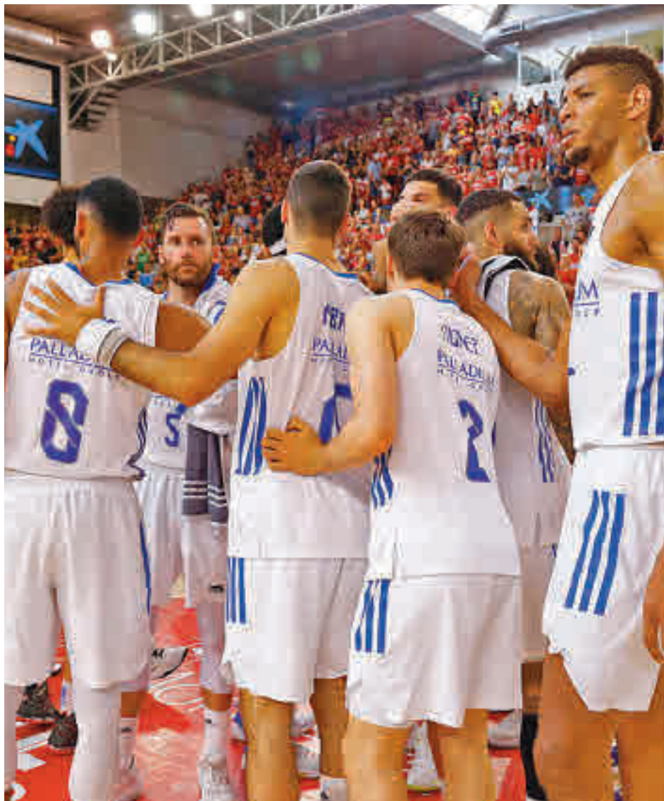
El Real Madrid busca recuperar la corona nacional tres años después

Precisamente los duelos de semifinales brindan un pulso entre esa vieja guardia y el dominio de Barça y Madrid. Los de Pablo Laso arrancaban este jueves su semifinal ante el Bitci Baskonia en un encuentro que ha generado cierta polémica. El horario escogido (22 horas) ha vuelto a poner sobre la mesa el debate de si es mejor fomentar la mayor presencia posible de público en las gradas o, por el contrario, atender a los intereses de los operadores televisivos, quienes, no olvidemos, aportan una sustan-