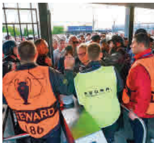
Accesos a la reciente final de Champions en París

EL PERIÓDICO GENTE NO SE RESPONSABILIZA NI SE IDENTIFICA CON LAS OPINIONES QUE SUS LECTORES Y COLABORADORES EXPONGAN EN SUS CARTAS Y ARTÍCULOS