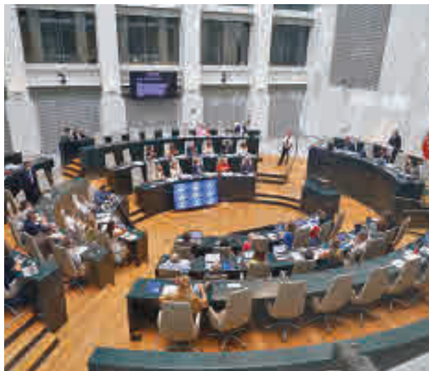
La sesión ordinaria del pasado 31 de mayo

En este acuerdo se han incorporado las aportaciones de los grupos municipales y las más de 1.500 experiencias de profesionales de los servicios sociales, así como de usuarios, entidades del tercer sector, colegios profesio-