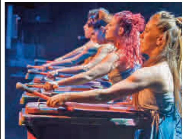
La formación israelí regresa a Madrid

Con el aval de haberse desarrollado en diferentes puntos de Europa desde 2007, la primera edición de Mi Primer Festival llega a Madrid, además, con un trasfondo doblemente solidario. "Colaboramos con la Fundación ANAR, que está haciendo una gran labor a través de un teléfono de ayuda al menor, el 900 20 20 10. Me pareció muy interesante participar con un donativo a través de la compra de entradas", detalla el director de Mi Primer Festival quien añade otro acuerdo, este con Crecer Jugando, para que los asistentes lleven juguetes usados que serán donados a los niños más desfavorecidos.