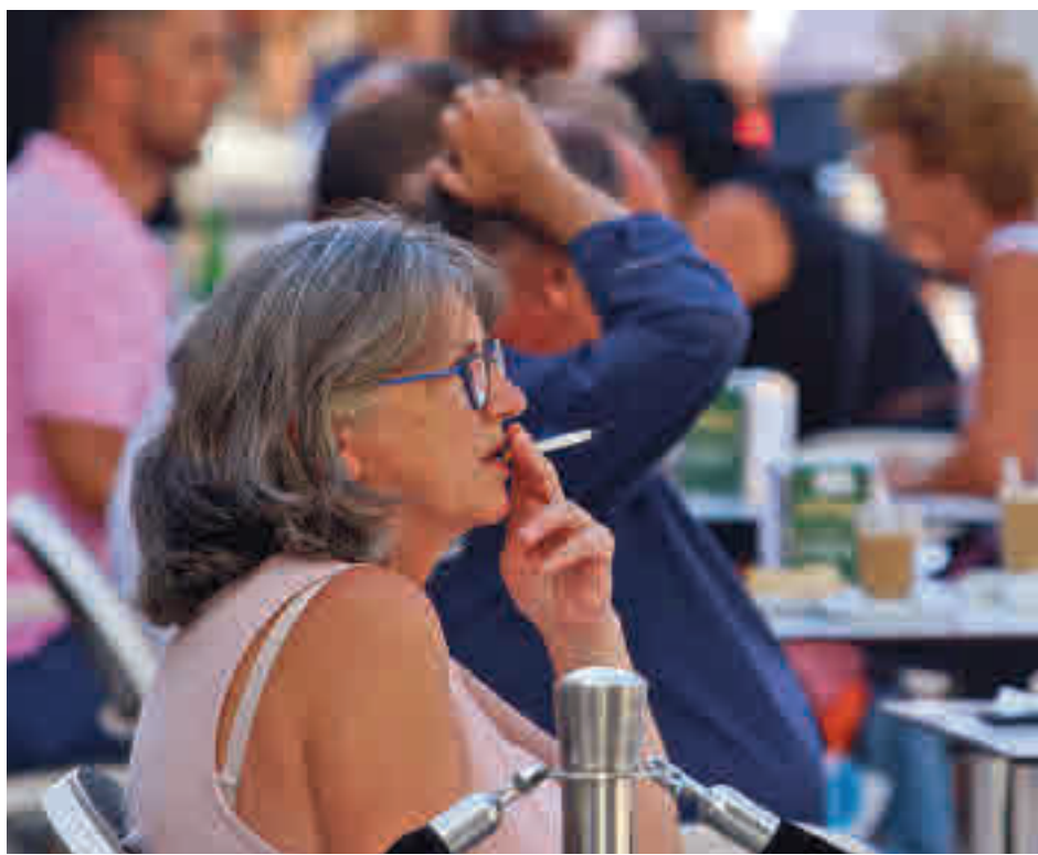
El consumo de tabaco tiene cada vez más detractores

Otra medida que se encuentra en estudio, realizado con una muestra de 701 personas de más de 14 años, es la prohibición de fumar en los coches particulares, sobre todo, si en el interior viajan embarazadas y niños. A pesar de tratarse de espacios privados, el humo del tabaco es especialmente peligroso por el reducido tamaño de los vehículos. En estos casos, los defensores de restringir este hábito siguen superando a los reticentes. El 51,5% está de acuerdo con la medida siempre, un 16,6% solo si viaja población de riesgo y el 31,9% se muestra en contra. Por sexo, los hombres se muestran más reticentes que las mujeres (un 45% defiende