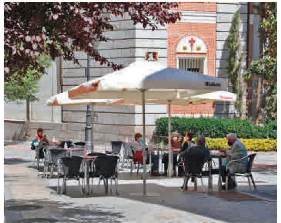
Una terraza situada en la almendra central de la capital

Por otro lado, desde Cibeles explican que esta figura podrá utilizarse por los distritos "para aquellas terrazas que, dentro de una zona saturada, se encuentren dispuestas en aceras, zonas terrazas, bulevares, plazas o calles peatonales. La iniciación de este