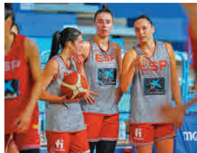
España afronta un periodo de regeneración FEB

Ese bloque de jugadoras también se concentrará en Guadalajara desde el día 10 para preparar otro torneo de preparación, en esa ocasión en Italia, con las transalpinas y Eslovenia como rivales.