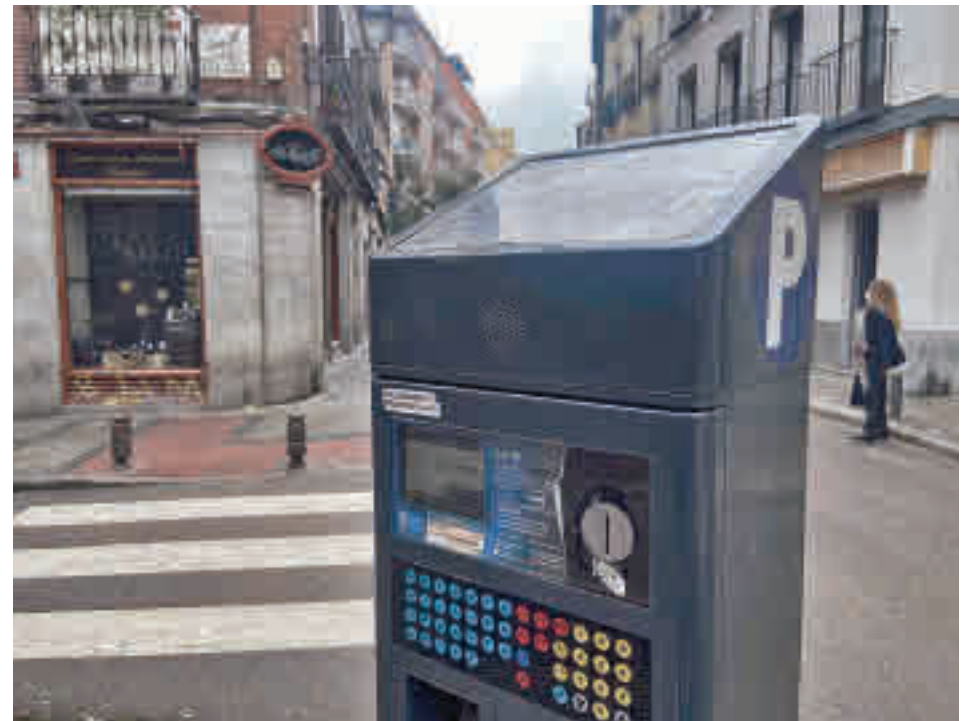
El Ayuntamiento extenderá su red de parquímetros a esta zona a lo largo de los próximos días

Los vecinos de estos barrios pueden ya solicitar su tarjeta de residente • En el primero de ellos, se reservarán 3.685 plazas, mientras que en el segundo serán un total de 1.008