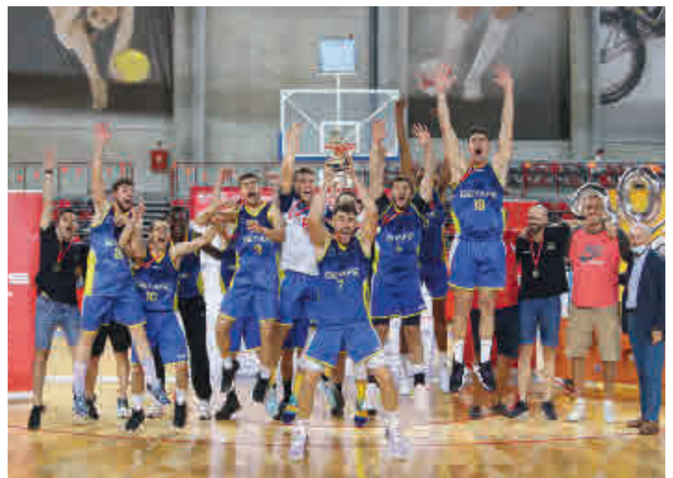
El CB Getafe celebró por todo lo alto su título de campeón FBM

Por el otro lado del cuadro, el BT no se dejó impresionar por la condición de local del Pintobasket y se citó con el CB Getafe en la gran final tras imponerse por 66-72.