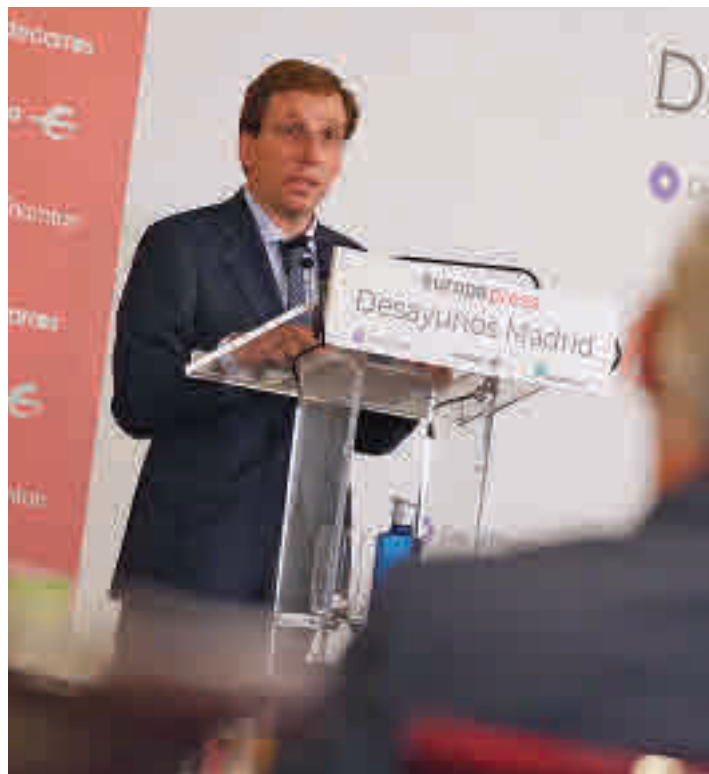
Un momento de la intervención del alcalde

Almeida explicó que en los últimos tres años la capital ha recuperado la imagen nacional e internacional, al ser incluida en el ranking de las diez ciudades con mayor calidad de vida del mundo y la mejor en materia de segu-