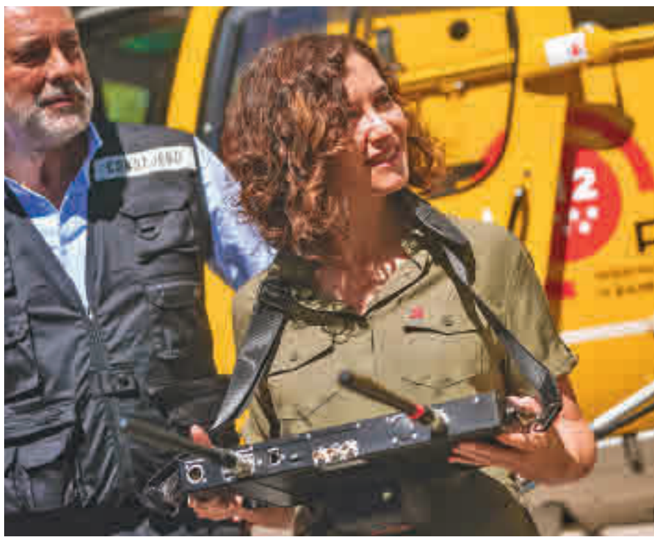
Isabel Díaz Ayuso, durante la presentación del plan

El personal del Summa 112 era el encargado de atender estos servicios de urgencias y emergencias que funcionan cuando los centros de salud han finalizado su horario, normalmente noches y fines de semana. "Se ha ninguneado nuestro trabajo en los SUAP, diciendo que no atendíamos urgencias", señalan los convocantes de la marcha, que piden volver a sus puestos.