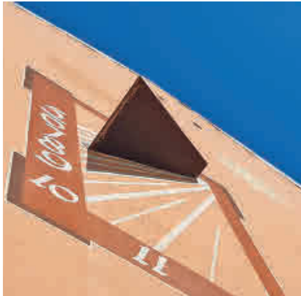
Uno de los relojes de sol instalados en una fachada del barrio

La Junta Municipal de Usera rehabilitará los 17 relojes de sol de la Colonia Moscardó con el objetivo de recuperar su valor cultural. Para ello, firmó este miércoles 8 de junio un convenio con la asociación vecinal del barrio con el propósito de revitalizar su valor patrimonial y cultural. Este convenio llega tras un estudio previo realizado en los últimos meses por los técnicos del distrito, que sirvió para analizar el estado de conservación de cada uno de