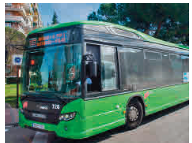
Autobús interurbano en Madrid

Díaz-Pache también indicó que el Ejecutivo regional está inmerso en la redacción de los reglamentos de los VTC y los taxis. Es el caso de la reducción de obligaciones, trabas y costes; que puedan disponer de vehículos de más de cinco plazas; flexibilidad en los descansos y vacaciones; o la contratación de plazas individuales.