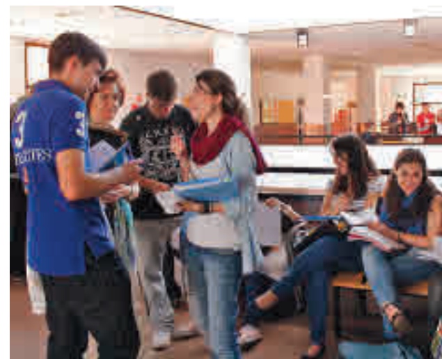
Estudiantes de Bachillerato en Madrid