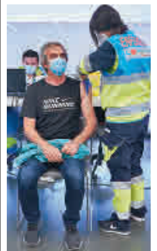
Vacunación en el Zendal

DURANTE EL AÑO PASADO ARDIERON CASI 500 HECTÁREAS FORESTALES