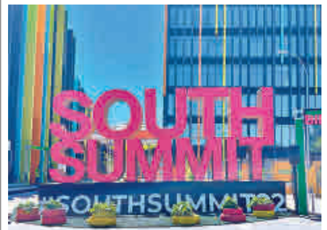
El cartel situado a la entrada de La Nave, en la calle Cifuentes

gentedigital.es Toda la actualidad de los distritos de Madrid, en nuestra web