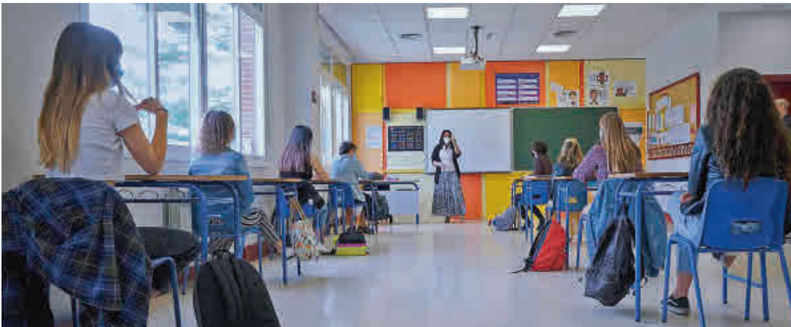
Clases de Bachillerato en un centro educativo madrileño