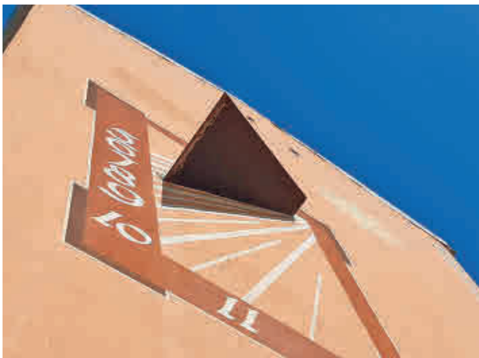
Uno de los relojes de sol instalados en una fachada del barrio de Moscardó