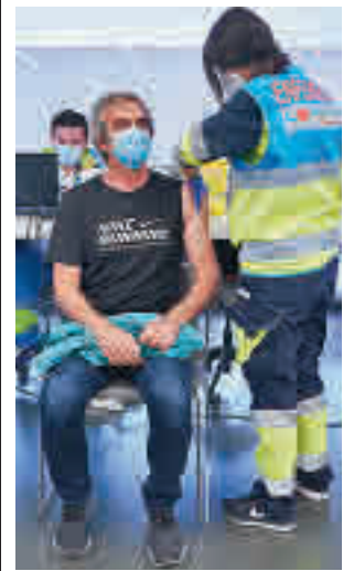
Vacunación en el Zendal

DURANTE EL AÑO PASADO ARDIERON CASI 500 HECTÁREAS FORESTALES