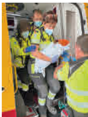
La atención sanitaria

Padre Piquer, en Aluche. A su llegada, los sanitarios del Samur-Protección Civil, estabilizaron al bebé, que estaba llorando envuelto en una manta y con restos del cordón umbilical y líquido amniótico, por lo que calcularon que llevaba poco menos de una hora con vida. El niño tenía ya sig-