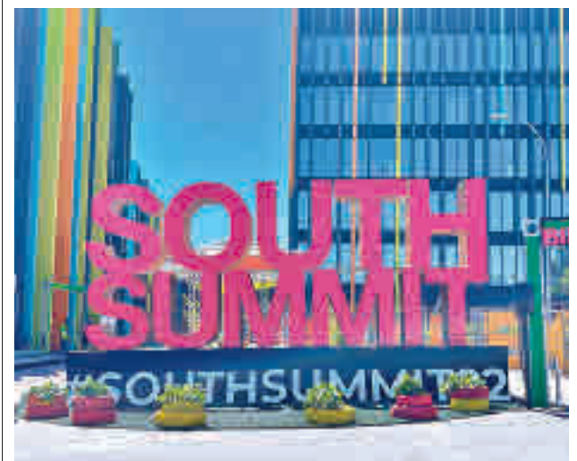
El cartel situado a la entrada de La Nave, en la calle Cifuentes

gentedigital.es Toda la actualidad de los distritos de Madrid, en nuestra web