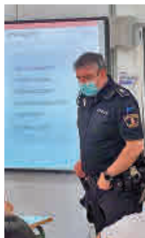
Una de las charlas

La Policía Local también pretende con estas charlas evitar la captación y pertenencia a bandas juveniles. Los alumnos y alumnas aprenderán cómo detectar, prevenir y actuar ante el acoso escolar, los ciberdelitos y las bandas violentas. Además, se les facilitan pautas de comportamiento a tener en cuenta en el uso de las redes sociales.