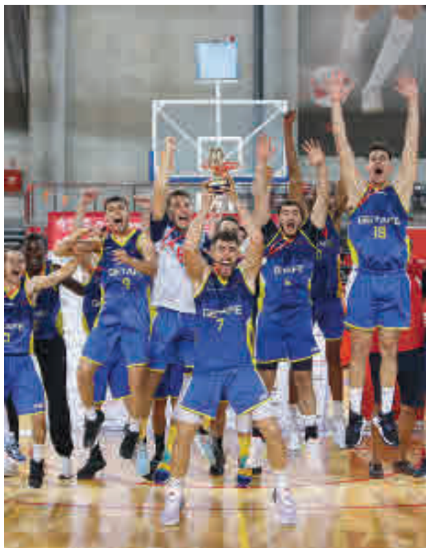
El CB Getafe celebró por todo lo alto su título de campeón FBM

Por el otro lado del cuadro, el BT no se dejó impresionar por la condición de local del