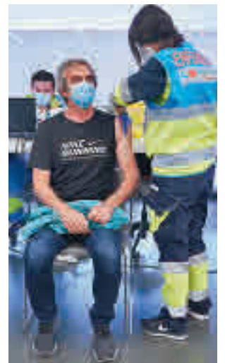
Vacunación en el Zendal

DURANTE EL AÑO PASADO ARDIERON CASI 500 HECTÁREAS FORESTALES