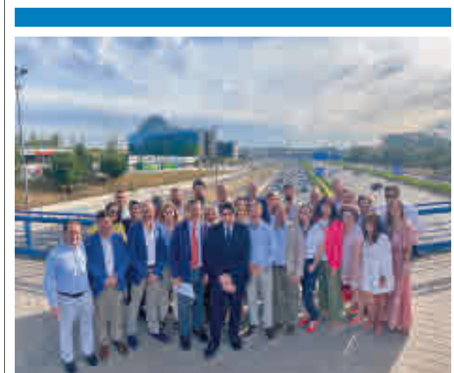
Encuentro de alcaldes de la zona norte en Las Tablas

Esa tendencia también se ha dado en San Sebastián de los Reyes, cuya tasa de incidencia acumulada está ahora en 1.111 casos por cada 100.000 habitantes, un dato que supera en 23 puntos al de la semana anterior. Respecto a sus Zonas Básicas de Salud (ZBS), la peor situación sigue estando en Rosa Luxemburgo (1.537 positivos). Por su parte, Alcobendas sí ha experimentado un descenso, quedándose en los 823 casos. Su ZBS con la tasa más elevada es Valdelasfuentes (1.327 casos).