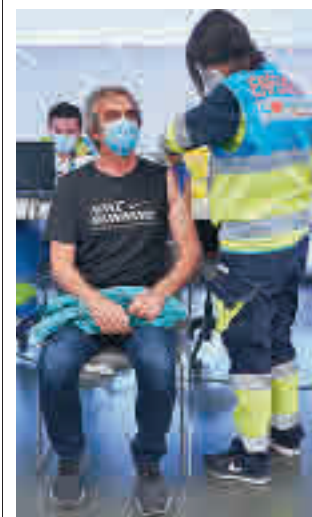
Vacunación en el Zendal

DURANTE EL AÑO PASADO ARDIERON CASI 500 HECTÁREAS FORESTALES