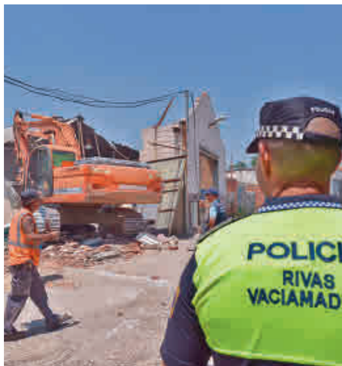
Derribo de una vivienda del sector IV AYT. RIVAS

Las familias a realojar están recogidas en el censo de ocupantes elaborado bajo el marco de la Ley 2/2011 de la Cañada Real. En todo caso, según se recoge en el convenio, el objetivo no es solo el realojo de las familias que viven en situación irregular en este poblado chabolista, sino también en la integración so-