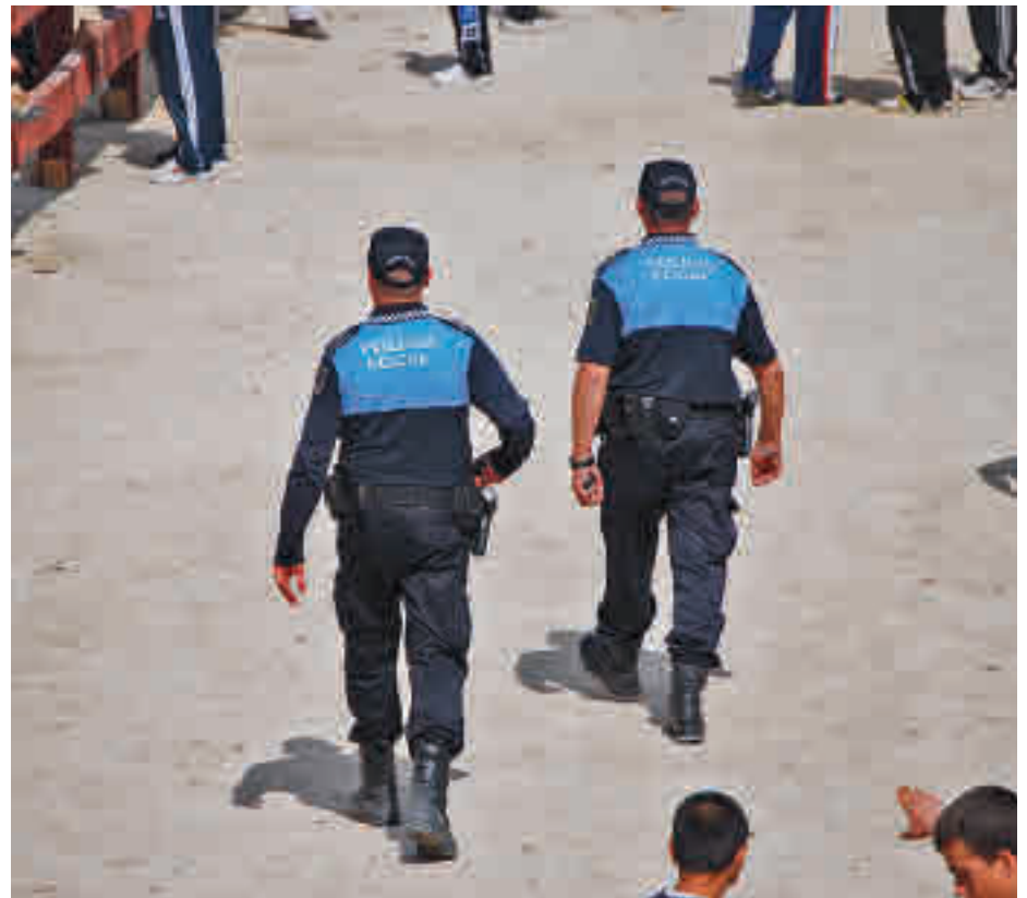
Policía Local de Coslada, en labores de vigilancia

Estas fiestas, además, contarán con la intervención de un colectivo de jóvenes, que trabajarán como voluntarios para prevenir y ayudar a que haya una disfrute sano y pacífico por parte de aquellos jóvenes que acuden por primera vez de manera autónoma al recinto ferial. Se ocuparán discretamente de estar atentos en los espacios donde se concentran mayor número de adolescentes y prestar su ayuda en caso de un consumo abusivo de alcohol u otras sustancias, de conflictos o agresiones y de velar para que no se produzcan acciones de acoso o agresión sexual contra las chicas. Estarán distribuidos en pequeños grupos y estarán