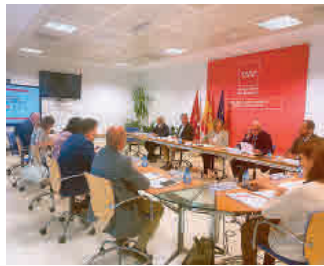
Reunión entre las diferentes administraciones