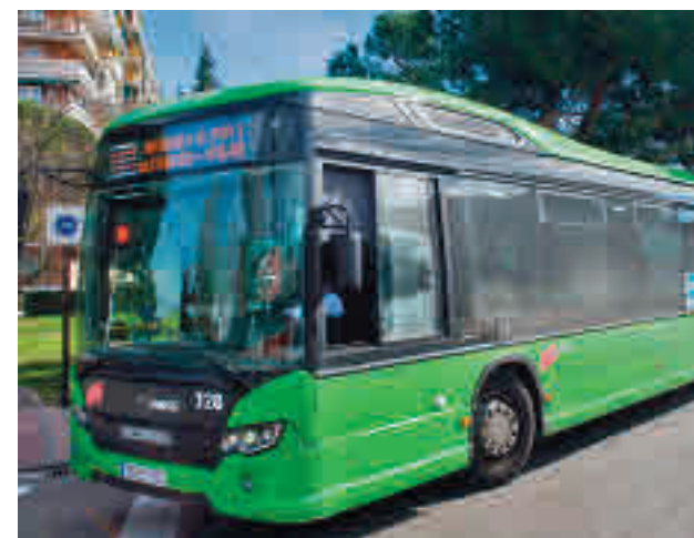
Autobús interurbano en Madrid

Díaz-Pache también indicó que el Ejecutivo regional está inmerso en la redacción de los reglamentos de los VTC y los taxis. Es el caso de la reducción de obligaciones, trabas y costes; que puedan disponer de vehículos de más de cinco plazas; flexibilidad en los descansos y vacaciones; o la contratación de plazas individuales.