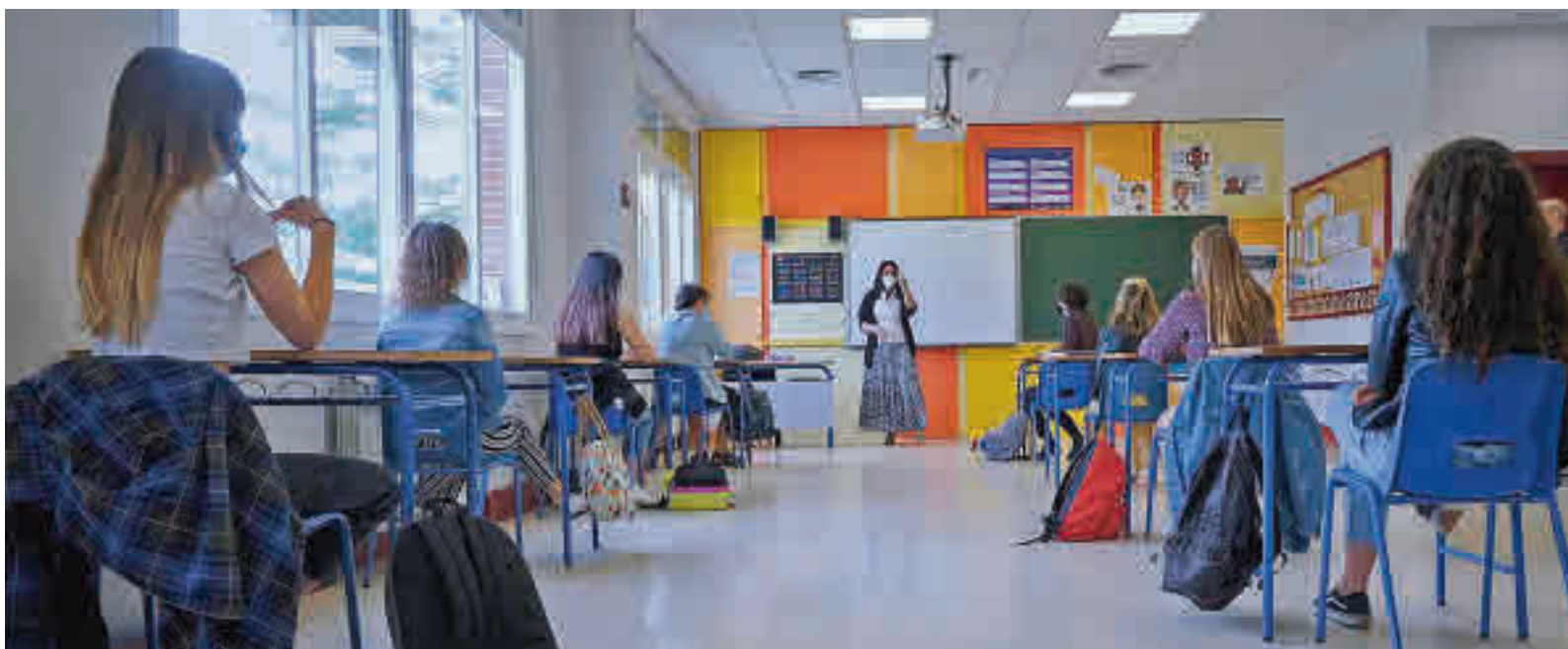
Clases de Bachillerato en un centro educativo madrileño