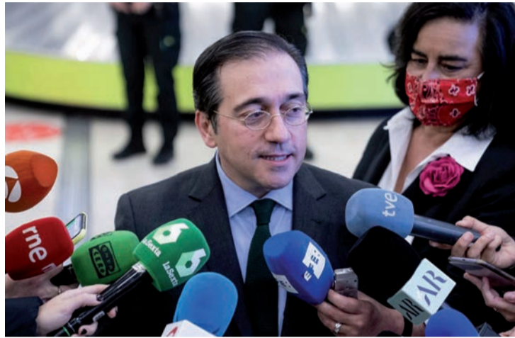
El ministro de Asuntos Exteriores, José Manuel Albares.

El Observatorio Global del Español estará presidido por el ministro de Asuntos Exteriores, José Manuel Albares, y lo formarán representantes de los Ministerios de Asuntos Económicos y Trans-