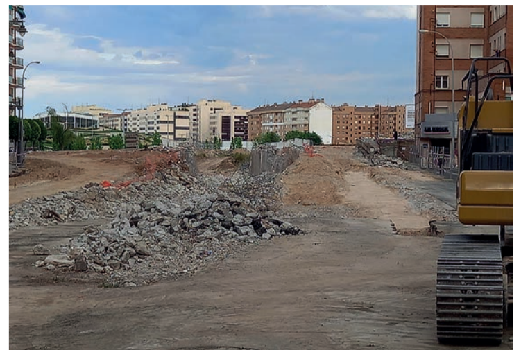
Imagen de cómo las máquinas acabaron con el logroñés túnel de Duques de Nájera.

URBANISMO | Proyecto para el Nudo de Vara de Rey