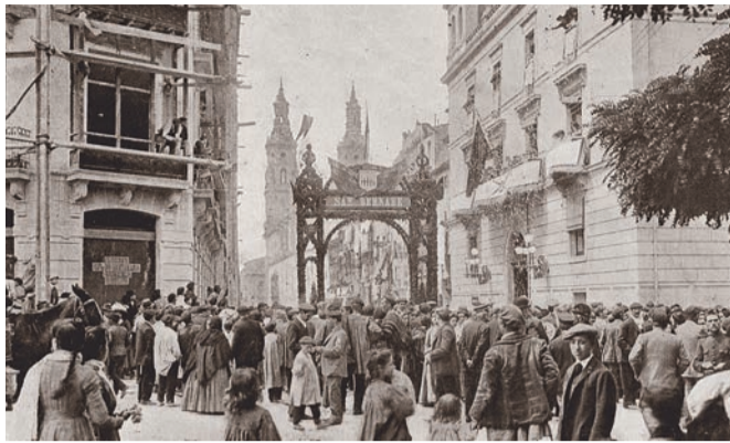
Arco de San Bernabé, 1910.