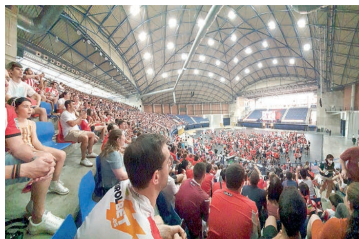
Los aficionados blanquirrojos que siguieron el playoff en el Palacio de los Deportes.