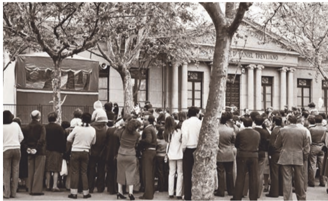
Fiestas de San Bernabé, 1980.