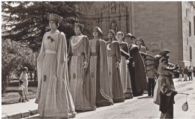
Gigantes y cabezudos, 1980.