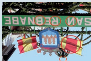
Las 7 diferencias