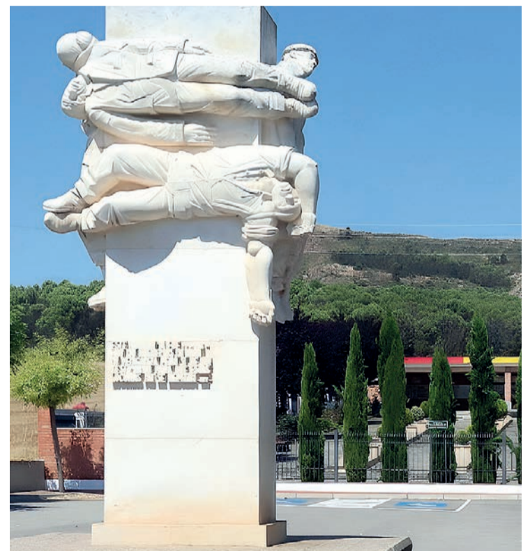
Imagen de la entrada de La Barranca, en Lardero.

La entidad también expresó su agradecimiento al Gobierno riojano y, en su nombre, a su presidenta, Concha Andreu, por este galardón: "Gracias por creer en nosotros. Nuestro compromiso es con los valores democráticos, que intentamos llevar a la sociedad riojana. Este alto reconocimiento no sólo pertenece La Barranca, sino que corresponde a toda la comunidad de La Rioja, con la que queremos compartir esta Medalla, pues siempre nos