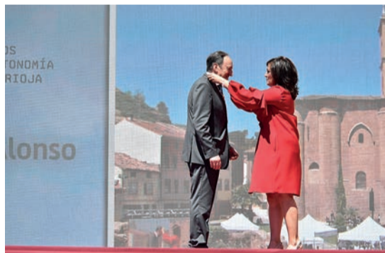
Pedro Sanz, expresidente de La Rioja, con su distinción.