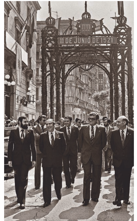
Corporación municipal, 1979.