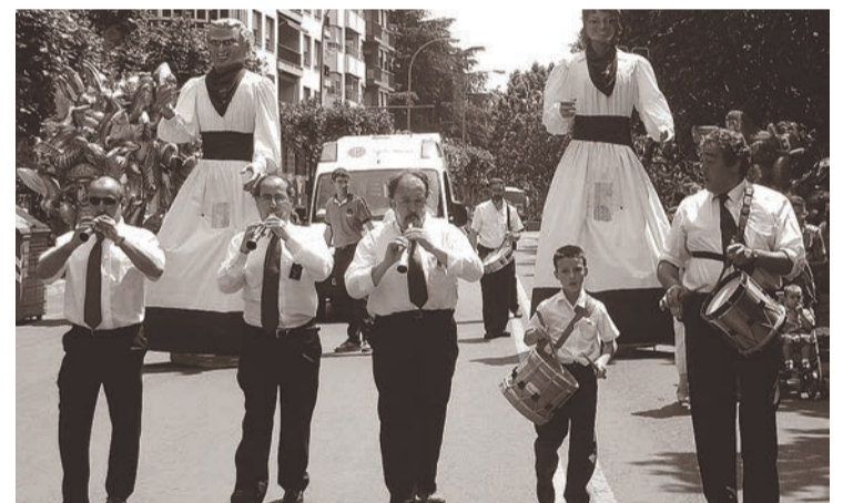
Un grupo de gaiteros, en la procesión de San Bernabé de 2007.