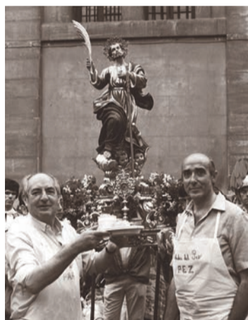
Ofrenda del Pez, 1982.