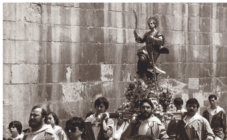
San Bernabé, portado por los peñistas, 1982.