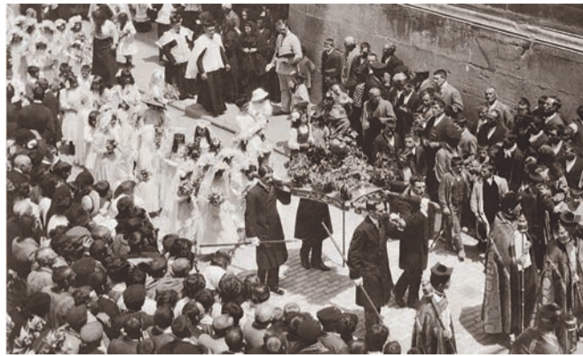
Procesión de San Bernabé, 1900.