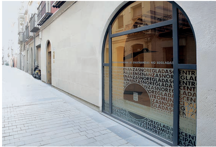
La fachada de la Universidad Popular de Logroño.