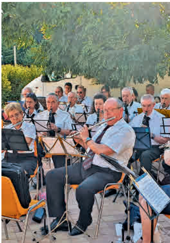
La actuación de la Banda de Música de Moratalaz inauguró las fiestas

EL CERTAMEN DE PINTURA RÁPIDA LLEGARÁ A SU XXIII EDICIÓN EL 18 DE JUNIO