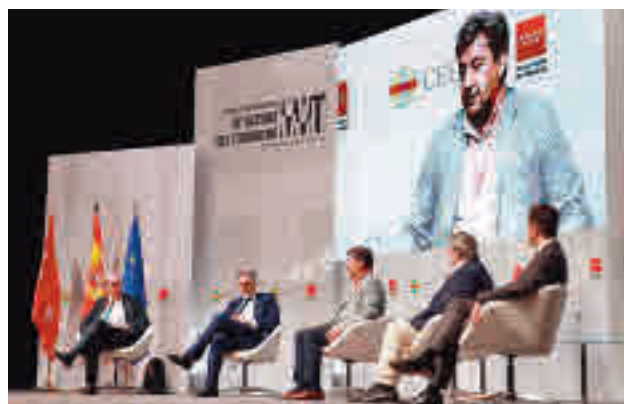
Congreso de Víctimas del Terrorismo

El Congreso Internacional de Víctimas del Terrorismo celebrado esta semana en Madrid ha pedido en sus conclusiones perfeccionar la primera intervención a las víctimas que sufran un atentado y darles un papel en la educa-