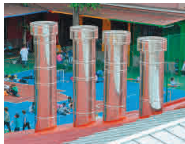
Las chimeneas situadas junto al centro escolar FRAVM

En el auto, que todavía no es firme, el magistrado expone que es “indudable” que hay “perjuicios a los vecinos” derivados de la limpieza y tratamientos de residuos, así como de la contaminación acústica, dado que el proyecto no ha valorado el ruido provocado por los vehículos y motocicletas destinadas al reparto de comida a domicilio a establecimientos de res-