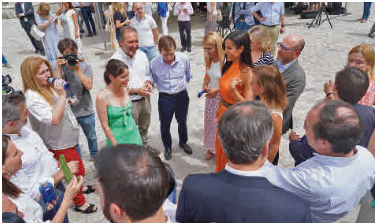
Miembros del Gobierno municipal conversan minutos antes del comienzo del acto de balance de legislatura