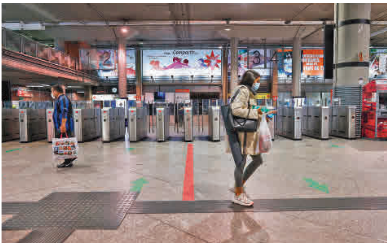
Transporte público en la Comunidad de Madrid