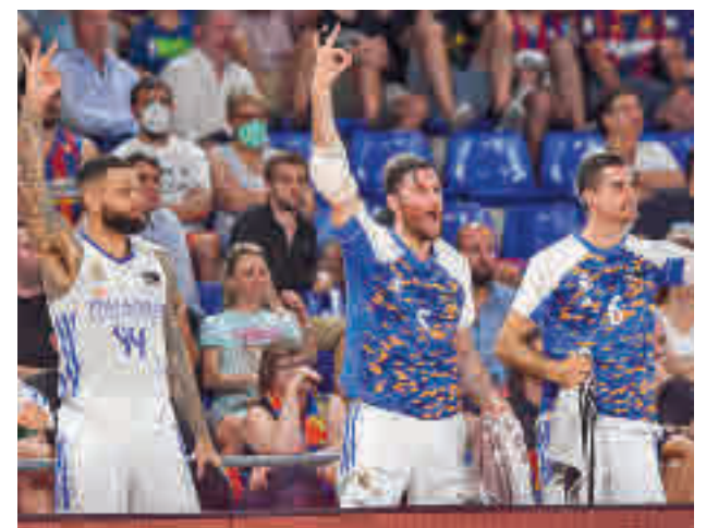
Los blancos dominaron con claridad el primer partido

asegurado, al menos, un cuarto partido. Este se jugará de nuevo en el WiZink Center, concretamente el domingo a partir de las 18 horas. Si alguno de los dos equipos es capaz de encadenar dos victorias habría campeón este domingo, aunque no es descabellado pensar que todo se resolverá en el quinto, que se jugaría el miércoles 22.