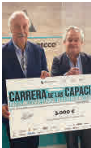
Vicente Del Bosque

El pasado domingo se celebró una nueva edición de la Carrera de las Capacidades, que congregó a más de mil participantes. Además, Fundación Adecco reconoció al exentrenador Vicente del Bosque por su compromiso social con la inclusión de las personas con discapacidad.