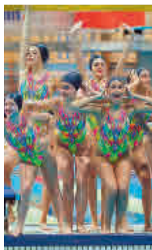
Éxitos en la M-86

edición del Campeonato de Madrid de Verano de natación artística, una disciplina en la que los jóvenes deportistas regionales siguen de-