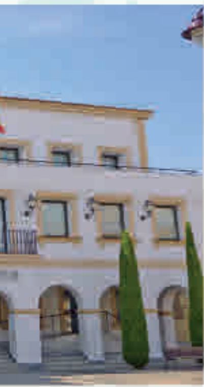
de los Reyes.