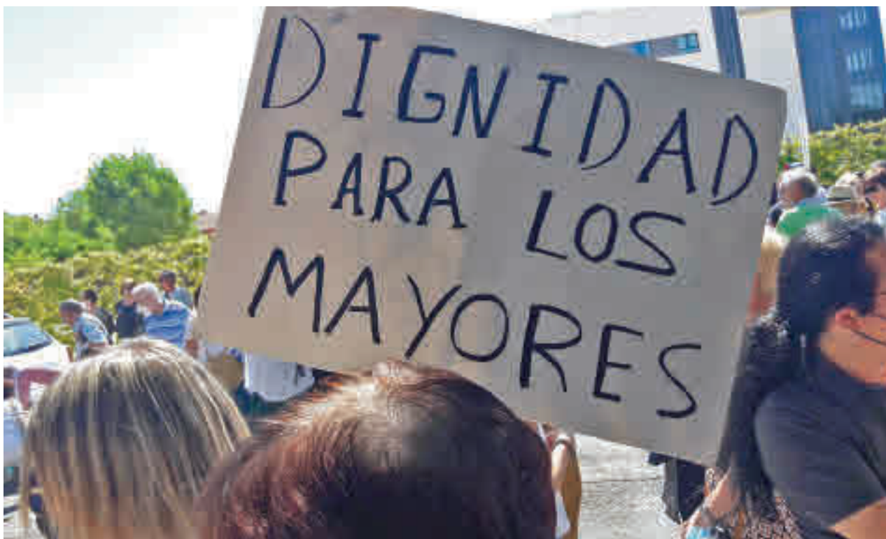
Decenas de familiares se manifestaron en las puertas de la residencia