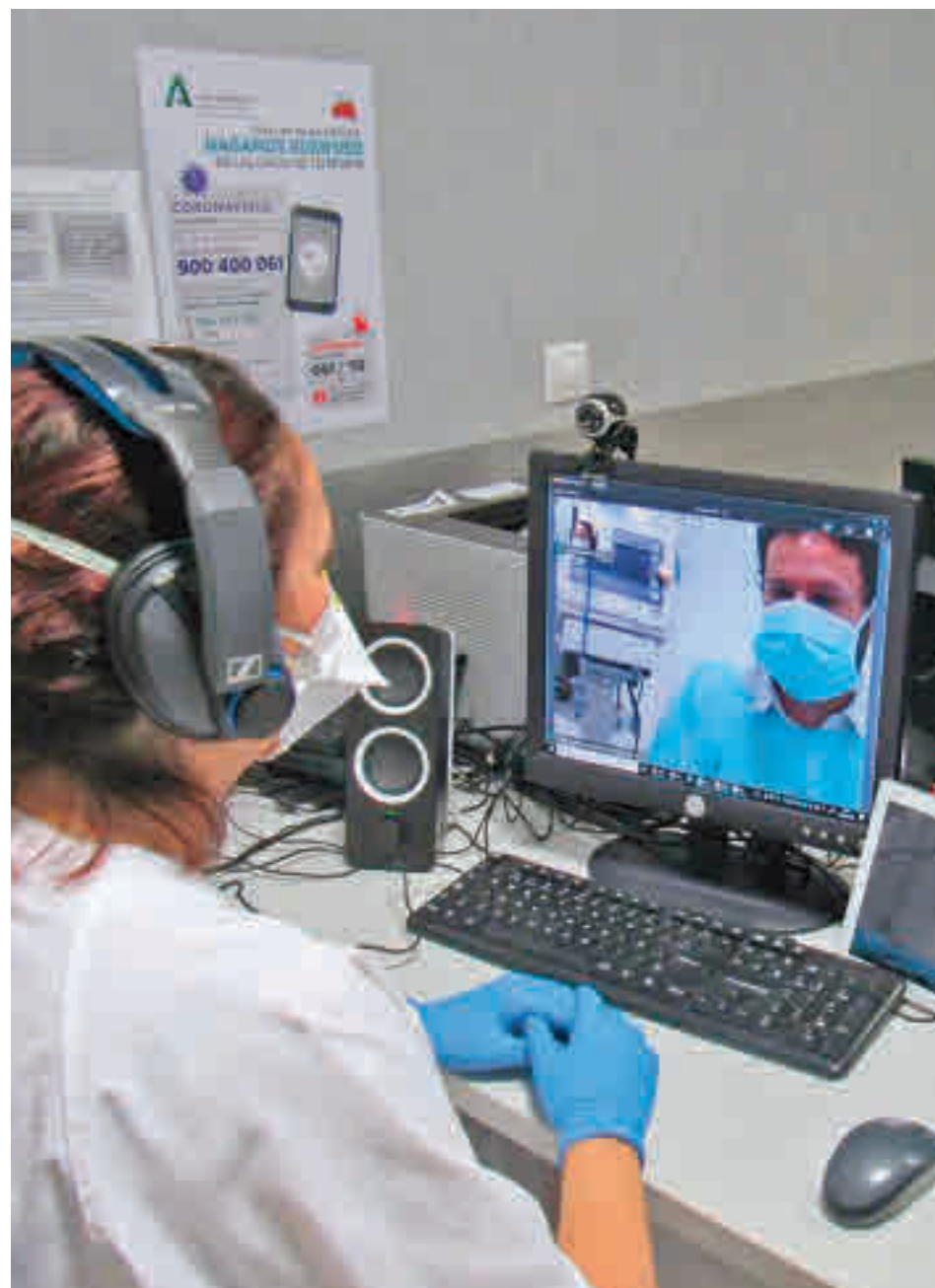
Un paciente y su médico, en una teleconsulta

Para ello, Cigna, la aseguradora de salud, destaca el uso complementario de la medi-