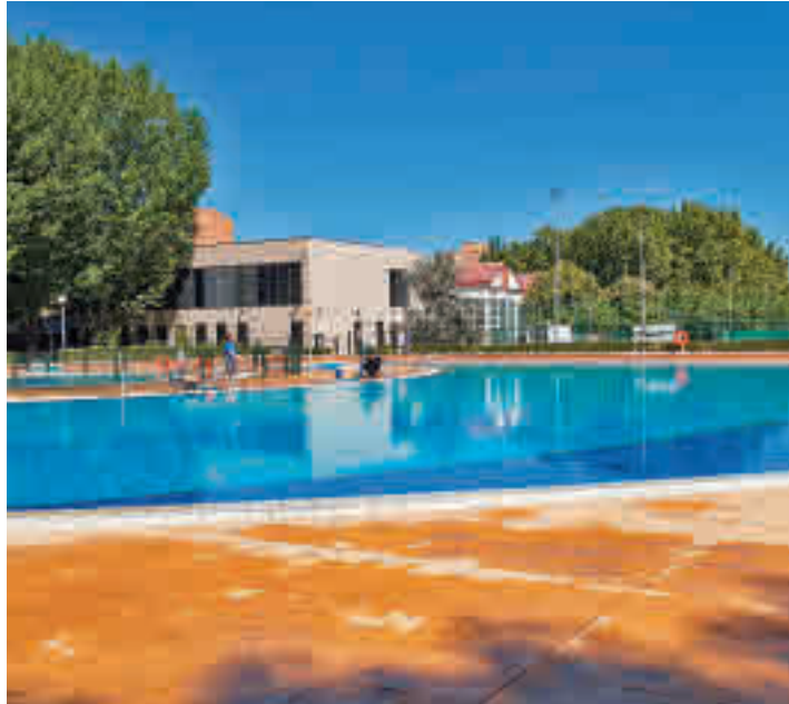
Piscina municipal de El Carrascal

Para obtener las entradas es necesario estar registrado previamente a través de esta