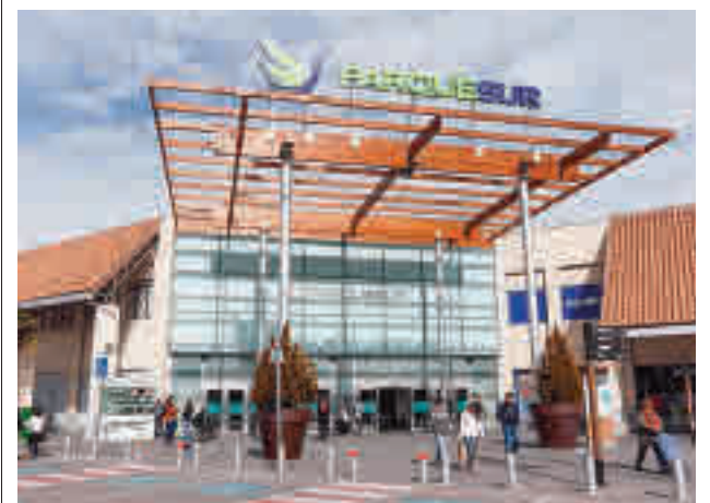
Centro comercial Parquesur

Por su parte, el precio para personas no empadronadas es de 10,40 euros adultos y 5,20 euros infantil. Estos usuarios no pueden adquirir bonos.