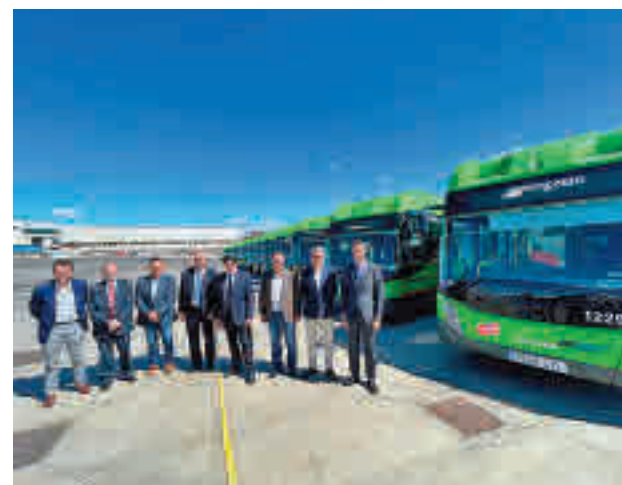
Presentación de la nueva flota de autobuses

Los nuevos autocares permiten reducir las emisiones de CO2 respecto a los que utilizan combustible diésel un 20%, y las partículas y óxidos de nitrógeno un 85%, además de reducir el ruido un 50%. Disponen de un depósito de 2.050 litros de gas natural comprimido, y un equipamiento en el que se ha com-