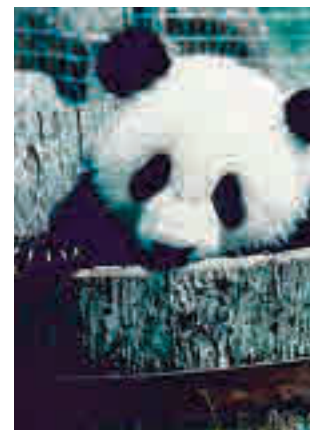
Nacimiento de Chu Lin

Con esta exposición el público podrá conocer algunos de los proyectos de investigación, conservación y educación que han hecho evolucionar al zoológico desde su apertura en el año 1972 y que le han convertido en un