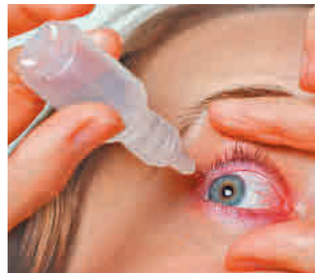
Las lágrimas artificiales son útiles para evitar la sequedad

En las piscinas y playas hay que tener cuidado con el cloro. En exceso, puede irritar y resultar perjudicial. Además, en las piscinas también se pueden encontrar algunas bacterias y microorganismos. Por ello, se recomienda el uso de gafas de bucear para proteger los ojos. Además, también se recomienda usar menos las lentillas, ya que favorecen la sequedad de los ojos.