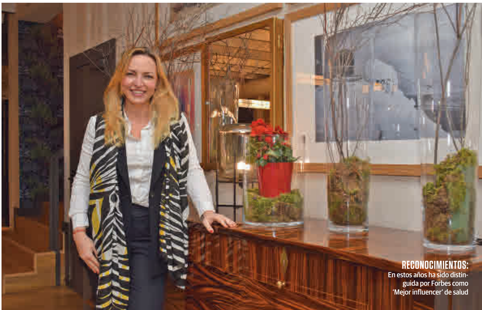
RECONOCIMIENTOS: En estos años ha sido distinguida por Forbes como 'Mejor influencer' de salud

"SI NO SIENTE CONFIANZA, EL ADOLESCENTE PIDE AYUDA FUERA DE CASA"