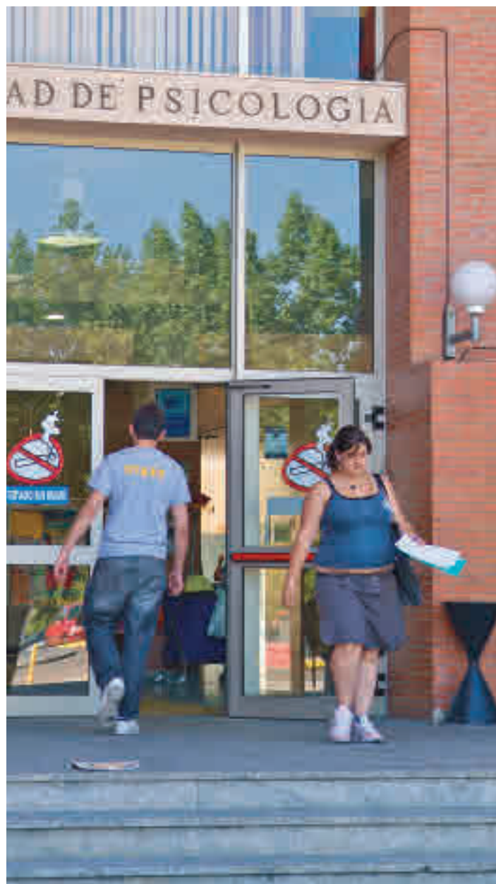
Estudiantes en una universidad madrileña

El texto incluye otra serie de novedades, como la exención del pago a los jóvenes con premios extraordinarios y su ampliación a los colectivos de víctimas de violencia de género, participantes en operaciones de paz y seguridad y los beneficiarios del Ingreso Mínimo Vital. De igual modo, se mo-