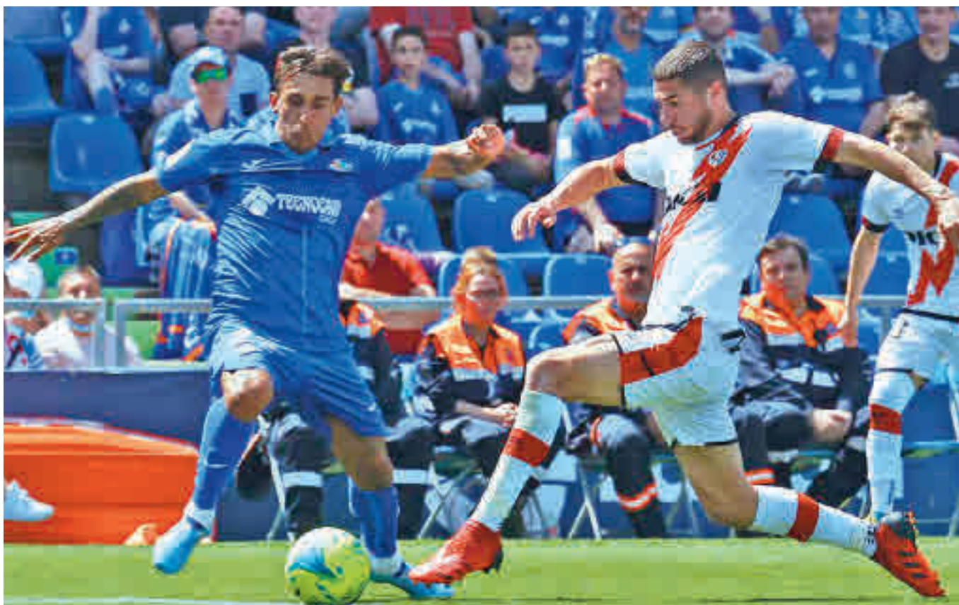
Getafe y Rayo se ganaron su continuidad en la máxima categoría