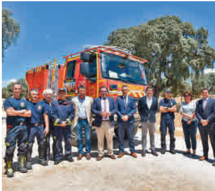
Foto de familia de la visita institucional

A este grupo especial, que trabaja en turnos de maña-