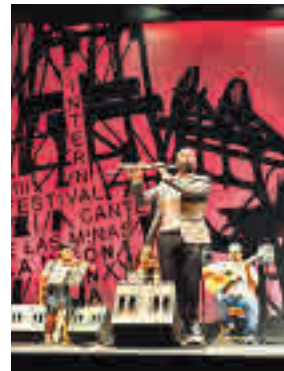
'Xatafi Flamenco' en Getafe

» Sábado 2 y domingo 3. Hospitalillo de San José. Gratuito