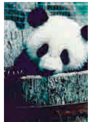
Nacimiento de Chu Lin

Con esta exposición el público podrá conocer algunos de los proyectos de investigación, conservación y educación que han hecho evolucionar al zoológico desde su apertura en el año 1972 y que le han convertido en un