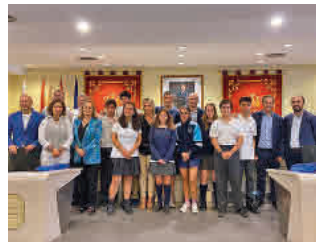
Acto de entrega de los diplomas

"Por ello seguiremos trabajando", ha concluido su intervención el primer edil majariego.