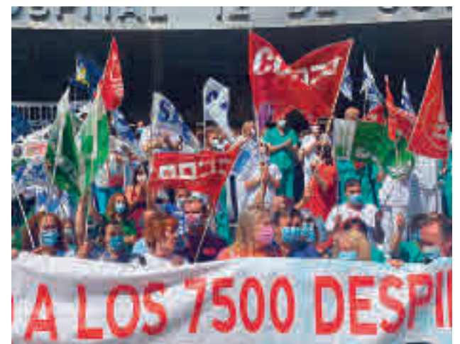
Protestas en el 12 de Octubre CCOO MADRID

"Falta de personal no hay", respondió el consejero de Sanidad, Enrique Ruiz Escudero, al ser preguntado por estas protestas. "No hay ningún tipo de recortes; es más, se ha reforzado por parte del personal", insistió Ruiz Escudero, que destacó que que la Urgencia es el recurso "más elástico de todos" y negó que hayan aumentado los ingresos hospitalarios.