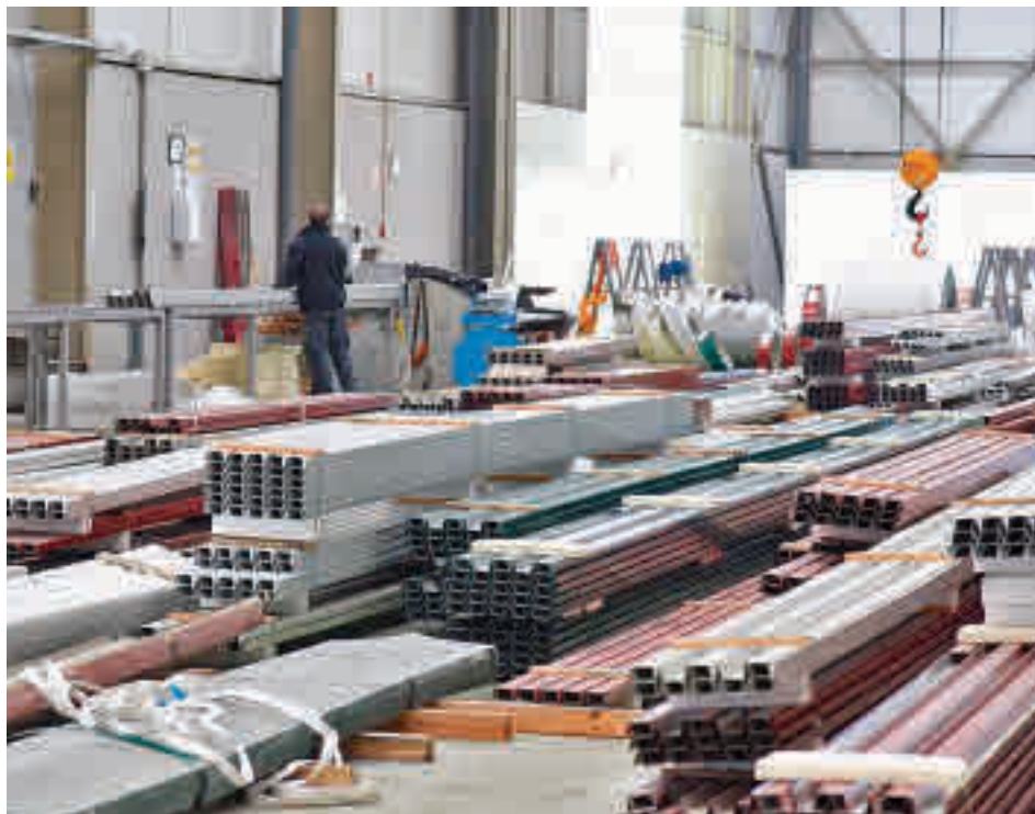
Las cuotas de los autónomos serán progresivas

En 2024, esa cuota de 245 euros se rebajaría a 237, mientras que en 2025 quedaría en 230 euros. En el caso de los autónomos con ingresos