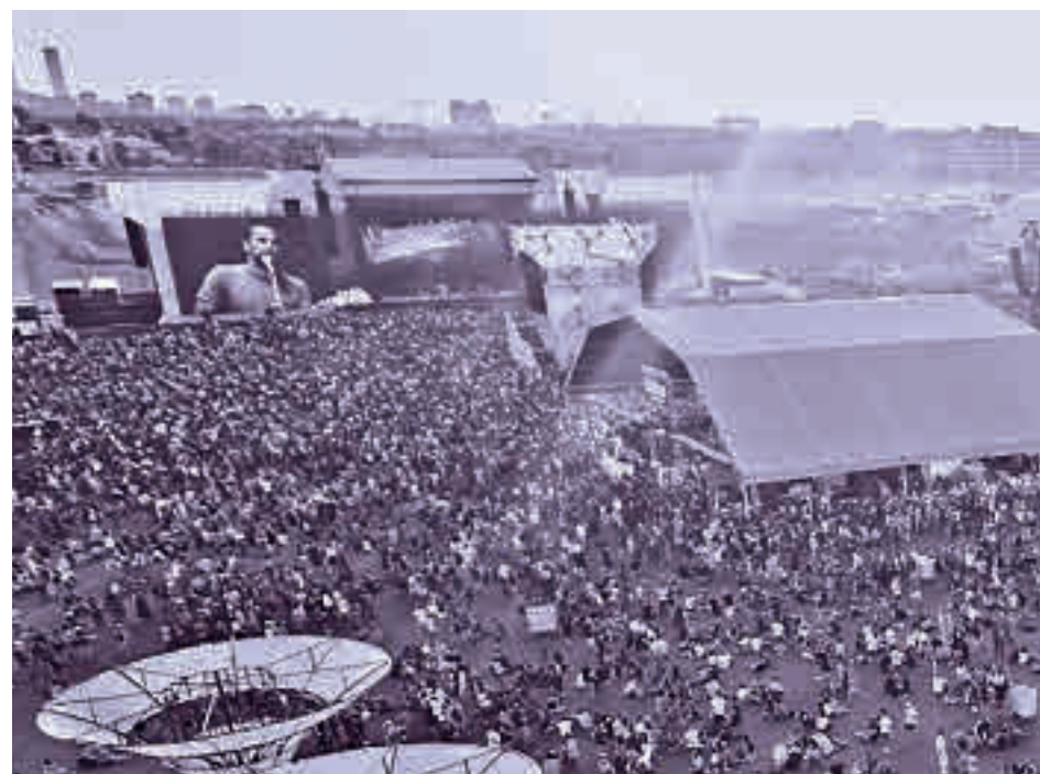
Mad Cool recupera su actividad con más duración: el festival se alarga hasta los cinco días

FESTIVAL RÍO BABEL, EN LA CAJA MÁGICA, TIENE UN CARTEL MUY NACIONAL