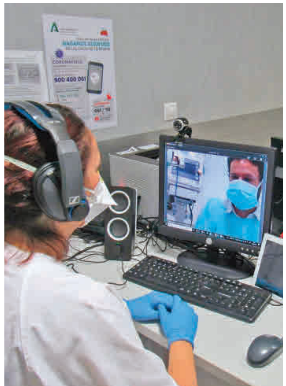
Un paciente y su médico, en una teleconsulta

Para ello, Cigna, la aseguradora de salud, destaca el uso complementario de la medi-