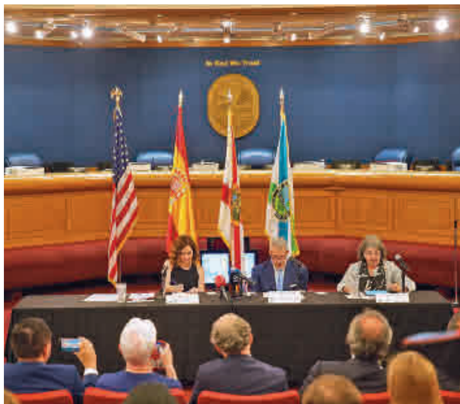
Isabel Díaz Ayuso, durante su visita oficial a Miami

Por el contrario, entre las ciudades más caras para vivir se encuentran Hong Kong, Zúrich y Ginebra, seguidas por otras dos de Suiza (Basilea y Berna) y tres asiáticas (Singapur, Tokio y Pekín).