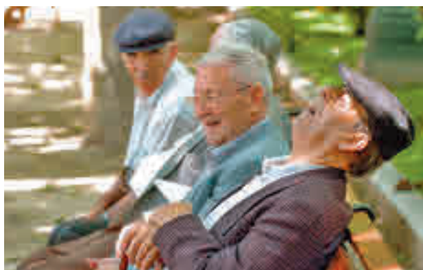
La subida de las pensiones es más alta de lo previsto

“Esto no significa que pidan recortes”, ha puntualizando, señalando que, al contrario, “permite un aumento de gasto corriente de 15.000 millones de euros”. “El proble-