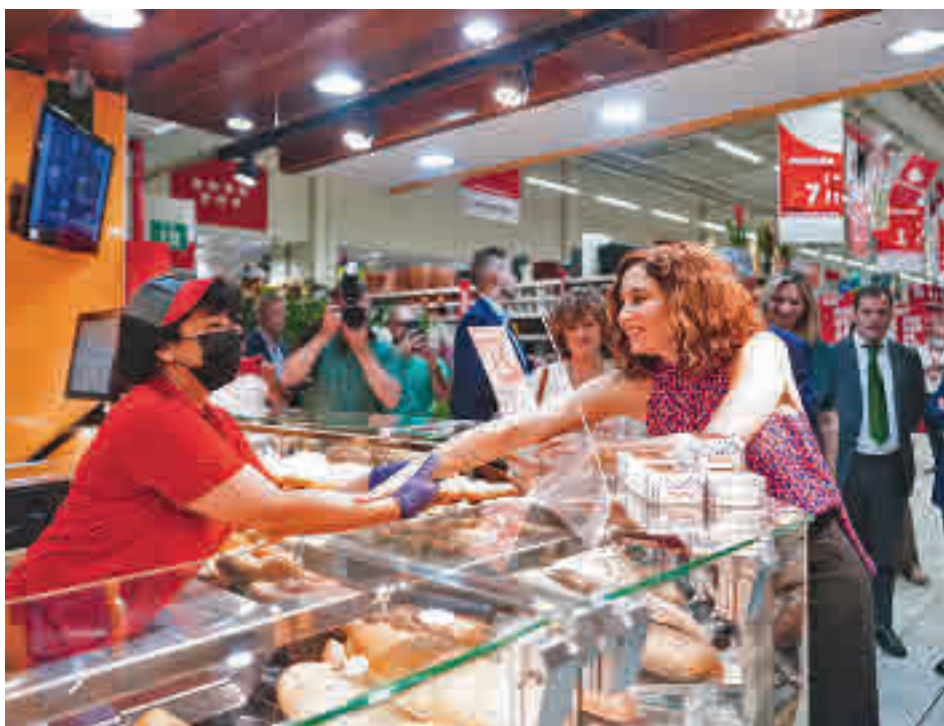
La presidenta da la mano a una empleada del hipermercado vallecano

Toda la actualidad de los distritos de Madrid, en nuestra web