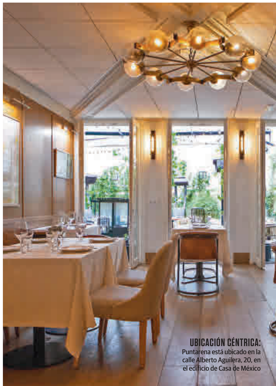
UBICACIÓN CÉNTRICA: Puntarena está ubicado en la calle Alberto Aguilera, 20, en el edificio de Casa de México

Pero toda esta propuesta no tendría sentido si el personal no hiciera gala de una profesionalidad y trato cercano que dotan a este restaurante de un toque familiar, en el que las recomendaciones se ajustan siempre a las preferencias del cliente.