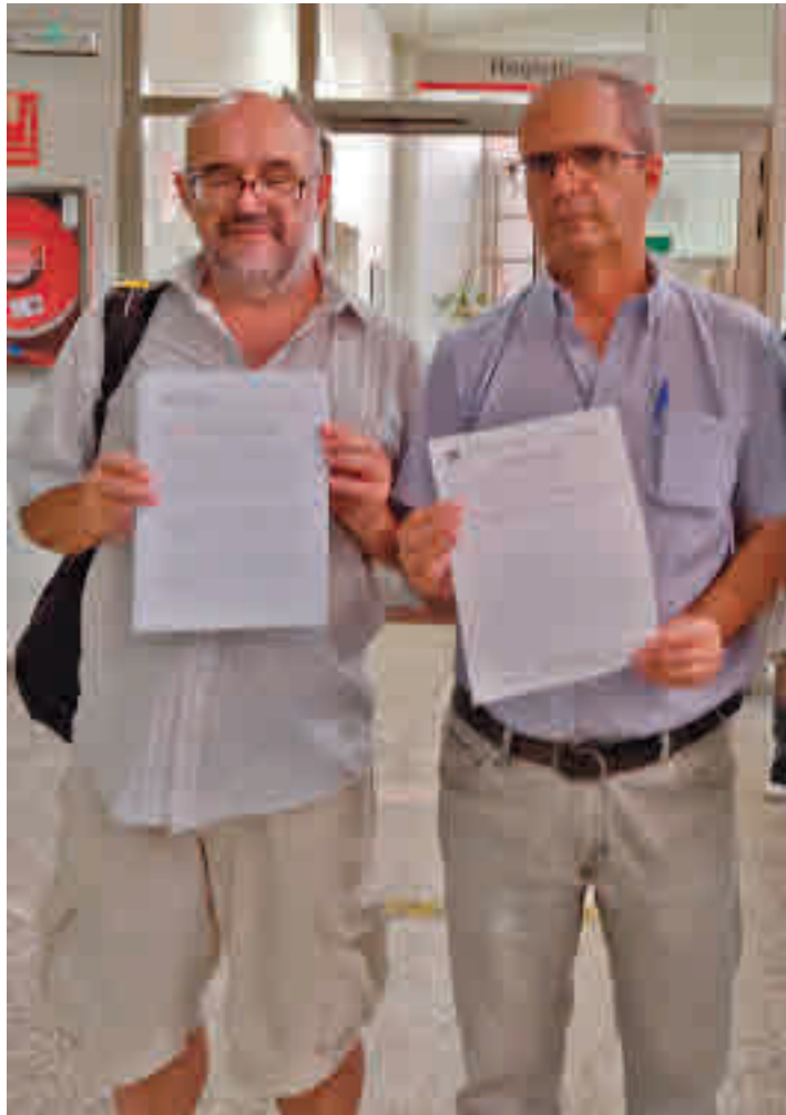
Los representantes vecinales, tras el registro de la solicitud

LOS RESIDENTES QUIEREN QUE ALBERGUE EQUIPAMIENTOS PÚBLICOS