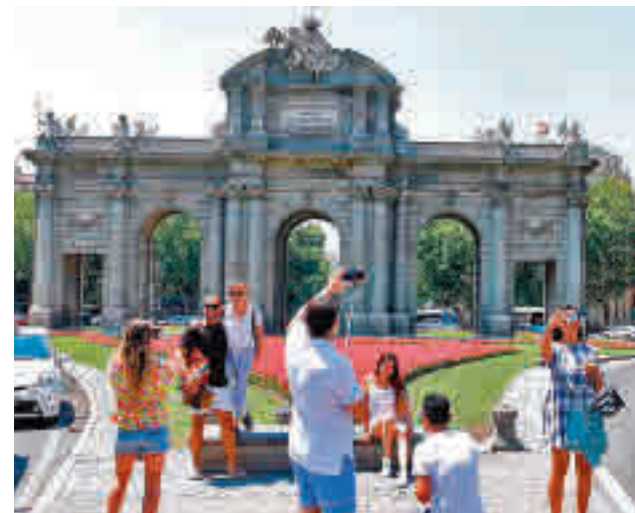
Turistas en el centro de Madrid

Por número de visitantes, Madrid fue la sexta región de España, con el 8,2% del total de los turistas nacionales.