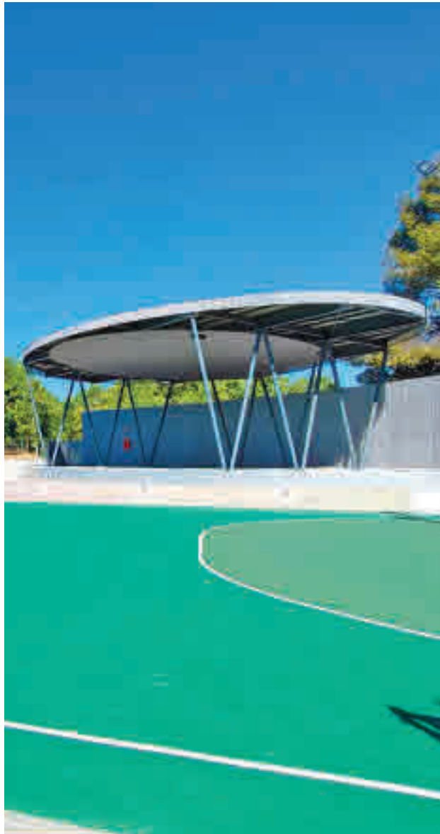
La pista deportiva con el escenario al fondo

Tras la actuación, el espacio principal cuenta con una plataforma elevada a modo