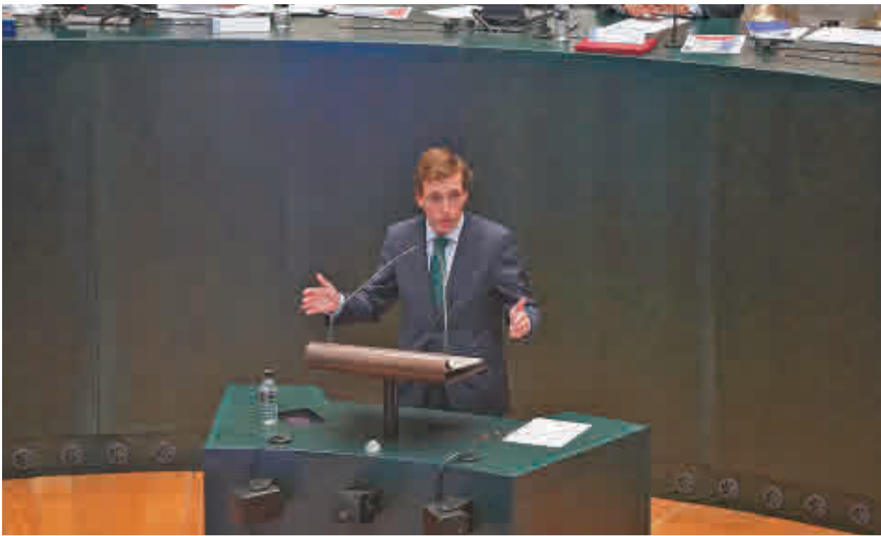
La intervención del alcalde de Madrid desde la tribuna del Pleno de Cibeles