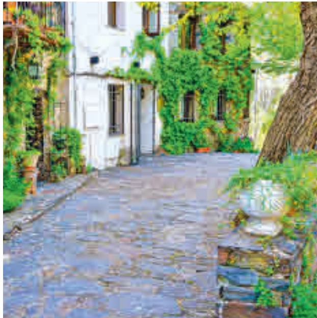
Madrid quiere promocionar el turismo rural

La Comunidad de Madrid tendrá durante los próximos meses su primera gran campaña para promocionar la oferta turística rural de la región y presentarla como un "destino atractivo" para el ocio. La iniciativa se centrará en difundir a las once Villas de Madrid, localidades únicas reconocidas por la riqueza de su patrimonio, y los territorios integrados en el proyecto MadRural: Sierra Norte, Sierra Oeste y Las Vegas-La Alcarria. El Consejo de Gobierno autorizó la pasada semana una inversión de casi un millón de euros para esta