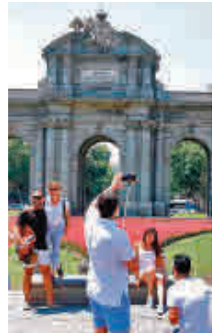
Turistas en el centro

La Comunidad de Madrid recibió un total de 568.155 turistas internacionales durante el mes de mayo, lo que supone multiplicar por 6,55 las cifras con respecto al mismo mes de 2021, según los datos de la encuesta Frontur publicada este lunes por el Instituto Nacional de Estadística (INE). De enero a mayo, la Comunidad de Madrid recibió 2,09 millones de turistas extranjeros, que realizaron un gasto de 3.205 millones de euros, el 12% del total del gasto captado en el país por el turismo emisor a España, siendo la quinta región por detrás de Canarias, Cataluña, Andalucía e Islas Baleares. Los visitantes foráneos realizaron un gasto en la