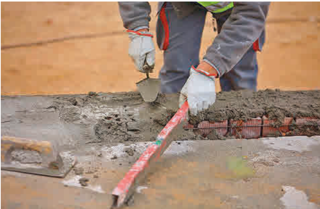
Obras en un centro escolar de Las Rozas