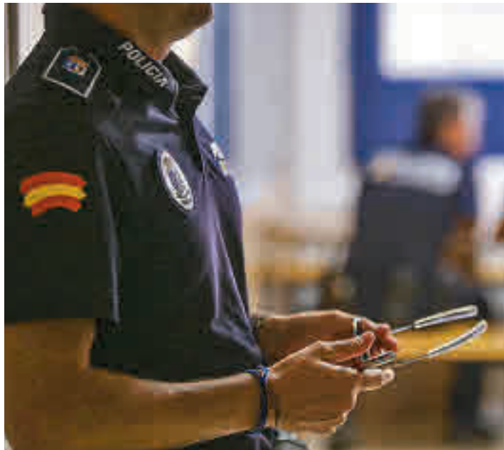
La Policía Local ofrece un servicio de custodia de llaves

El Ayuntamiento de Las Rozas activó el pasado 1 de julio, el Plan Vacaciones Seguras 2022, un programa que, según fuentes municipales, tiene como fin prevenir robos o cualquier hecho fortuito que pueda afectar a las viviendas y comercios cuyos propietarios se ausenten con motivo de las vacaciones estivales y queden desocupadas durante los meses de julio a septiembre. Además, contempla establecer medidas especiales en espacios públicos y en