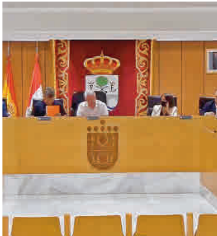
Imagen de archivo de una sesión plenaria

La aprobación de este montante económico está destinada, entre otras cosas, a reforzar el mantenimiento de la red viaria, la peatonalización de la calle Real y del centro histórico, el adelanto de 249.000 euros del Plan de Inversiones Regional para la remodelación de barrios y del casco urbano y el refuerzo