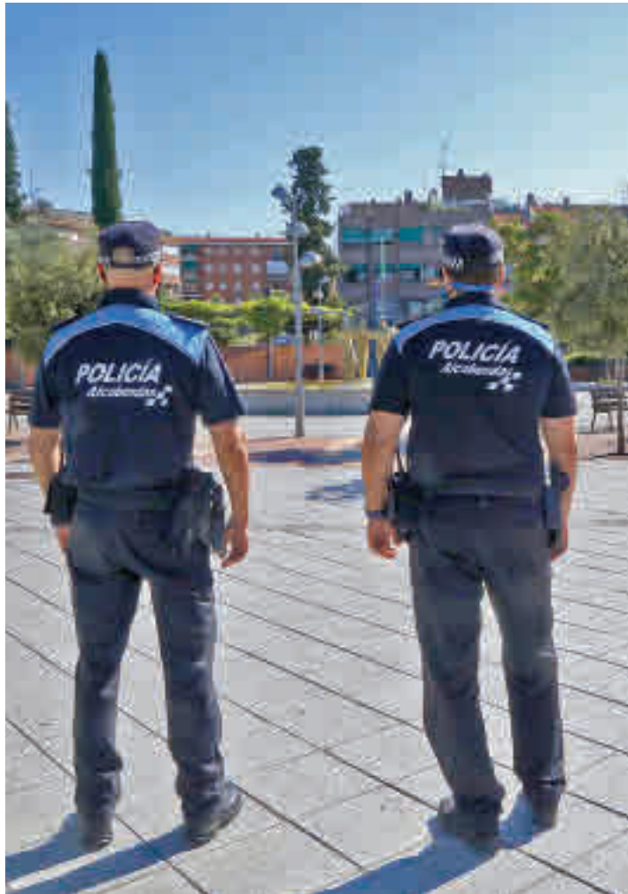
Habrà más agentes patrullando

EL PLAN TAMBIÉN INCLUYE LA INICIATIVA 'VACACIONES SEGURAS'