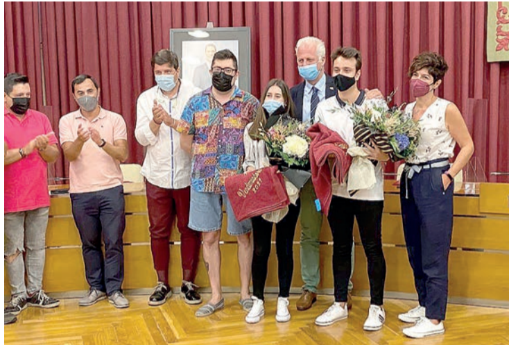
Los vendimiadores de San Mateo en 2021 y las instituciones logroñesas.