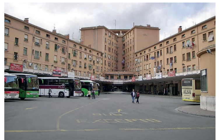
La actual estación de autobuses de Logroño.

trayectos de Nájera. Esta mejora del servicio del transporte rural se realizó previo consenso con las localidades a las que da acceso y con la empresa concesionaria. La iniciativa intenta adaptarse mejor a las necesidades de los usuarios, con el objetivo de propiciar un mejor empleo de los recursos públicos para que se reduzcan las emisiones de CO 2 .