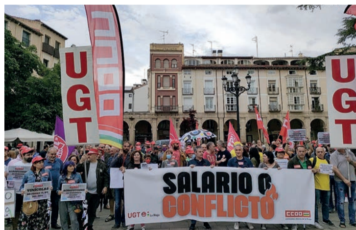
Manifestación de los sindicatos en la Plaza del Mercado.