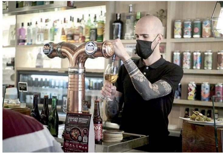
Un camarero sirve una cerveza en el interior de un bar con mascarilla.

La incidencia entre los mayores de 60 años en La Rioja es de 1.902 casos por cada 100.000 habitantes, lo que supone la cifra más elevada de todo el país. La ocupación hospitalaria es del 8,6% (60 pacientes), según el último informe del Ministerio de Sanidad, y del 9,4% (cinco) en la Unidad de Cuidados Intensivos. "Unos datos que llevan al Ejecutivo riojano a plantearse si se deben aplicar ciertas medidas dependiendo del seguimiento de los indicadores, aunque, de momento, sólo atención, manejamos bien la presión asistencial", en palabras del director general de Salud Pública, José Ignacio Aguado.