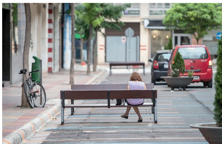
Fundición, una de las vías incluidas dentro de ‘Calles Abiertas’.

El documento pretende mostrar ejemplos de cómo las ciudades avanzan en la promoción de la salud y la prevención de la enfermedad a partir de criterios urbanísticos que contribuyen a fomentar entornos locales saludables, y ayuden a profesionales, a técnicos y a corporaciones en el diseño de localidades mejores para todas las personas. Según el propio dossier,