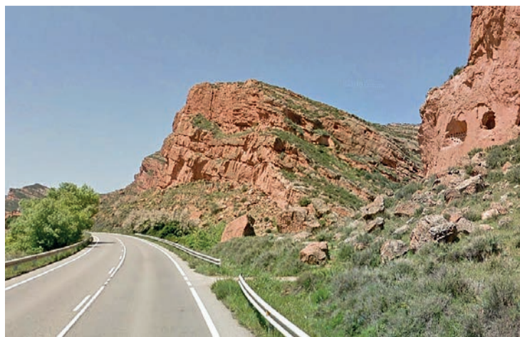
Una imagen de la carretera LR-115.

Cabe recordar que esta vía se acondicionó por última vez en 2007, en el tramo entre Arnedillo y el cruce con la carretera de Munilla, y desde entonces sufrió un tráfico intenso de camiones durante la construcción de la presa