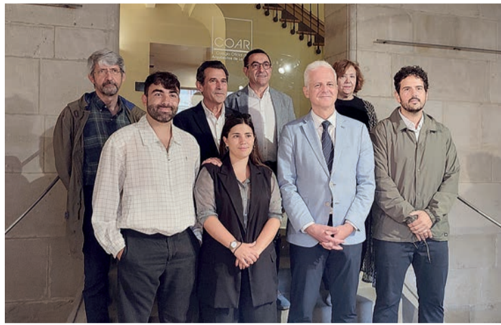
Instituciones y organizadores, en la presentación de Concéntrico 08.

En esta edición, Concéntrico explora nuevas prácticas y expande sus propuestas a localizaciones novedosas, como el Monte Cantabria, la zona inundable del río Ebro, la Rosaleda del Paseo del Espolón, la Concha del Espolón, el solar de la calle Marqués de San Nicolás 20 u Obispo Bus-