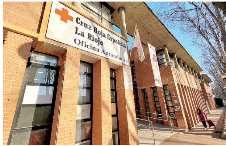
La sede de la Cruz Roja en La Rioja.

Consiste en un servicio que atiende las 24 horas del día cualquier situación de emergencia vinculada a distintas incidencias, preocupaciones, problemas o conflictos que puedan surgir en el ámbito social, concretamente sobre algunas áreas específicas, como pueden ser la violencia de género y la atención tanto a menores como a personas mayores.