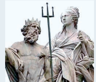
Neptuno y Cibeles, en Madrid.

calde de la localidad o del concejal de urbanismo. Porque a cualquiera que tenga un mínimo de conocimientos de arte no se le ocurre una cosa así. Las hay para todos los gustos, perdón, para los pésimos gustos. Y lo peor es que suelen costar una pasta gansa. Me había propuesto hacer una lista de las cuarenta principales, pero es que hay tantas que me resulta difícilísima la selección. En fin, que ya no se hacen rotondas como antes. Es decir, como la del Arco del Triunfo de París, por poner un ejemplo, o las de Cibeles o Neptuno, en Madrid.