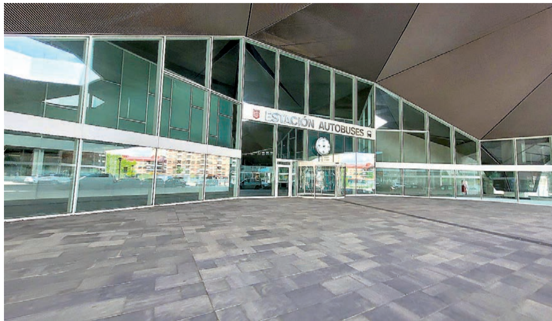
La nueva estación de autobuses de Logroño, todavía sin actividad.