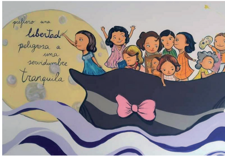
Mural del 'Laboratorio feminista' de Logroño.

De hecho, en el pasado mes de marzo, el Boletín Oficial de La Rioja publicaba las bases para la concesión de ayudas destinadas al desarrollo de actividades y proyectos que contribuyesen a fomentar la sensibilización y conciencia-