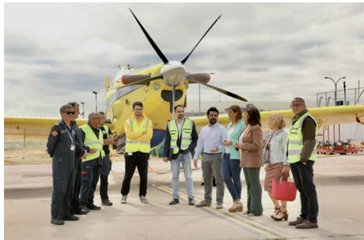
Las instituciones regionales, junto a los nuevos aviones para combatir incendios.

fuegos se reforzaron con la incorporación de dos aviones de carga en tierra AT-802, contratados por el Ministerio para la Transición Ecológica, con capacidad para 3.100 litros de agua y retardante, y con una tripulación formada por cuatro pilotos y un mecánico. La comunidad destina este año nueve millones de euros a prevenir y combatir los incendios.