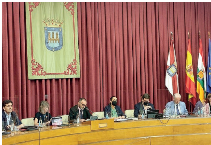
El Pleno de julio del Ayuntamiento logroñés, antes de que se suspendiera.