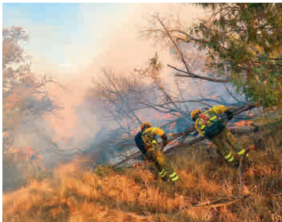
Incendio en la Comunidad de Madrid

El presunto autor del fuego fue sorprendido justo en el momento en el que estaba provocándolo junto a una zona de matorrales, gracias a un dispositivo conjunto organizado entre el Cuerpo de Agentes Forestales y la Policía Local del citado municipio. El operativo se organizó en base a la investigación de otros incendios en las mismas fechas que tuvieron lugar en la zona. La superficie afectada se elevó a 800 metros cuadrados de pasto, si bien también se quemó algún almenadro.