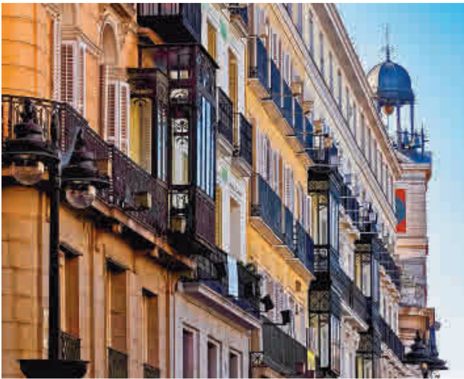
Viviendas en el centro de la capital