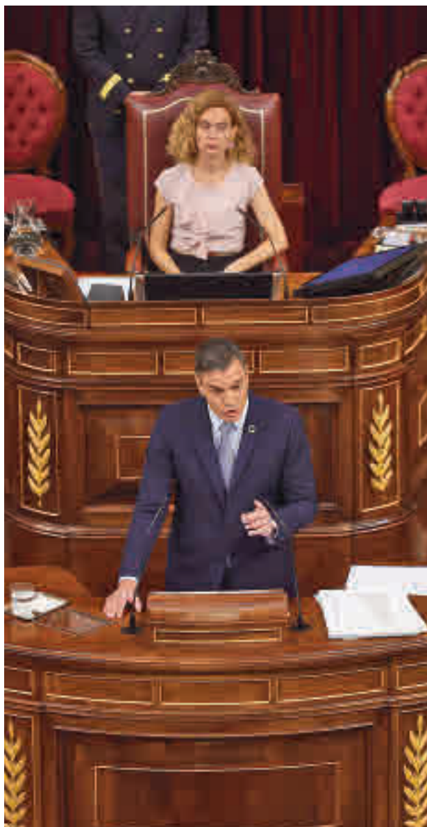
Pedro Sánchez, durante el Debate del Estado de la Nación

A la espera de conocer más detalles sobre la manera en la que se articulará la medida, las reacciones a la misma no se han hecho esperar. Una de las primeras fue la de la presidenta de la Comunidad de Madrid, Isabel Díaz Ayuso, que la tildó de "broma". Ayuso considera que más que subvencionar los viajes en la red de Cercanías "ya podrían