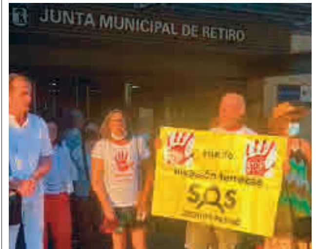
La protesta a las puertas de la Junta Municipal de Retiro