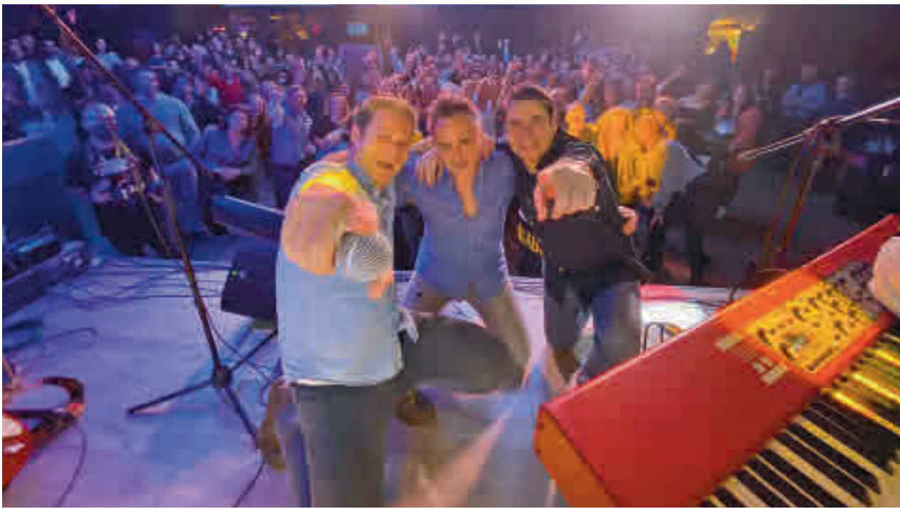
El grupo madrileño Modestia Aparte, en concierto