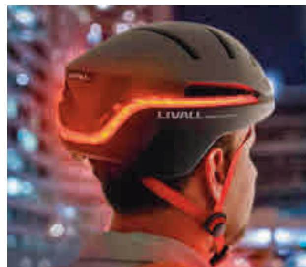
Casco inteligente LIVALL LIVALL

"Nos importa la seguridad de los 'riders' que entre-