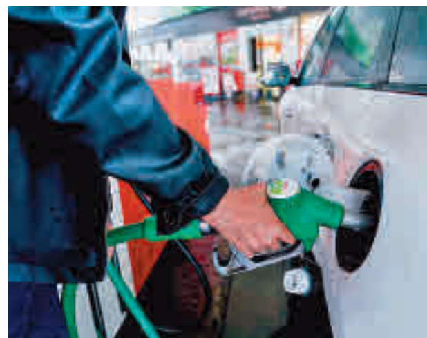
Gasolinera en Madrid

"Sería conveniente una actuación valiente ante la dramática situación que viven miles de autónomos que son los principales afectados por el incremento sin preceden-