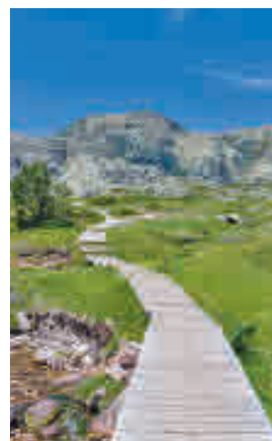
Sierra del Guadarrama

Los amantes de la cultura también vivirán sus experiencias favoritas en la posada romana El Beneficio, en Collado Mediano; el pasado remoto de la aldea visigoda de Hoyo de Manzanares, y el yacimiento de El Rebollar en El Boalo; el Castillo de los Mendocinos de Manzanares El Real; y las atarjeas de los Manantiales del Robledo, en Moralzarzal.