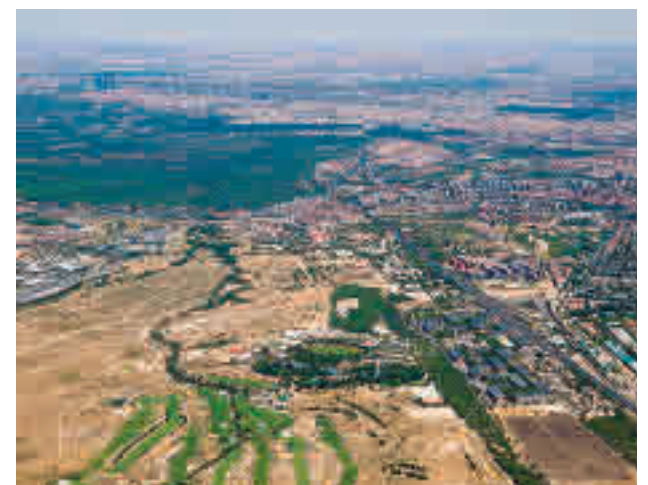
Una imagen aérea de los terrenos de Campamento (Latina)

Por otro lado, el primer edil de la capital recordó que "hace 16 años ya (José Luis Rodríguez Zapatero anunció el desbloqueo" de esta misma Operación", por lo que pidió a Pedro Sánchez "que cumpla y no solo anuncie", al tiempo que destacó que "el Ayuntamiento tiene deberes hechos desde el punto de vista urbanístico".