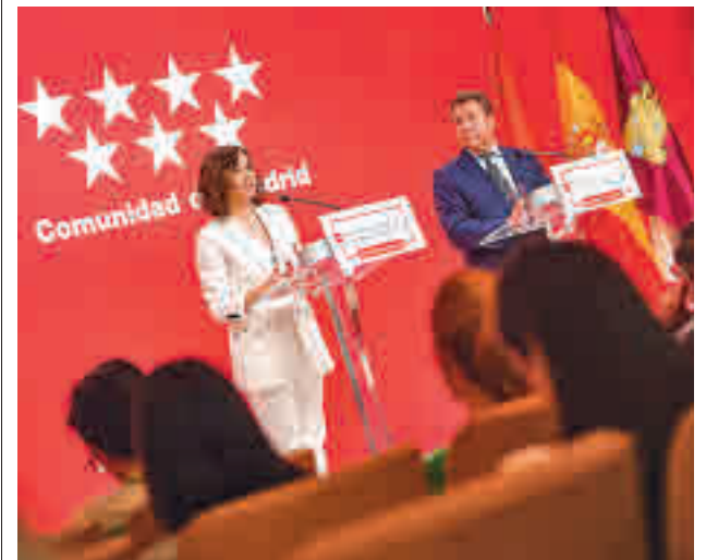
Firma de los presidentes regionales