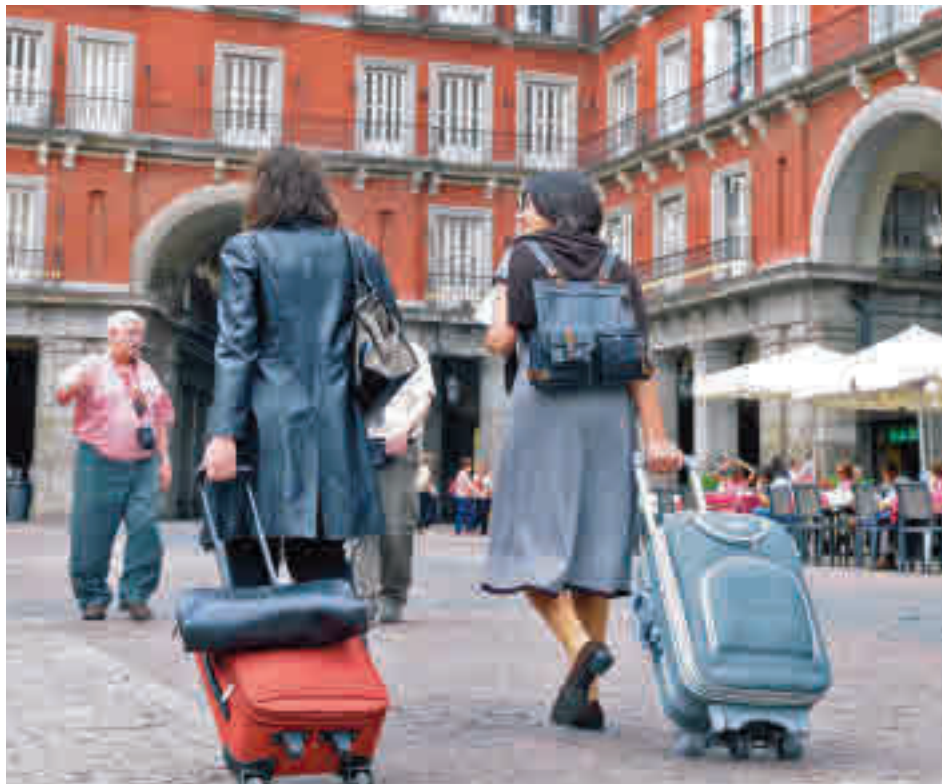
Dos turistas recorren con sus maletas la Plaza Mayor

Unas cifras que rozan ya los niveles prepandemia si se comparan con los datos de 2019, solo un 8,63% por encima de los alcanzados este 2022, y que, según el Consistorio, son un claro indicador de la progresiva recuperación del turismo que está experimentando la capital. En los primeros seis meses del año el número de atenciones ya ascendió a 835.499, un 268% más que en 2021.