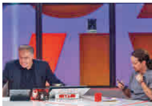
García Ferreras y Pablo Iglesias

EL PERIÓDICO GENTE NO SE RESPONSABILIZA NI SE IDENTIFICA CON LAS OPINIONES QUE SUS LECTORES Y COLABORADORES EXPONGAN EN SUS CARTAS Y ARTÍCULOS