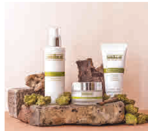
Cremas y cosmética también tienen cabida

Esta labor pedagógica ha sido una constante desde la creación de la compañía para “luchar contra un estigma y un statu quo que desde hace años no ha tenido claro que esta planta debía ser impulsada”, una batalla en la que “todo el sector estamos unidos”.