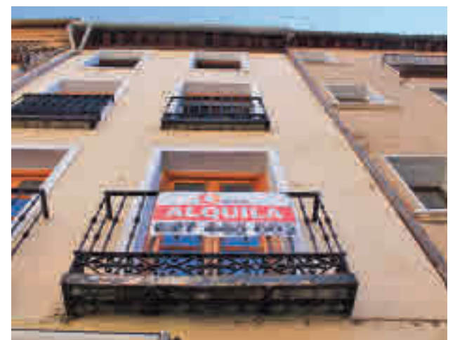
Viviendas en alquiler en Madrid

Por este motivo, algunas comunidades establecerán el límite del precio hasta los 900 euros al mes, también previsto en la norma. Según Fotocasa, un 71% de la oferta de viviendas en alquiler de las capitales cumplen con el límite de renta de los 900 euros, aunque precisa que este límite solo es aplicable en el caso de zonas tensionadas.