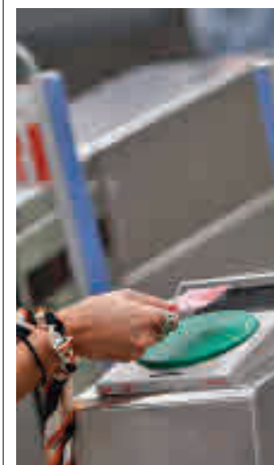
Metro de Madrid

mediata respuesta por su parte", señala Lobato en la misiva. Esta rebaja total se plantea hasta el 31 de diciembre y, una vez superada esa fecha, los socialistas proponen una tarifa plana de 30 euros y ampliar hasta los 30 años inclusive el abono joven, que cuesta 20 euros.