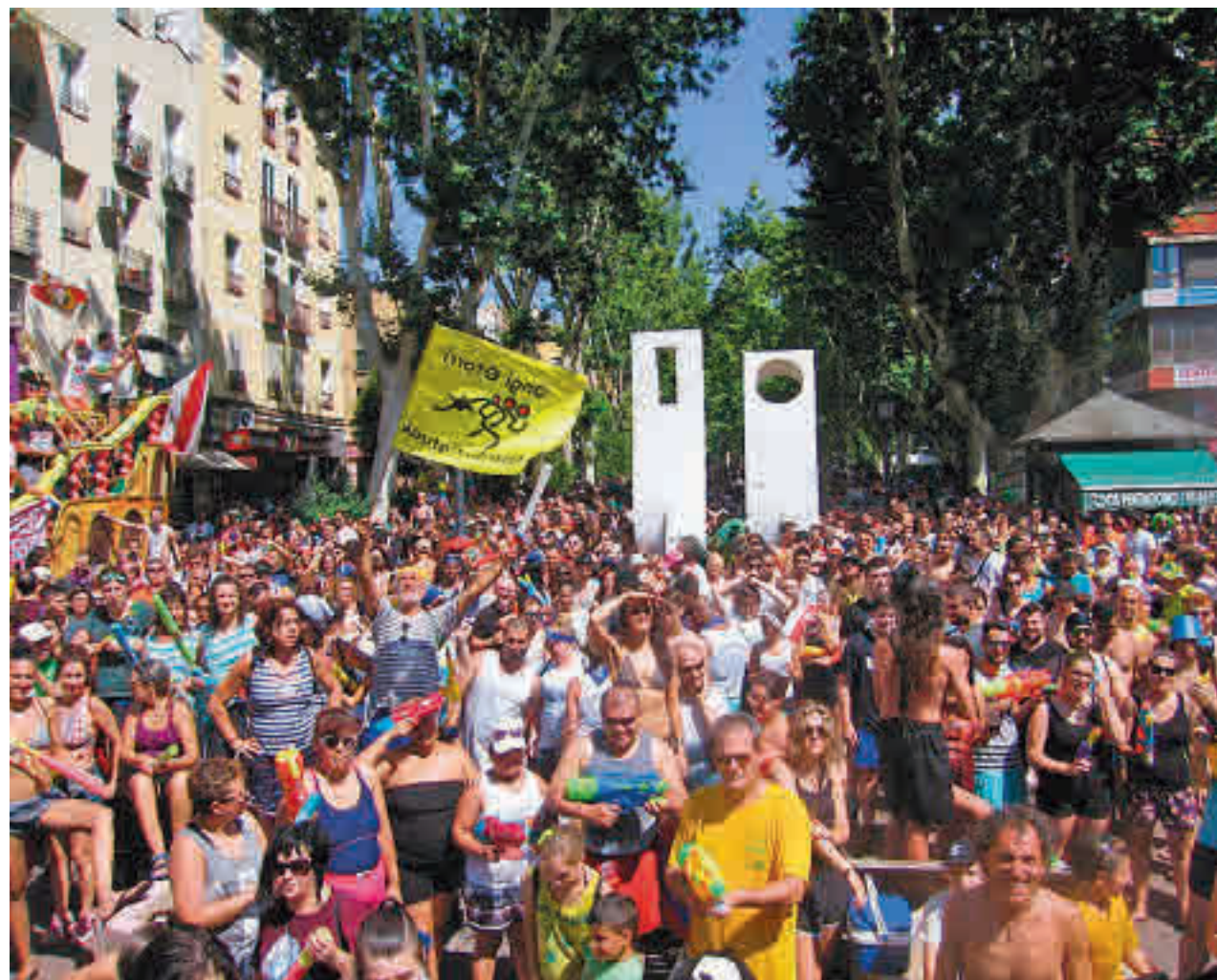
COFRADÍA MARINERA VALLECAS