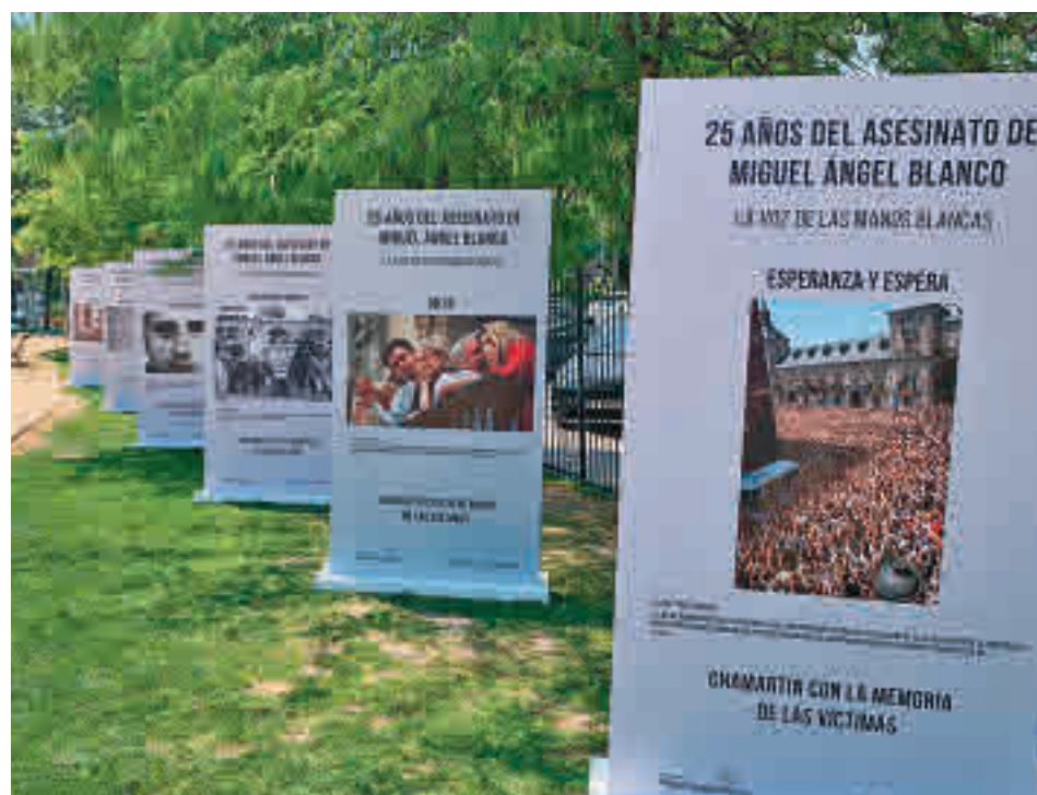
La cartelería instalada en el parque de Miguel Ángel Blanco, de Chamartín