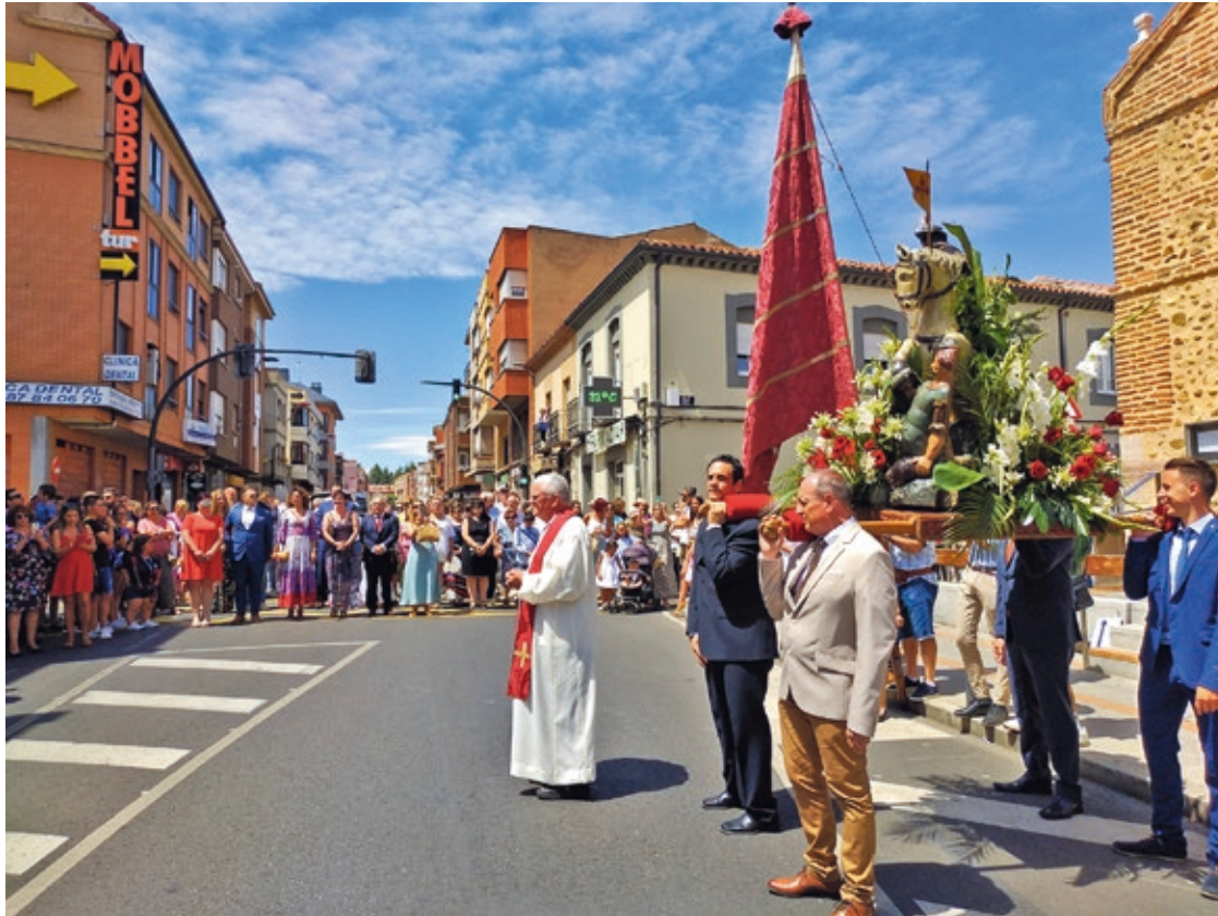
Tradicional procesión con la imagen de Santiago Apóstol frente a la Ermita del santo patrón de Trobajo del Camino.