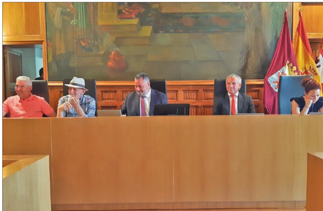
Todas las decisiones del Pleno extraordinario de la Diputación fueron adoptadas por unanimidad de los grupos políticos.

verde a una nueva edición del plan de modernización y mejora de polígonos industriales que cuenta con un presupuesto de 3 millones ampliable en otro millón más. Esta línea de ayudas se ponía en marcha el pasado ejercicio con un presupuesto de 2 millones y alcanzó a 24 municipios.