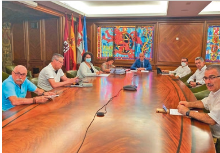
Junta de Gobierno Local del Ayuntamiento de León celebrada el viernes 15 de julio.

La Junta de Gobierno Local del Ayuntamiento de León adjudicó el 15 de julio el contrato de obras de una estación de riego y el cierre perimetral del nuevo espacio verde ubicado en la calle Rañadoiro, una intervención que se incluye en el Plan EDUSI León Norte. Esta actuación se ha adjudicado por un importe de 42.229,98 euros (IVA incluido) y con su ejecución se dará por finalizada la creación de esta nueva área. En esta nueva zona se han invertido, además, otros 100.000 euros para su creación, lo que supondrá un 'puente' entre los barrios de Cantamilan y La Inmaculada así como un nuevo atractivo para la zona. El plazo de ejecución de estas últimas obras será de un mes contando a partir de la firma del acta de inicio de los trabajos. También dentro del Plan EDUSI León norte están las obras que se llevarán a cabo en el corredor verde urbano Nocado-Jovellanos y el jardín Ángel Barja - plaza de Balanzátegui, dos actua-