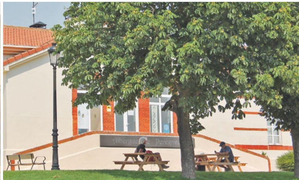
A la izquierda, Ayuntamiento de Villadangos del Páramo. A la derecha, el albergue de peregrinos, cuya remodelación será inaugurada el 22 de julio, acto incluido en las fiestas de Santiago.