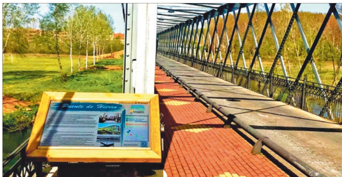
El valor arquitectónico del Puente de Hierro que une Carrizo y Villanueva saldrá a relucir en las conferencias programadas estos días.

Dentro de la intensa programación veraniega que tiene diseñada el Ayuntamiento de Carrizo de la Ribera, como la tan esperada Feria de la Cerveza, esta celebración de la efemérides del Puente de Hierro tiene una especial relevancia, al tiempo que tiene como objetivo el de resaltar el valor popular y sobre todo el arquitectónico.