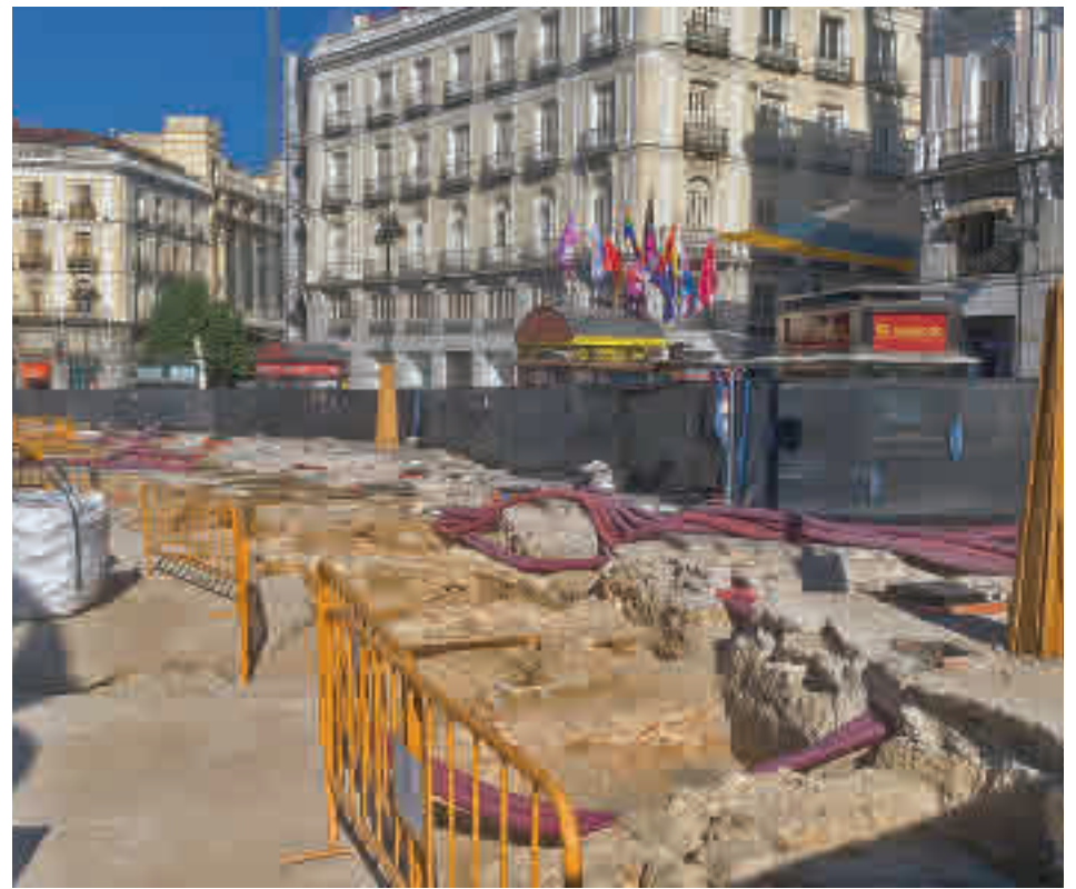
Los trabajos de remodelación de la Puerta del Sol @MADRID_SECRETO

Por otro lado, está muy avanzado el adoquinado en la calle del Carmen en su intersección con Tetuán y tam-