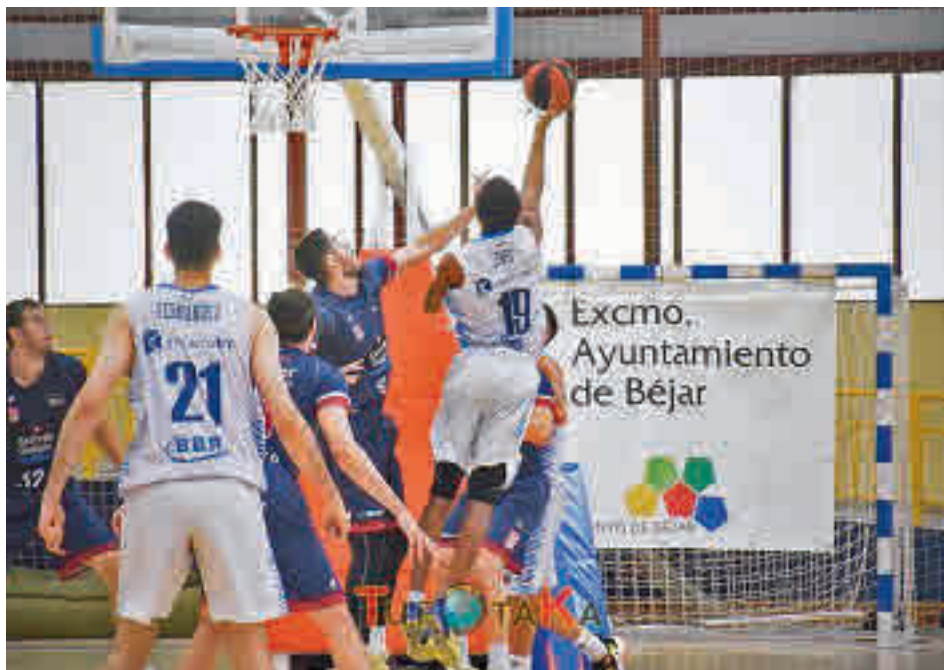
El Carplus Fuenlabrada derrotó al Monbus Obradoiro el pasado fin de semana