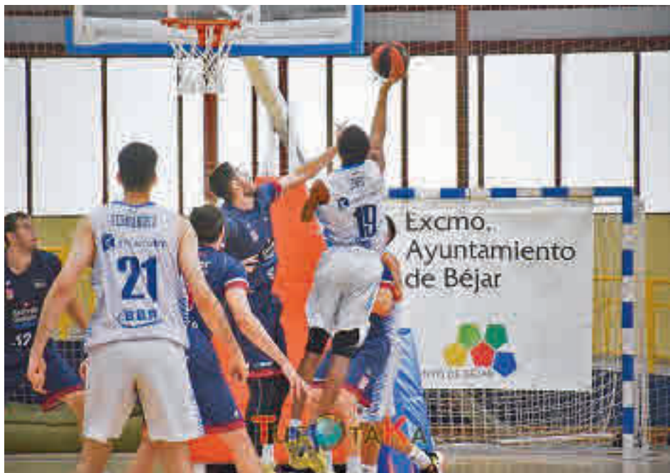
El Carplus Fuenlabrada derrotó al Monbus Obradoiro el pasado fin de semana