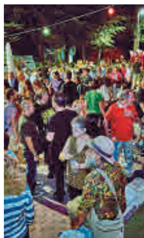
Fiestas ‘La Pablo’ AYTO. RIVAS

La celebración continuará el sábado con una comida popular desde las 14 horas. Los niños podrán disfrutar con los juegos del agua (17 horas) y con juegos infantiles (20 horas). Por la noche actuarán Hijas del Mezcal desde las 21 horas. Jazz Lemon tocará a las 22 horas y Molin Out una hora después. A media noche se lanzarán los tradicionales fuegos artificiales.