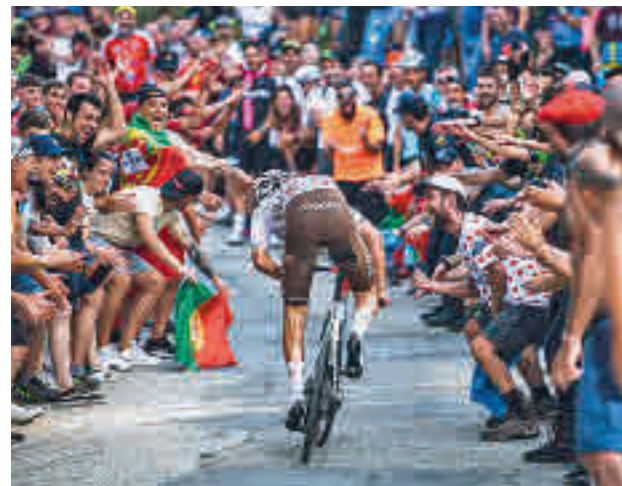
La Vuelta está teniendo una gran afluencia de público

Sin embargo, esta no será la única etapa de la que podrá disfrutar el público madrileño. En la jornada anterior, la del sábado 10, se vivirá una etapa de montaña que promete regalar grandes emo-