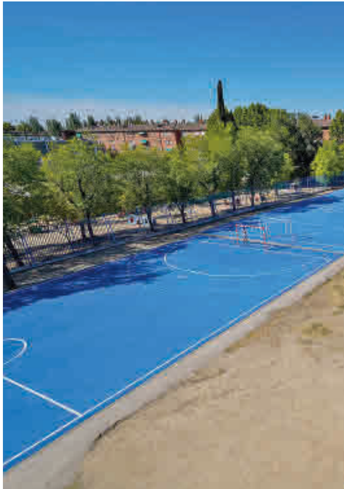
Patio remodelado del colegio Ramón y Cajal AYTO. TORREJÓN

Las ciudades del Corredor del Henares han aprovechado el parón veraniego para acometer distintas obras de mejora en los colegios públicos de las localidades. Las reformas realizadas en los centros de Torrejón de Ardoz han sido solicitadas por la dirección de sus centros educativos y, principalmente, son renovación e instalación de pistas polideportivas, pérgolas, pequeñas obras de albañilería, instalación de columpios, reparación de bajantes, reforma de baños y pintura de instalaciones diversas. Este año, la inversión total ha ascendido hasta los 750.000 euros y ha afectado a los 20 centros pú-