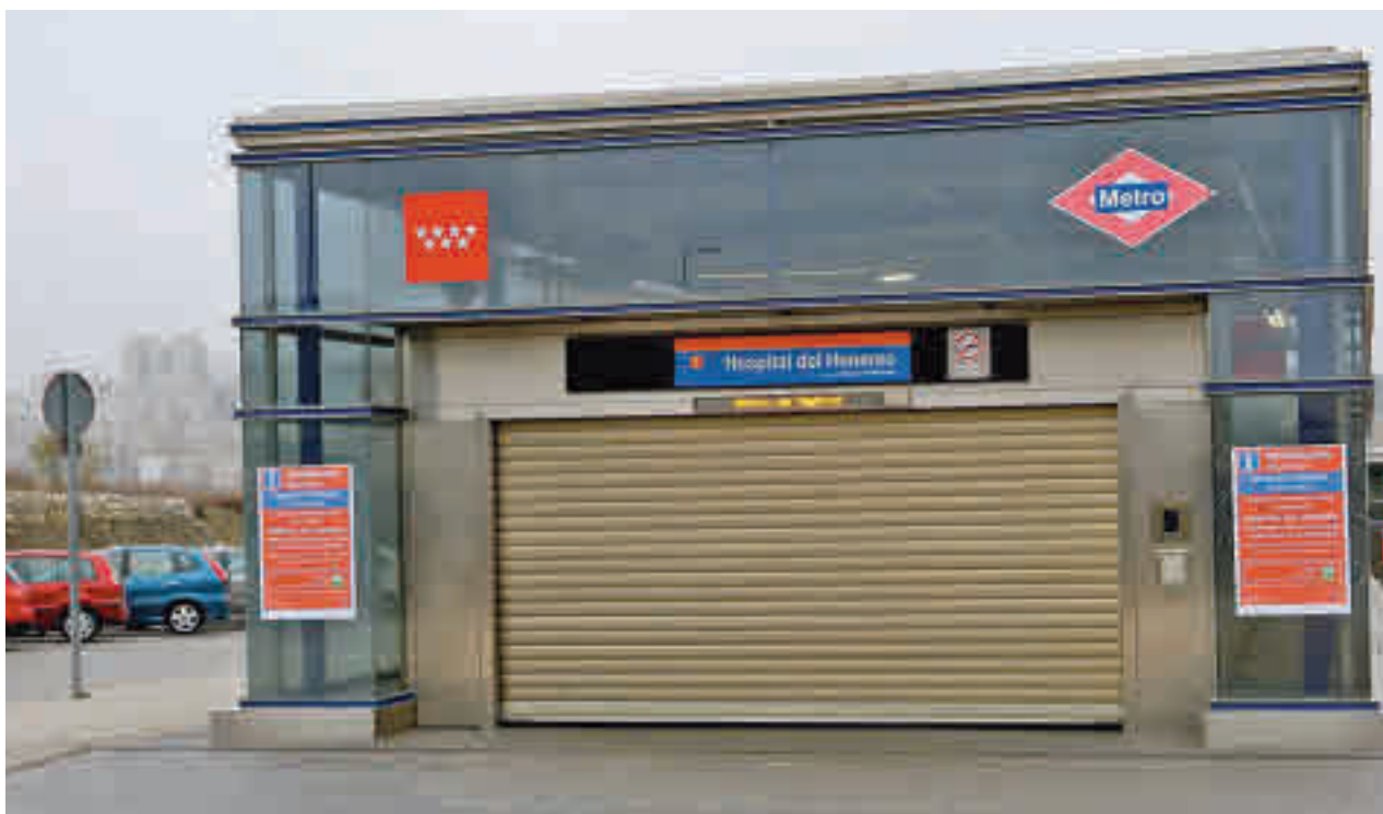
Estación de Hospital del Henares, cerrada AYTO. COSLADA