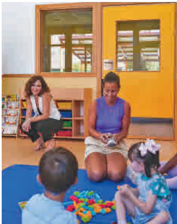
Apertura del curso escolar en la Comunidad de Madrid

"Este es, además, el curso del esfuerzo y del mérito, principios que mi Gobierno está decidido a defender y promover. Vamos a contar con más profesores, mejor oferta educativa y con infraestructuras más modernas. Es nuestra apuesta para afrontar una situación compleja que están sufriendo miles de familias y para combatir la falta de ilusión y expectativas que sufre una parte importante de los jóvenes", señaló Díaz Ayuso, que añadió que este modelo educativo responde a