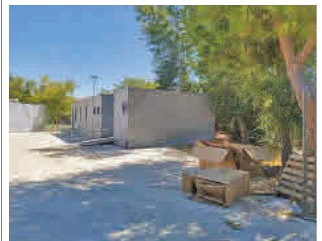
Instituto Humanejos de Parla

El Ayuntamiento de Valdemoro ya reparte la Guía de Actividades Educativas con 64 propuestas que ofrece a los centros educativos.