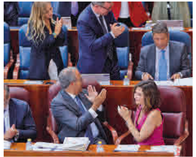
Isabel Díaz Ayuso, durante el Debate