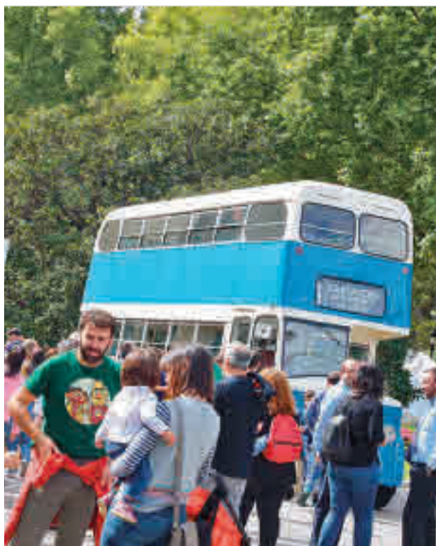
Los peatones volverán a tomar la calzada del Paseo del Prado

A lo largo de sus más de 2 kilómetros, se desarrollarán actividades para toda la familia, como yincanas, juegos, bicicletadas, exposiciones, cine de verano y otras iniciativas. Además, el asfalto del Paseo del Prado volverá un año más a transformarse en un jardín. El tramo entre las fuentes de Neptuno y Cibeles amanecerá el domingo con los 'jardines efímeros', que realizarán empresas especializadas en el diseño y mantenimiento de jardinería. De igual modo, la Policía Municipal llevará a cabo el mismo