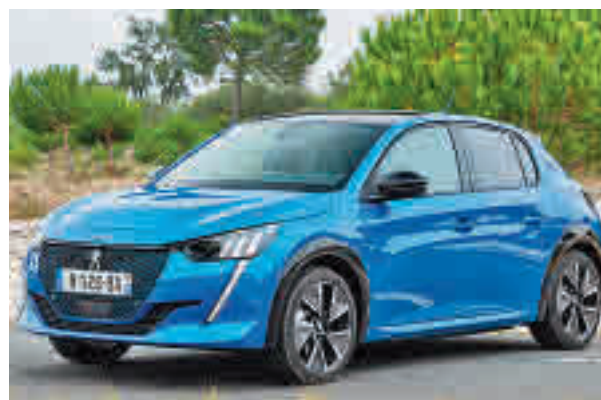
Imagen promocional del Peugeot e-208

Uno de los mayores inconvenientes es su precio, ya que la mayoría supera los 30.000 euros. Es por ello que la Organización de Consumidores y