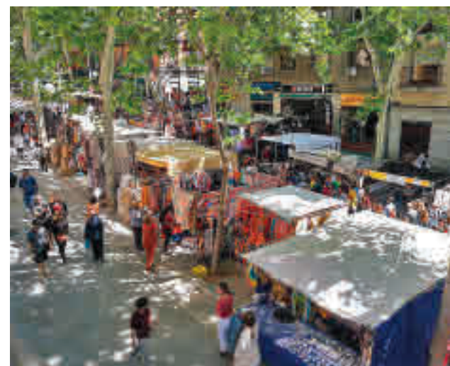
El tradicional mercadillo madrileño

Además, el Consistorio rehará todo el sistema hidráulico, ya que el lugar contaba con tres cascadas que se van a restaurar. "Por debajo va a haber aire acondicionado, electricidad y fibra óptica para que sea utilizable", concluyó Soria.