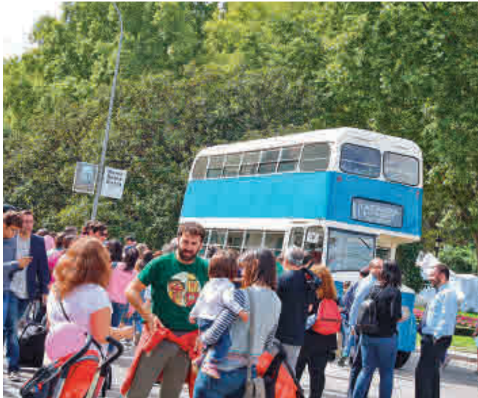
Los peatones volverán a tomar la calzada del Paseo del Prado

De igual modo, la Policía Municipal llevará a cabo el mismo día una exhibición