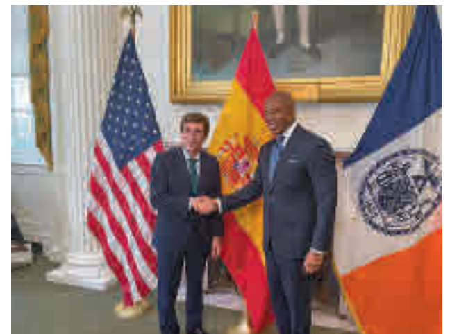
El alcalde de Madrid, junto al de Nueva York, Eric Adams

En materia de seguridad, y con respecto a las bandas juveniles, Madrid recibió el consejo de apostar por las labores de prevención a través de la labor de los agentes tutores.