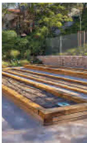
La zona del huerto urbano

un presupuesto de 500.000 euros. La parcela ocupa una superficie de 1.251 metros cuadrados entre las calles de Canet de Mar y Carril del Conde y se encontraba en mal estado. Tras las obras, han creado dos zonas estancias unidas por una rampa que recorre un talud vegetal para generar un espacio de encuentro y mejorar la conexión peatonal.