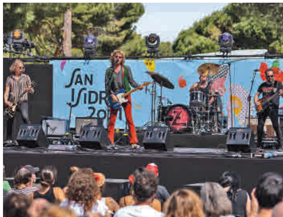
Los Zigarros tocarán en el recinto ferial el sábado 17 de septiembre

EL DEPORTE OCUPARÁ UN LUGAR DESTACADO CON VARIOS TORNEOS