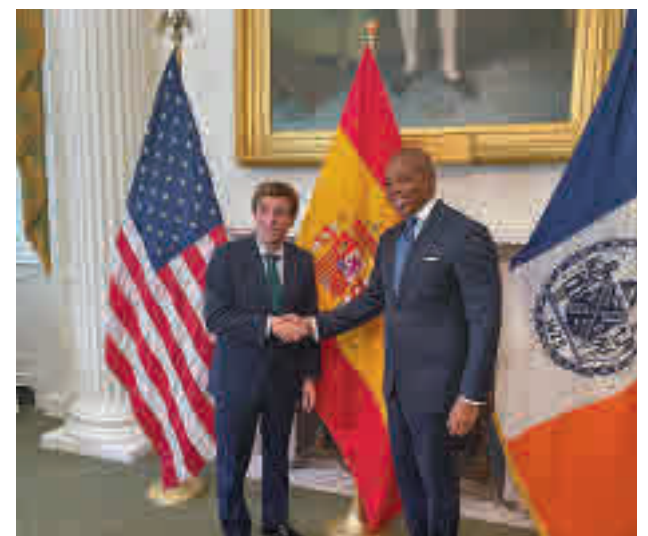
El alcalde de Madrid, junto al de Nueva York, Eric Adams

Una de las citas más destacadas de su agenda fue el encuentro que mantuvo el pasado miércoles 14 de septiembre con su homólogo neoyorquino, Eric Adams, en la City Hall de la ciudad de los rascacielos. Los dos regidores intercambiaron impresiones y actuaciones que se dan actualmente en las dos urbes y coin-