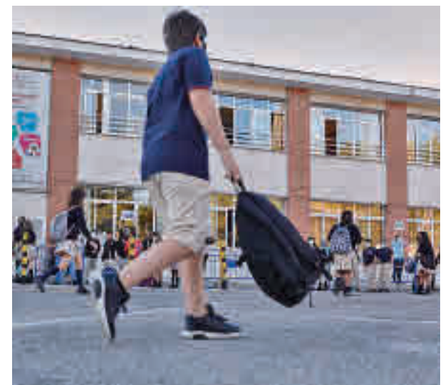
Hay que dosificar el número de extraescolares