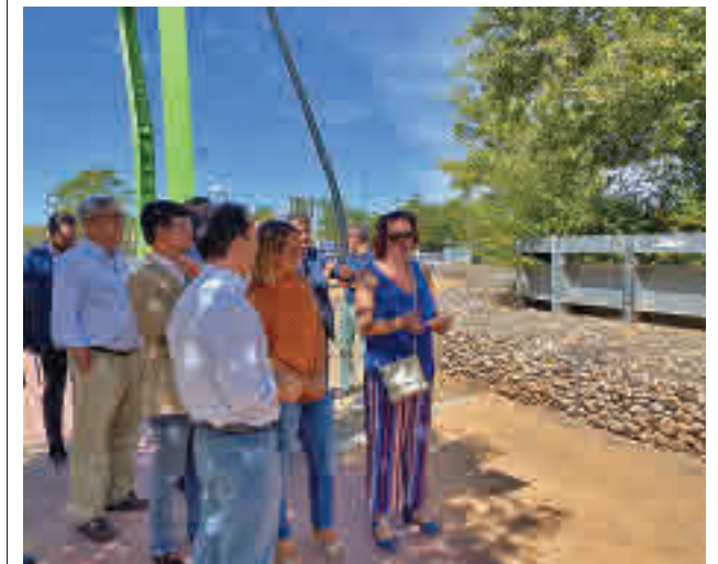
La visita de las autoridades al parque de Pradolongo

En el segundo de los casos, las actuaciones se llevarán a cabo fundamentalmente en dos áreas del parque, El Mirador de Pradolongo y Pradolongo Lago. La rehabilitación incluye, además, la adecuación del sistema de alumbrado de este pulmón del distrito de Usera y la pavimentación y mejora de sus caminos.