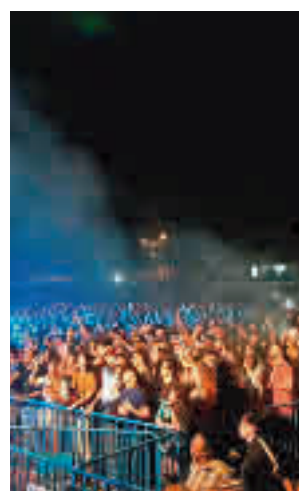
Asistentes al festival en 2019

La programación, organizada por la Junta de distrito,