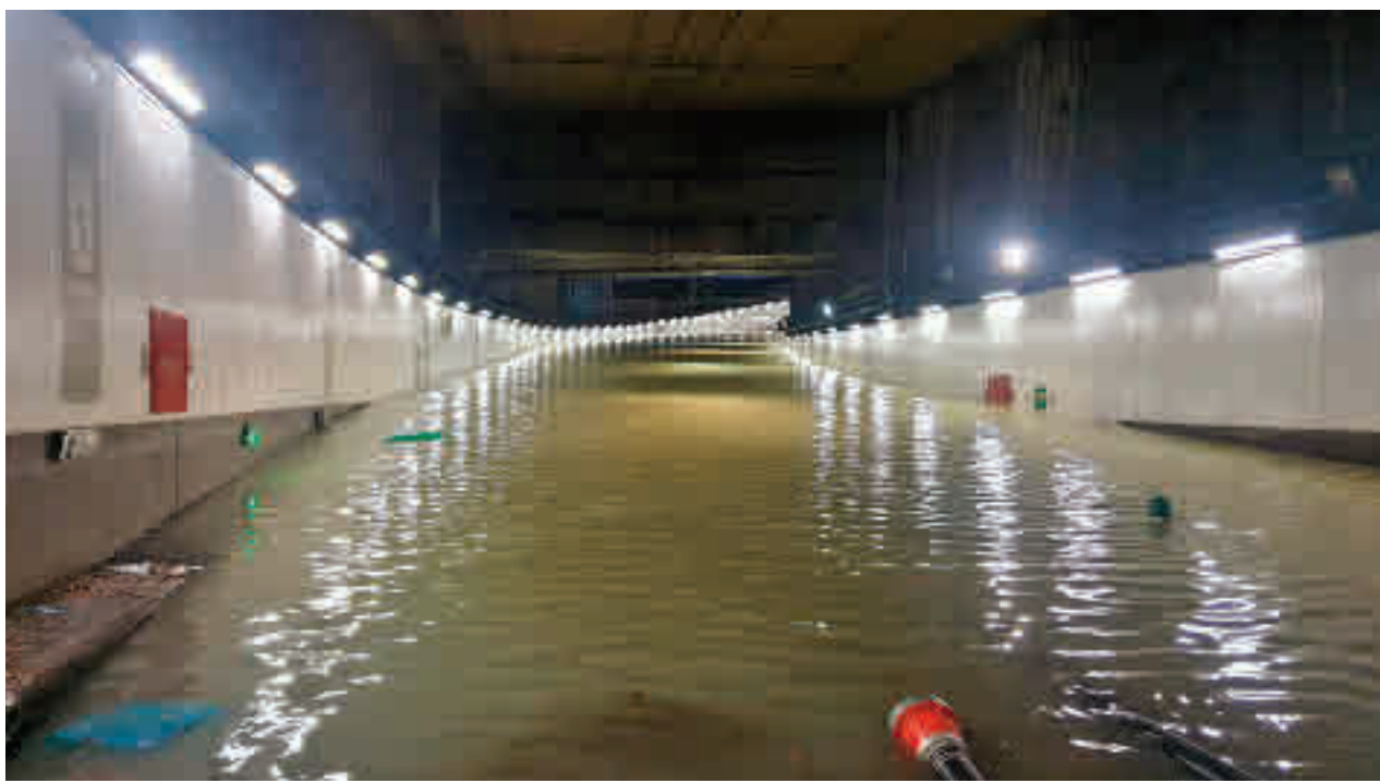
El túnel de la M-30, anegado por el gran torrente de agua procedente de la superficie