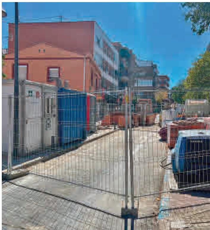
La circulación ha sido cortada en la zona

Los operarios trabajan "en mina", a seis metros de profundidad desde la segunda quincena del mes de agosto y los trabajos son "lentos" dado que se está actuando en el subsuelo. Ahora mismo ya se ha avanzado en una gran par-