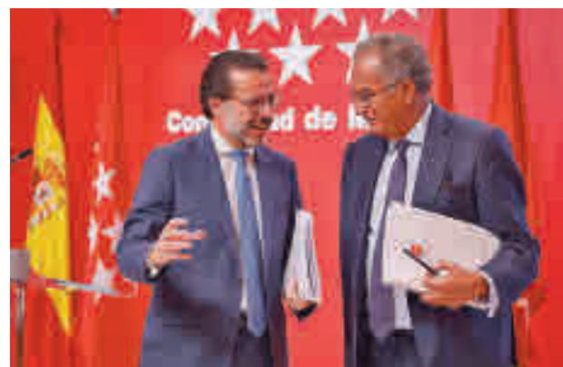
Consejo de Gobierno

AGENCIAS La Comunidad ha dado luz verde a la convocatoria de las ayudas del bono del alquiler joven con 250 euros mensuales del Gobierno central dirigidas a menores de 35 años que arrienden un inmueble o una habitación en la región.