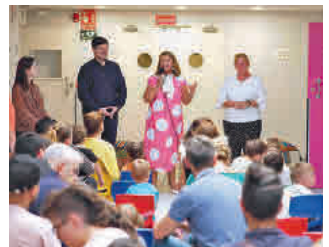
Acto oficial de apertura del curso

El inicio de la campaña es este viernes 16 de septiembre y servirá para poner en circulación 3.000 bonos de 5 euros que podrán gastarse hasta el 15 de noviembre. Los consumidores, mayores de 18 años, podrán descargar estos bonos y canjearlos en compras o consumiciones realizadas en los establecimientos que se han adherido a esta campaña, que se pueden conocer en la página web Bonosdescuentoalcobendas.org . Cada persona podrá descargar y hacer uso de un máximo de 15 bonos.