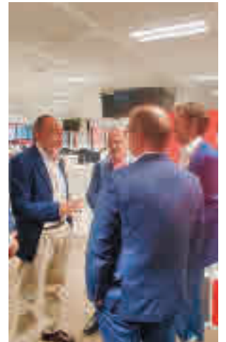
Presentación del torneo

El torneo se juega en los campos de fútbol de los polideportivos municipales José Caballero, Navarra y Valde las fuentes. El viernes 16 y el sábado 17 se disputan los partidos de grupos y el domingo, los que establecen la clasifica-