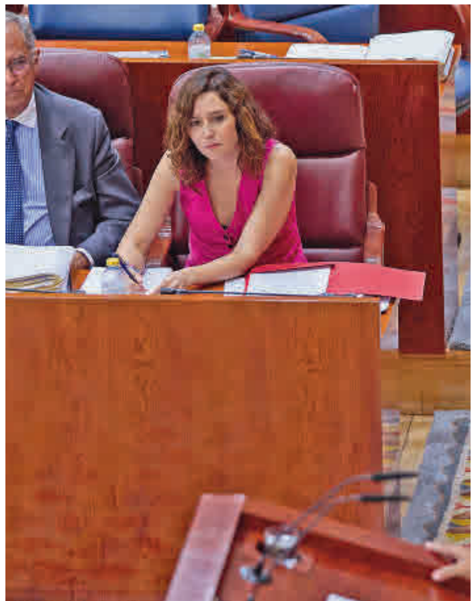
Isabel Díaz Ayuso, durante el Debate sobre el Estado de la Región

Ayuso mostró su preocupación por las adicciones de los más jóvenes y el aumento de delitos entre ellos y se comprometió a actuar es ese sen-