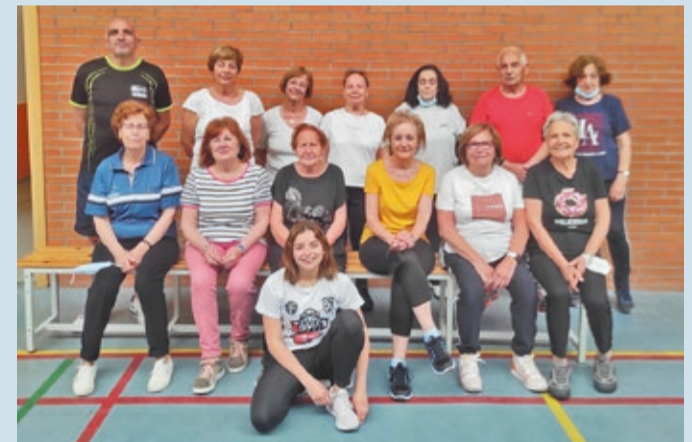
Participantes de uno de los grupos de gimnasia de mantenimiento el último curso.