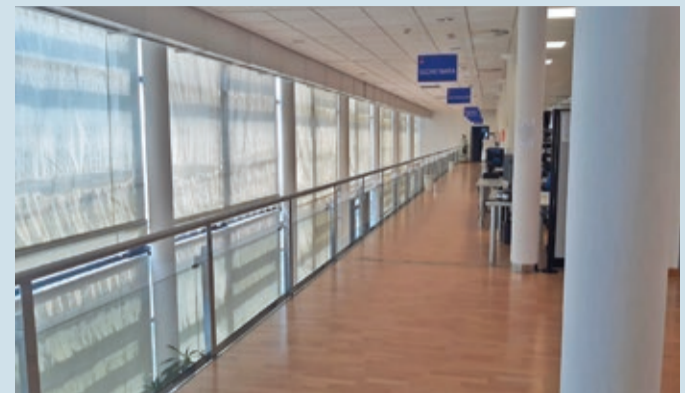
La plantilla del personal de limpieza se ha visto mermada por bajas laborales.

LIMPIEZA | REFUERZO POR HORAS, PARA LAS DEPENDENCIAS MUNICIPALES