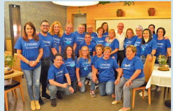
Pacientes de Valle Folgueral llegados de distintos puntos con el especialista leonés.