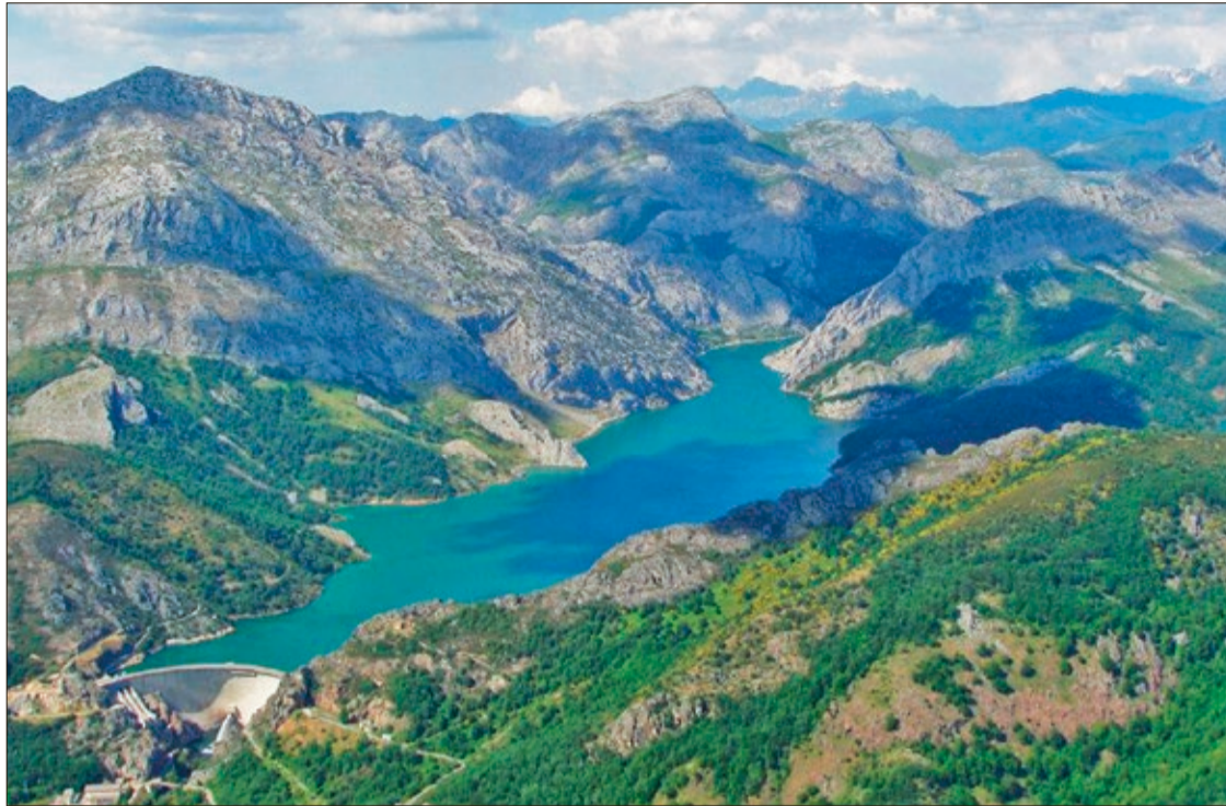
El de Riaño es uno de los dos embalses leoneses, junto con el del Porma, que tendrán que 'regalar' parte de sus reservas a Portugal.