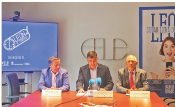
Presentación de la nueva campaña de promoción del comercio local en la Fele.

'León, una ciudad llena de secretos' se centra en dar visibilidad a los comercios, así como en generar cambios en los hábitos de consumo bajo el factor de que los comercios