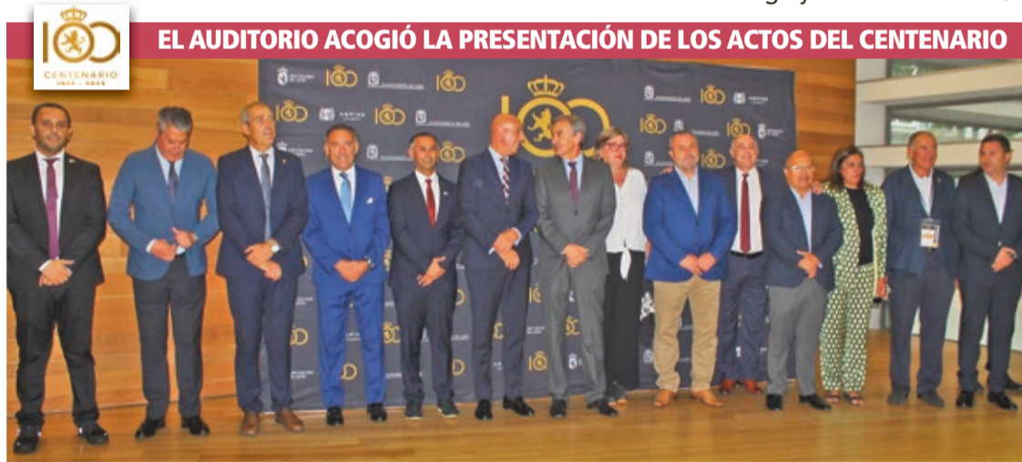
EL AUDITORIO ACOGIÓ LA PRESENTACIÓN DE LOS ACTOS DEL CENTENARIO

● Diez: "La celebración de estas jornadas busca poner en valor la política realizada para hacer una ciudad para los peatones" ● Este viernes, 16 de septiembre, será gratuito el autobús en la línea 4 y el 22 en todas las líneas ● El domingo 18 se celebra el Día de la Bici y el jueves 22 se cortará de 9 a 21 h. la Gran Vía de San Marcos entre Santo Domingo y La Inmaculada Pág. 6