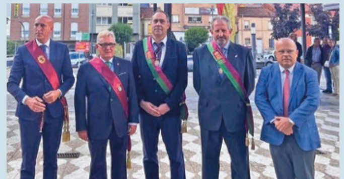
Los alcaldes de León, Valverde, Valdefresno y Villaturiel.