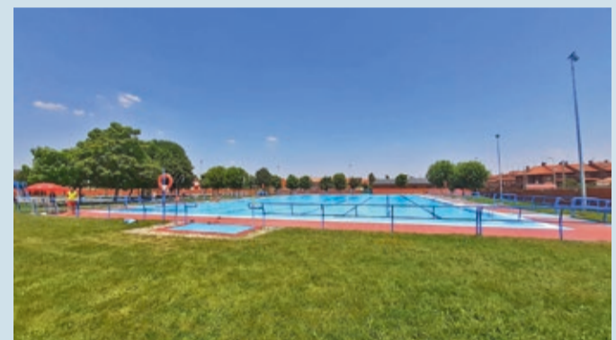
Las piscinas de San Andrés han recibido este verano 17.700 usuarios.

VERANO | EL CENTRO DE OCIO DE TROBAJO OFRECE NUEVOS CURSOS DE NATACIÓN