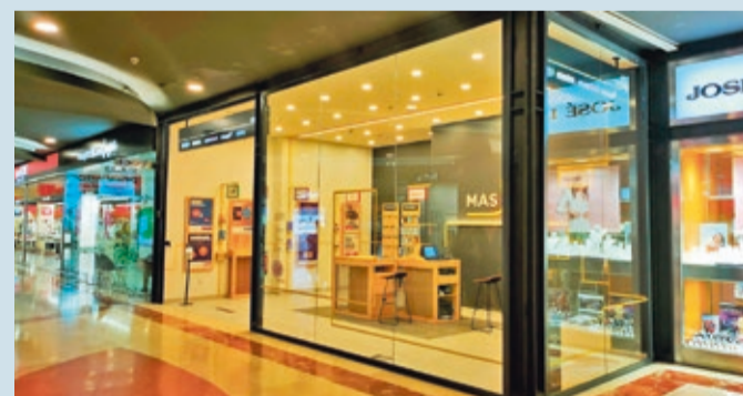
La tienda MASlife se localiza en la planta baja de Espacio León.

EMPRESAS | ASESORAMIENTO DESDE EL GRUPO MÁSMÓVIL