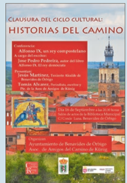
Cartel de la conferencia del viernes 16-S.