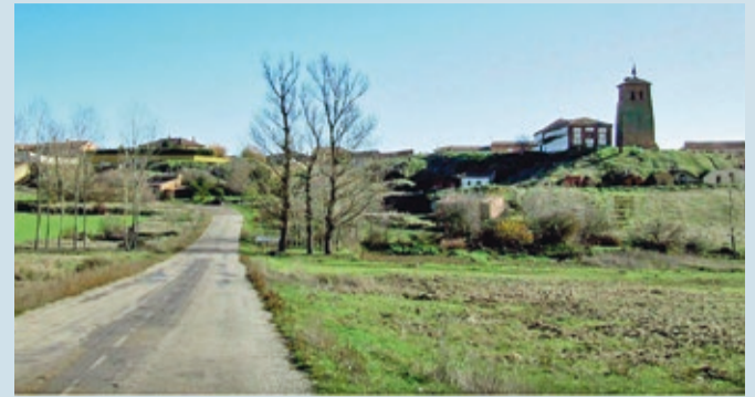
El plazo de admisión de propuestas para gestionar el bar finaliza el 26 de septiembre.