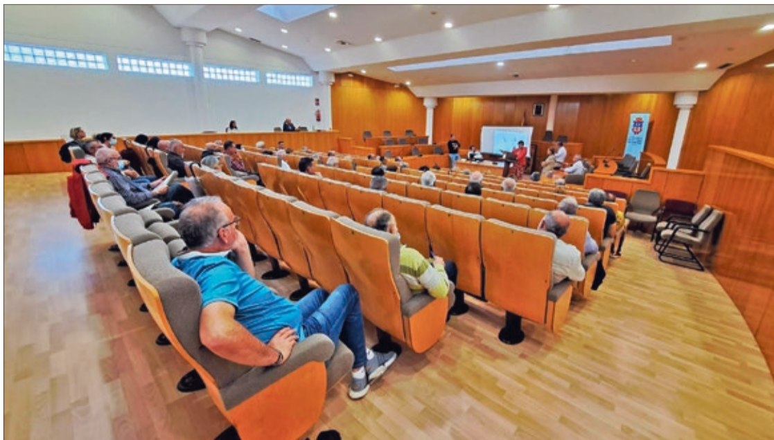
El equipo de gobierno convocó a los vecinos en el salón de plenos para explicar las novedades del proyecto de integración ferroviaria.