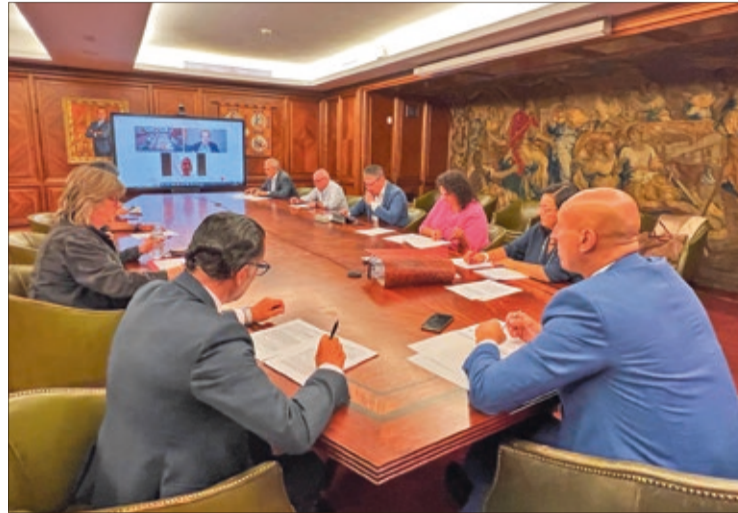
Junta de Gobierno Local del Ayuntamiento de León celebrada el viernes 9 de septiembre.

Las obras consistirán en mantener los inmuebles municipales en perfectas condiciones de uso, seguridad y salubridad así como el adecuado funcionamiento de sus instalaciones. El objeto del contrato se realizará en las dependencias municipales existentes en la actualidad y en los nuevos edificios que entren en