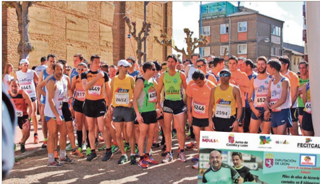
La Carrera 'Sahagún Mudéjar' saldrá este año del Auditorio/Albergue municipal.

Las principales novedades de este año son su trazado y su longitud, pues desde el Ayuntamiento facundino se pretende animar a quienes se estén iniciando en el 'running' para que la prueba no sea excesivamente dura. Si en los últimos años 'la mudéjar' discurría por diez kilómetros de calles y caminos, la edición 2022 reduce el circuito a 7,6 kms y lo acerca al pueblo vertebrando todos sus hitos arquitectónicos, desde la iglesia de La Trinidad (Albergue de peregrinos y Auditorio Municipal) como punto de arranque a las 11,30 horas, hasta la Plaza Mayor como línea de meta, pasando por las iglesias de San Lorenzo, San Tirso, o el Arco de San Benito... Algo menos de la mitad de la carrera tendrá como marco el 'laboratorio' de los huertos del Cea. La parte de naturaleza discurrirá por caminos de tierra vegetal, con tramos de sombra, en un paisaje muy