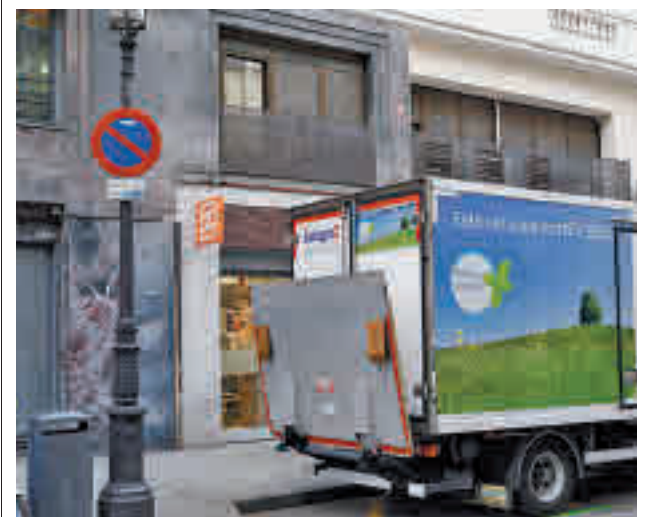
Un camión, en una zona de carga y descarga

gentedigital.es Toda la actualidad de los distritos de Madrid, en nuestra web