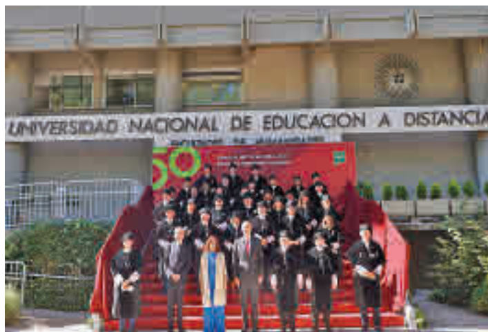
La Universidad con más alumnos: El Ministerio de Universidades eligió para inaugurar el curso 2022-2023 la UNED, el centro con más estudiantes de toda España, gracias en parte a su modelo de educación a distancia. Cuenta con más de 156.000 matriculados en sus distintos grados.

EL REY APUNTA QUE LOS CENTROS SE DEBEN TRANSFORMAR