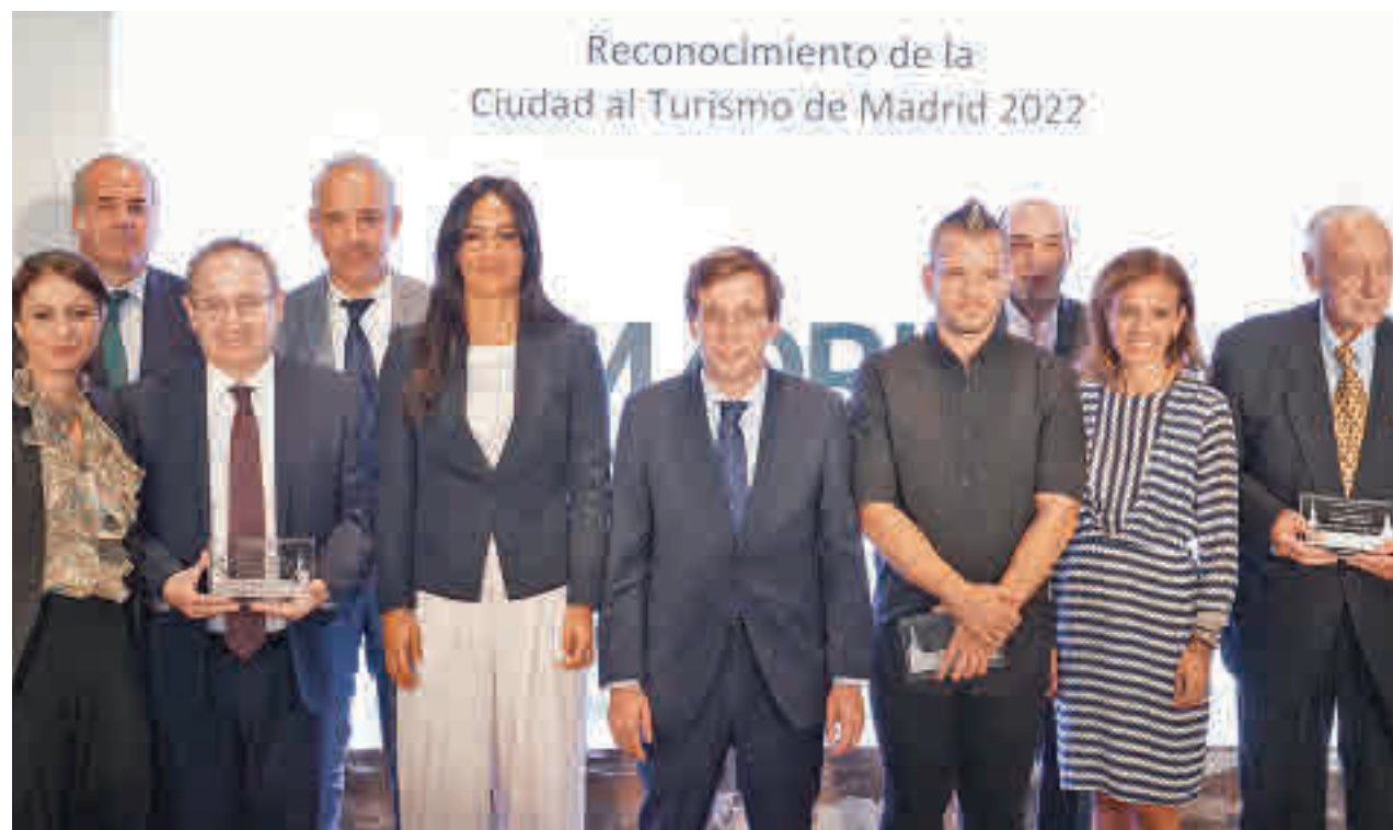
Foto de familia de las autoridades junto a los galardonados de 2022

El alcalde de Madrid, José Luis Martínez-Almeida, se comprometió a correr en la tarde del próximo 31 de diciembre la San Silvestre Vallecana, lo que le convertiría en el primer regidor en hacerlo. El primer edil destacó el "homenaje, reconocimiento y admiración" que ha querido trasladar el Ayuntamiento con esta distinción a la "carrera popular más querida de la capital".