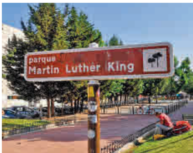
El parque Martin Luther King

Ya el domingo 2 de octubre se exhibirá 'Maitxabel', de Icíar Bollaín. Las sesiones serán gratuitas y comenzarán a las 21 horas.