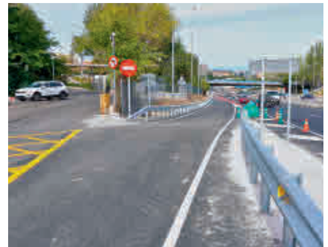
El nuevo ramal de conexión