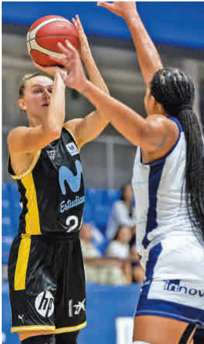
El Leganés se llevó el triunfo de Magariños