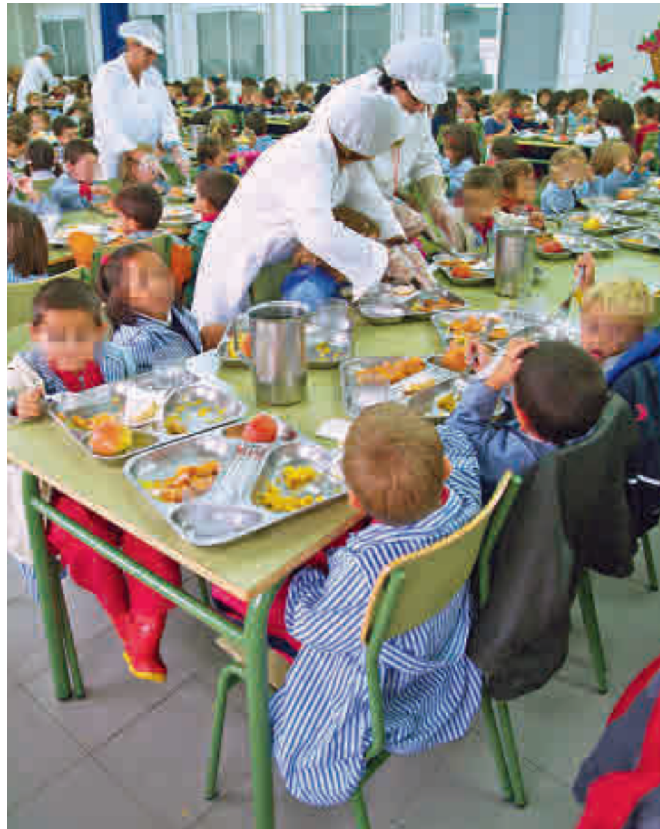
Comedor escolar en la Comunidad de Madrid

"Es necesario un incremento presupuestario suficiente y la