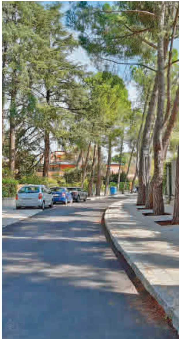
La calle de Vascongadas, tras la actuación

En la primera de las zonas residenciales, los trabajos han afectado a la calle de Gobelas y a las avenidas de Vascongadas, donde se han incorporado bandas de aparcamiento en línea en ambas aceras, y de Nuestra Señora de Begoña. Como resultado de los trabajos de ampliación y mejora,