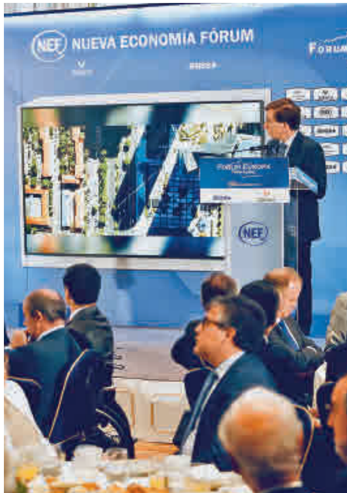
El alcalde de Madrid, en el desayuno de Nueva Economía Fórum

puesta en marcha de este novedoso medio de transporte público, cuyo proyecto se encuentra en fase de redacción. La previsión es las obras