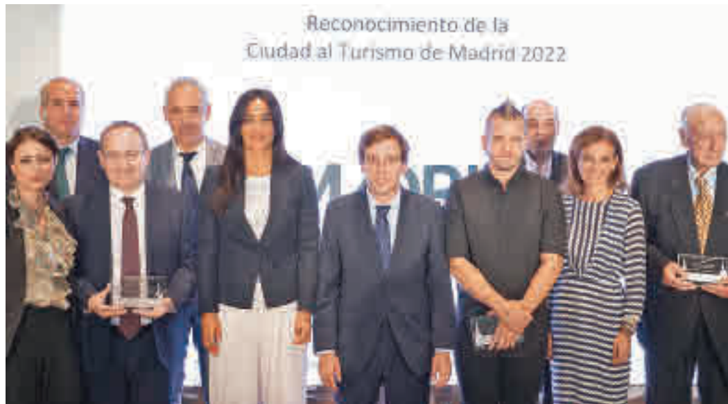
Foto de familia de las autoridades junto a los galardonados de 2022

El Ayuntamiento de Madrid entregó el miércoles 28 de septiembre en los Jardines de Cecilio Rodríguez los Reconocimientos de la Ciudad al Turismo de Madrid, que en este año 2022 llegan a su tercera edición. Estos galardones anuales se conceden con motivo de la conmemoración del Día Mundial del Turismo como muestra de apoyo y agradecimiento a la industria turística de la ciudad, explican fuentes muni-