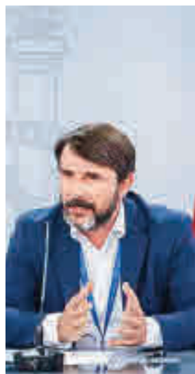
Cristóbal Belda E.P.

Belda, ha avisado durante el simposio ‘Mirando hacia el futuro del sistema sanitario’ de que la pandemia del coronavirus “no ha terminado”, se siguen registrando casos de contagios y la incidencia acumulada a 14 días “nunca ha llegado a cero”. “La amenaza es la aparición de sublinajes del virus que puedan cambiar la evolución de la pandemia”, avisó.