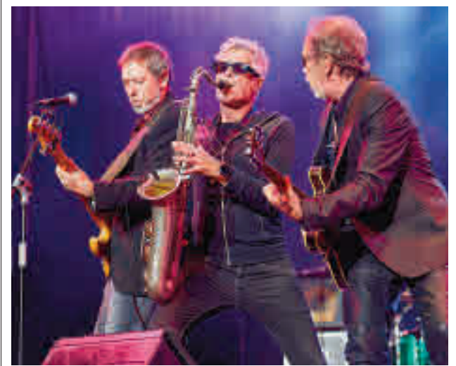
El grupo Nacha Pop, en concierto