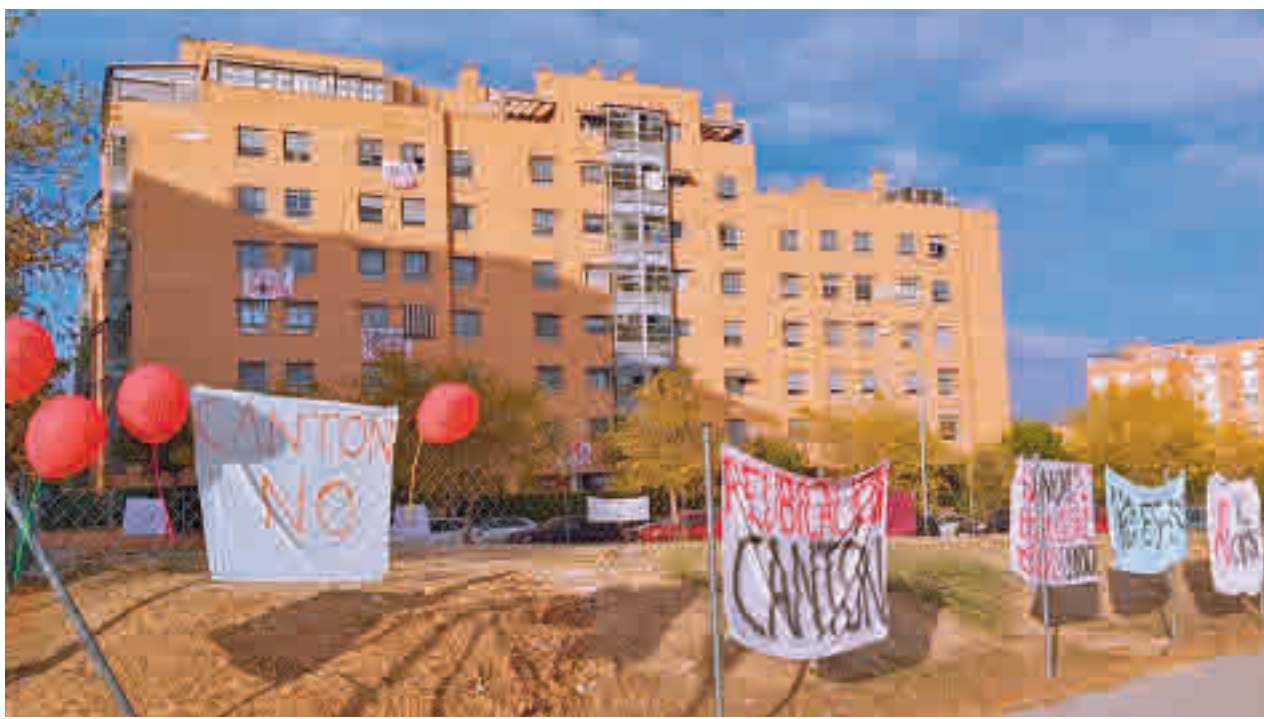
La parcela de la calle de los Morales donde el Área de Medio Ambiente planea la ubicación de las instalaciones