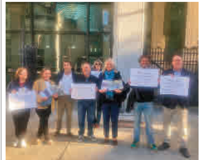
Un momento de la protesta a las puertas de Cibeles