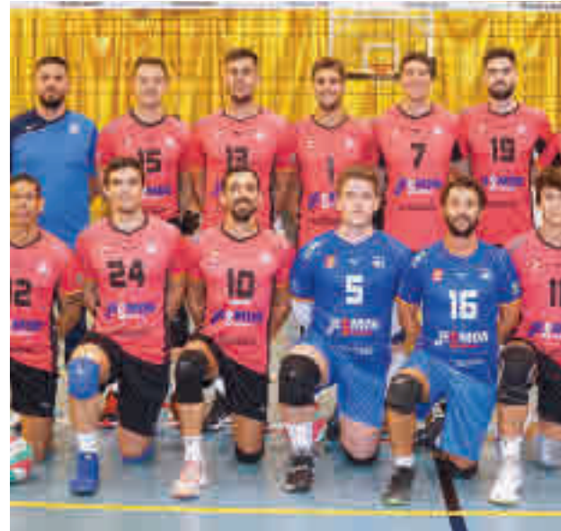
Un poco más de espera: La Superliga Masculina 2, por su parte, no arrancará hasta el sábado 8. En el Grupo A están encuadrados los equipos madrileños: Grupo Egido Pinto, VP Madrid, cvleganes.com, CUV Alcorcón y CV Collado Villalba.