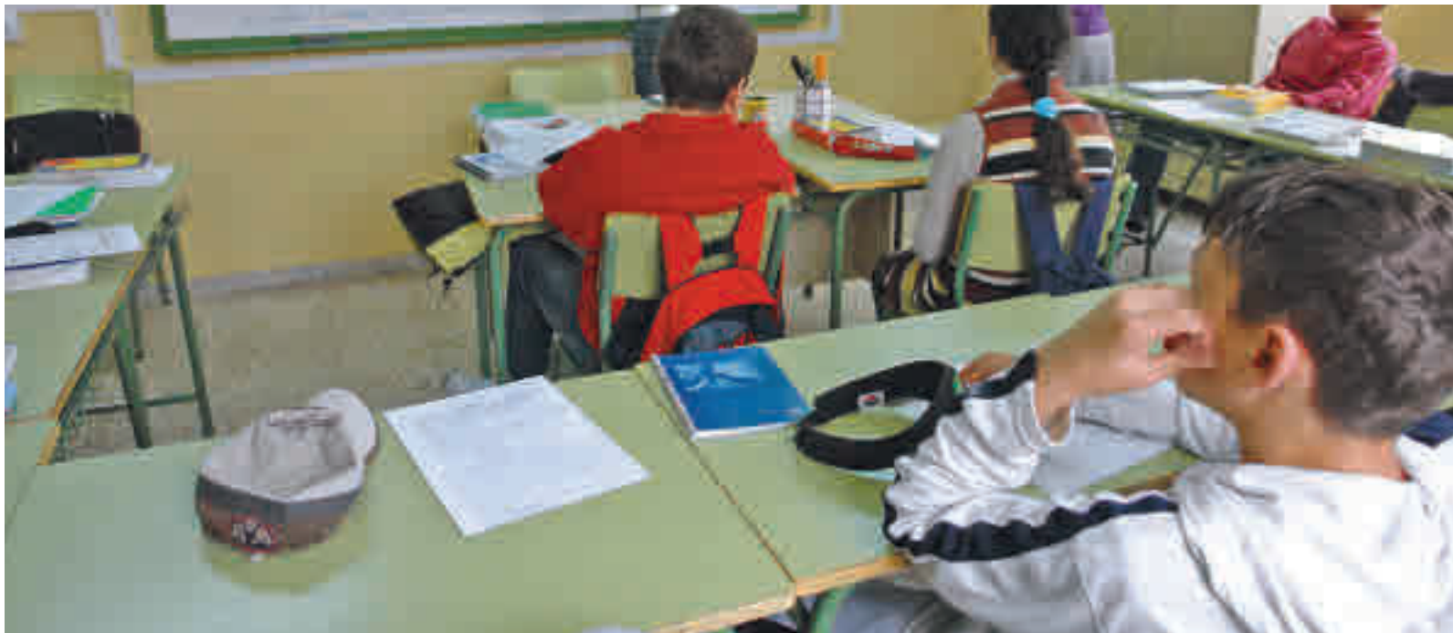
Los delitos vinculados a las bandas juveniles han crecido en los últimos meses