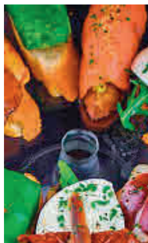
La tapa será la protagonista

Por tres euros, los asistentes podrán disfrutar de una bebida y una tapa, desde las propuestas más tradicionales de la cocina española,