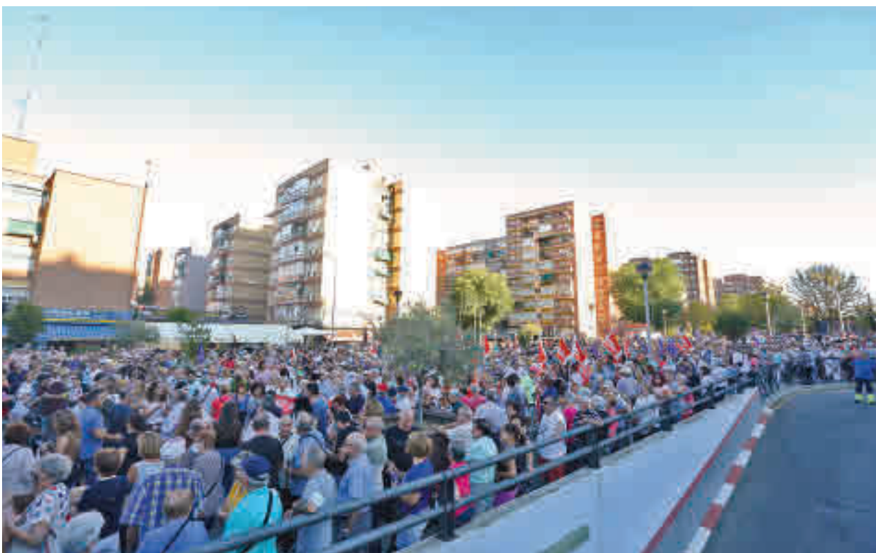
Un momento de la protesta