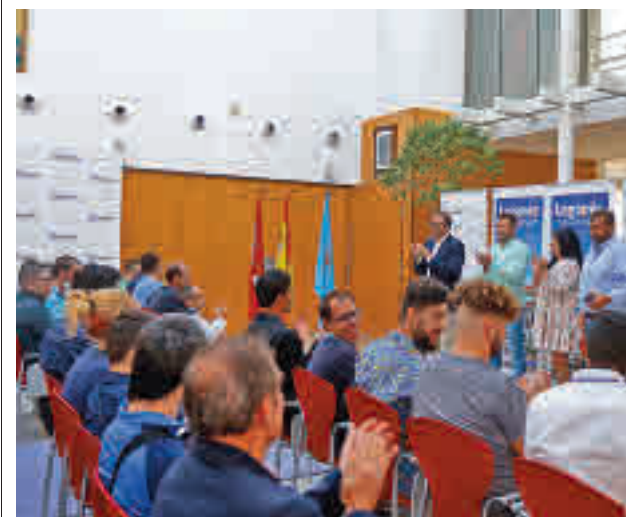
Recibimiento a los deportistas en el Ayuntamiento