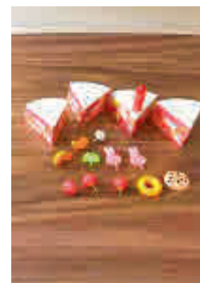
Un juego de montaje

Un equipo de investigación de la Universidad de Almería (UAL) ha desarrollado un estudio que muestra los beneficios de la realización de juegos de montaje dirigidos en la enfermedad de Alzheimer. Los expertos han confirmado