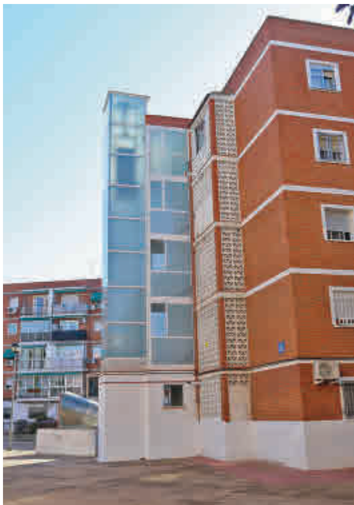
Edificios antiguos en Leganés

LA INSTALACIÓN DE ASCENSORES TAMBIÉN SE CONTEMPLA EN LAS BASES