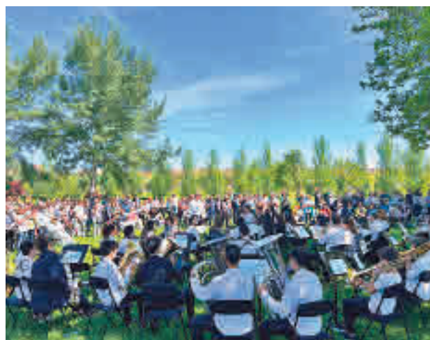
Actividades de la Escuela de Música

pantes en actividades culturales y musicales de la banda sinfónica, orquesta sinfónica, coral, en colaboraciones con otras agrupaciones instrumentales o las actuaciones o colaboraciones como solistas que se hayan realizado entre septiembre de 2021 y agosto de 2022. El plazo de presentación de solicitudes finaliza el próximo 12 de octubre.