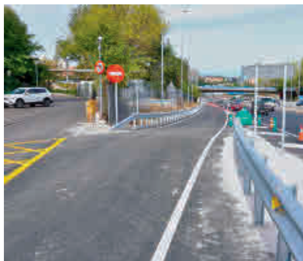
El nuevo ramal de conexión

Con un presupuesto de 186.520 euros, esta infraestructura viaria se enmarca dentro del Protocolo General de Actuación que firmaron el Ayuntamiento y el Servicio Madrileño de Salud (SERMAS) en octubre de 2021 para la mejora del entorno viario de este centro sanitario. Según fuentes municipales, más de 400.000 ciudadanos censados en Madrid que pertene-