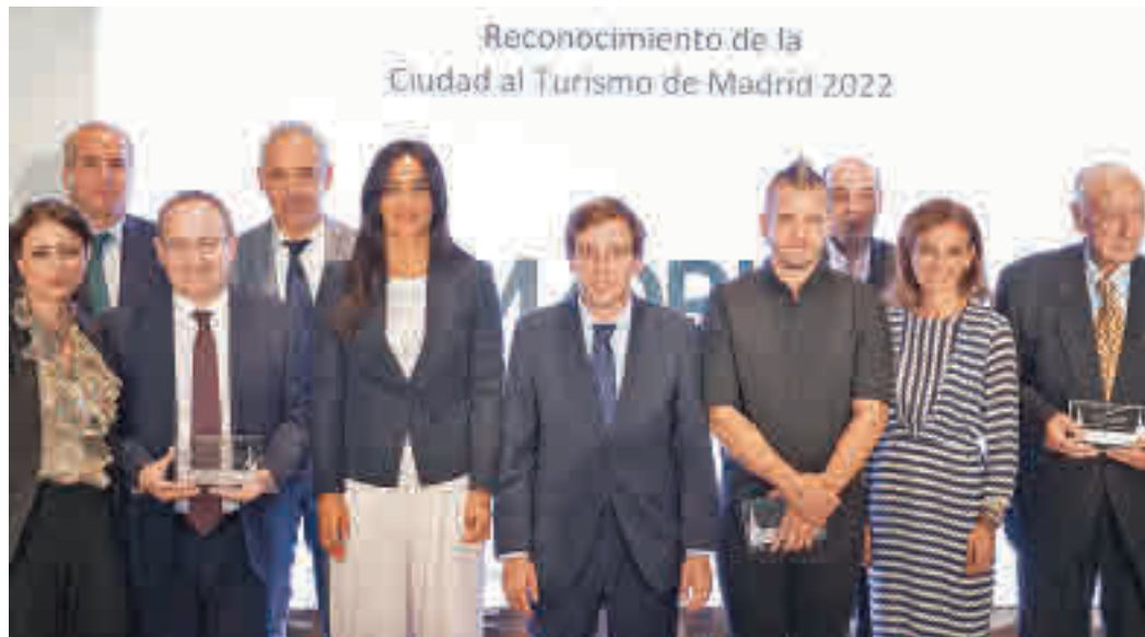
Foto de familia de las autoridades junto a los galardonados de 2022

El Ayuntamiento de Madrid entregó el miércoles 28 de septiembre en los Jardines de Cecilio Rodríguez los Reconocimientos de la Ciudad al Turismo de Madrid, que en este año 2022 llegan a su tercera edición. Estos galardones anuales se conceden con motivo de la conmemoración del Día Mundial del Turismo como muestra de apoyo y agradecimiento a la industria turística de la ciudad, explican fuentes muni-