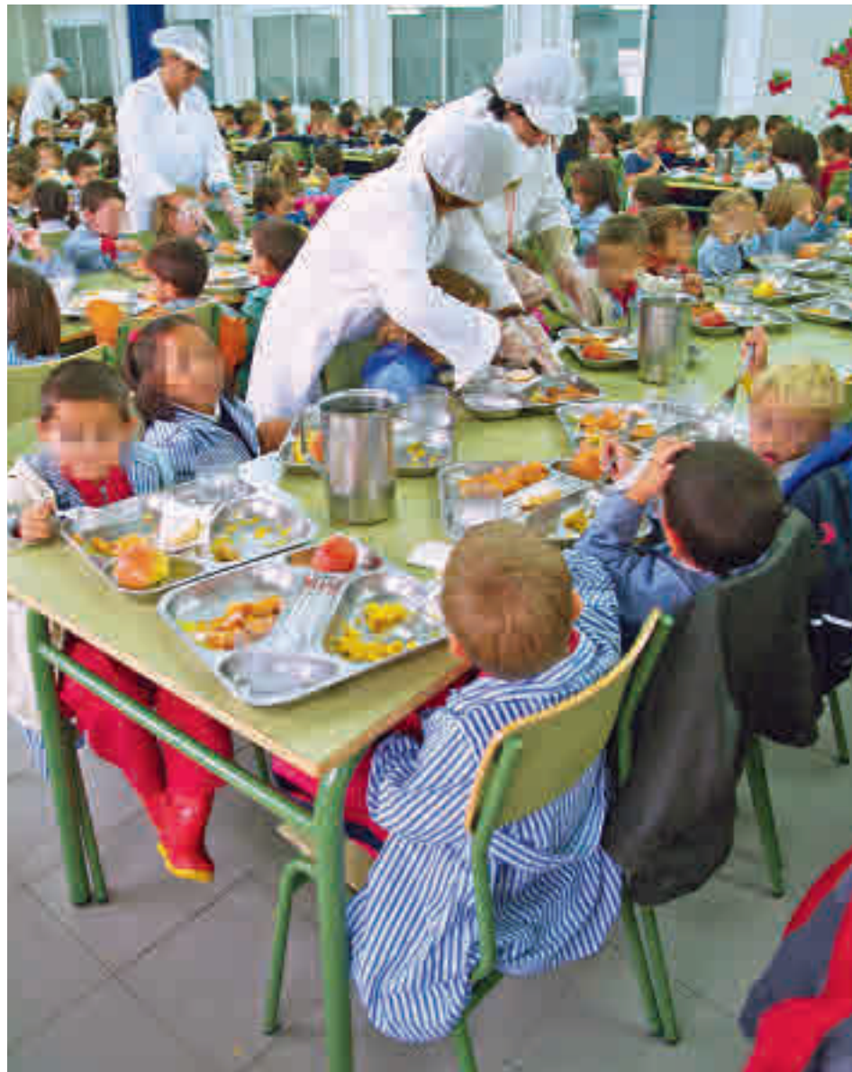
Comedor escolar en la Comunidad de Madrid

"Es necesario un incremento presupuestario suficiente y la