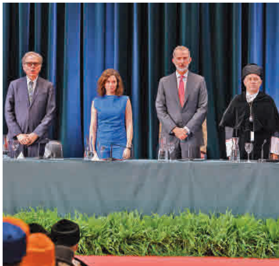
El rey, en el acto de inauguración, junto a Isabel Díaz Ayuso

Para el monarca, los retos a los que se enfrenta "no son solo de carácter normativo, sino también que requieren de