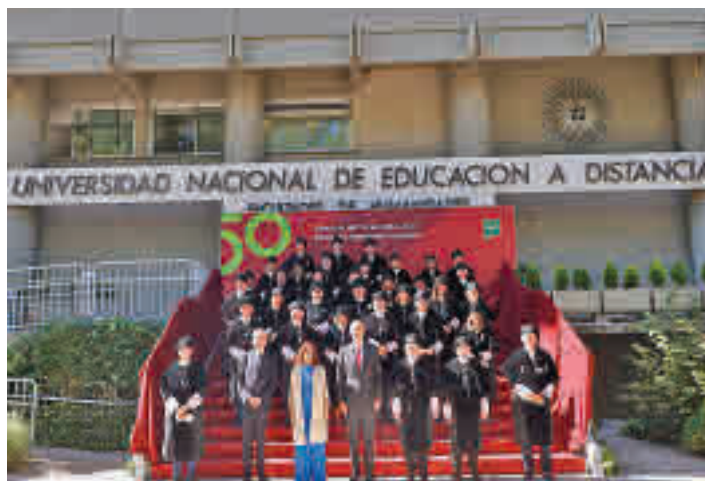
La Universidad con más alumnos: El Ministerio de Universidades eligió para inaugurar el curso 2022-2023 la UNED, el centro con más estudiantes de toda España, gracias en parte a su modelo de educación a distancia. Cuenta con más de 156.000 matriculados en sus distintos grados.

EL REY APUNTA QUE LOS CENTROS SE DEBEN TRANSFORMAR