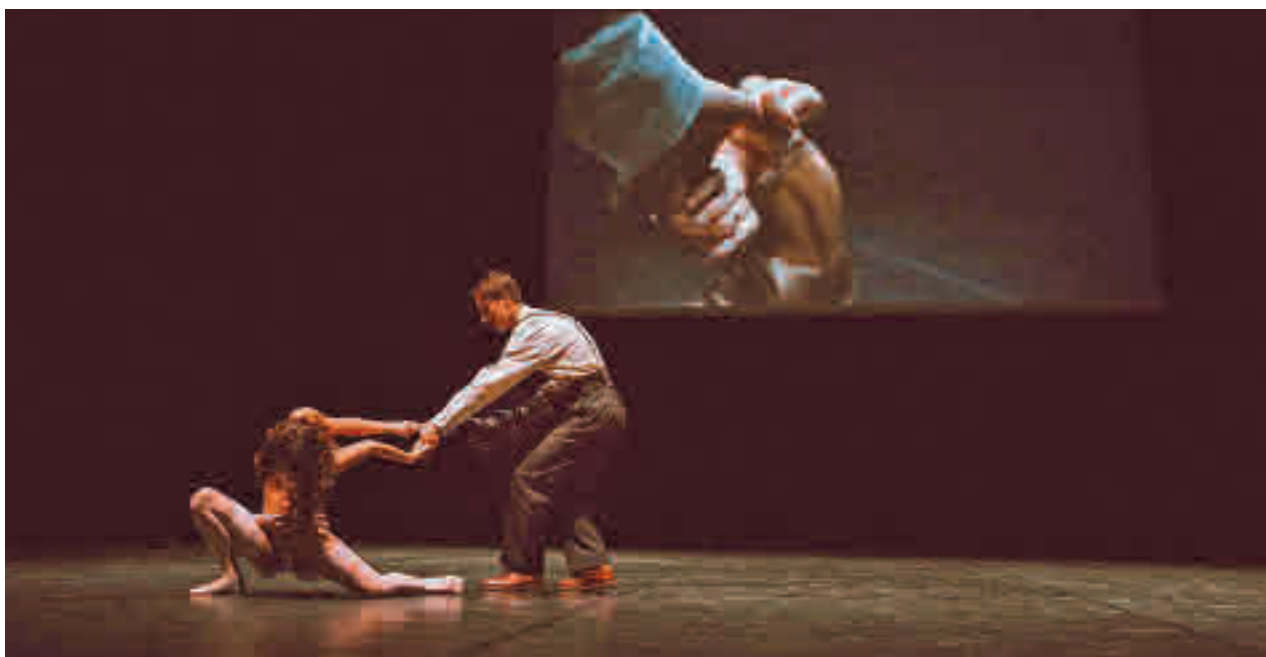
Las propuestas se desarrollarán en la Sala Verde y en la Sala de Cristal

» Teatro Adolfo Marsillach. Sábado 1, 20 horas. Precio: 18 euros.