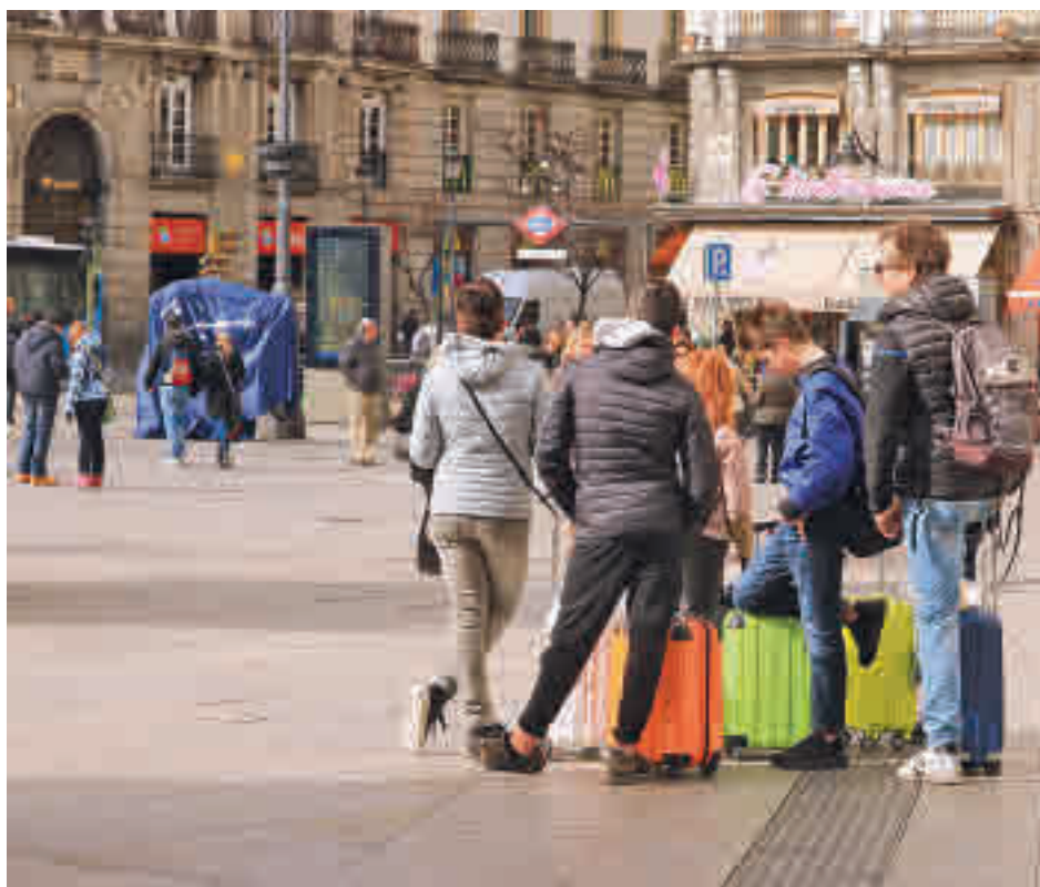
Turistas en la Comunidad de Madrid

Eliminando el efecto del tamaño de cada comunidad, los más viajeros son los residentes en Comunidad de Madrid (1.261 viajes por cada 1.000 habitantes), Aragón (1.223) y La Rioja (1.162). Por el contrario, los menos viajeros son los residentes en Canarias (585 viajes por cada 1.000 habitantes), Región de