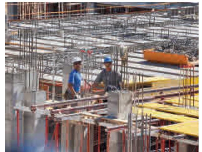
Trabajadores en la Comunidad de Madrid

Paradójicamente, la cantidad de trabajadores participantes en huelgas, que venía de crecer cuatro trimestres seguidos, en el segundo trimestre ha disminuido un 13,1% interanual.