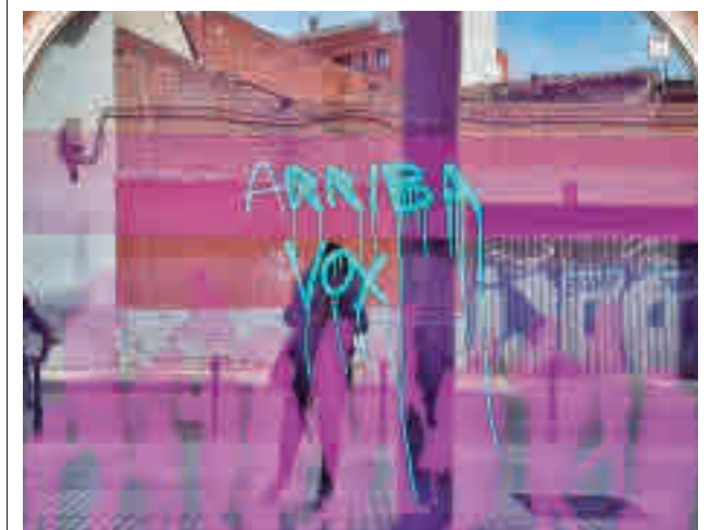
Pintadas en la sede de Podemos

La idea es que el nuevo coso albergue más festejos durante el año y acoja incluso una escuela propia. Durante la celebración de un concurso de recortes en una plaza de toros desmontable, el astado rompió uno de los burladeros de un fuerte golpe a la carrera y logró acceder al callejón, donde corneó a dos personas, una de ellas un trabajador del Patronato de Deportes, que falleció poco después a causa de las heridas.