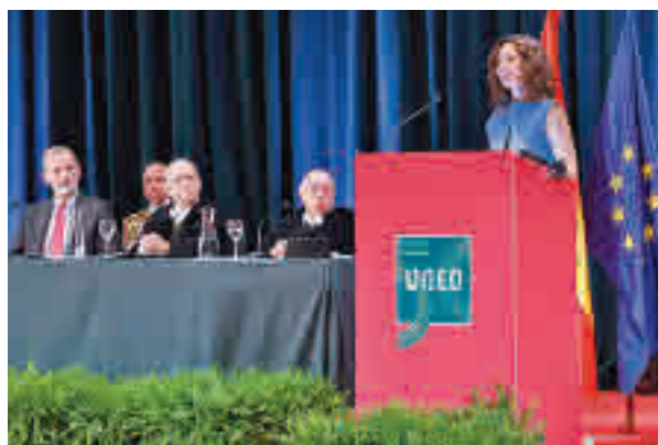
Díaz Ayuso, durante su intervención

evitar un riesgo: las carencias de quien sabe mucho de una cosa e ignora de raíz todas las demás. El profesionalismo y el especialismo al no ser debidamente compensado ha roto en pedazos al hombre europeo", señaló Díaz Ayuso.