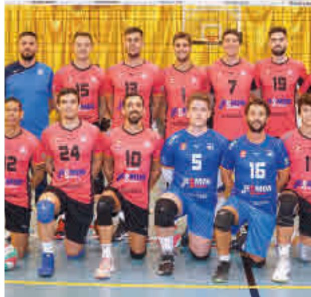
Un poco más de espera: La Superliga Masculina 2, por su parte, no arrancará hasta el sábado 8. En el Grupo A están encuadrados los equipos madrileños: Grupo Egido Pinto, VP Madrid, cvleganes.com, CUV Alcorcón y CV Collado Villalba.