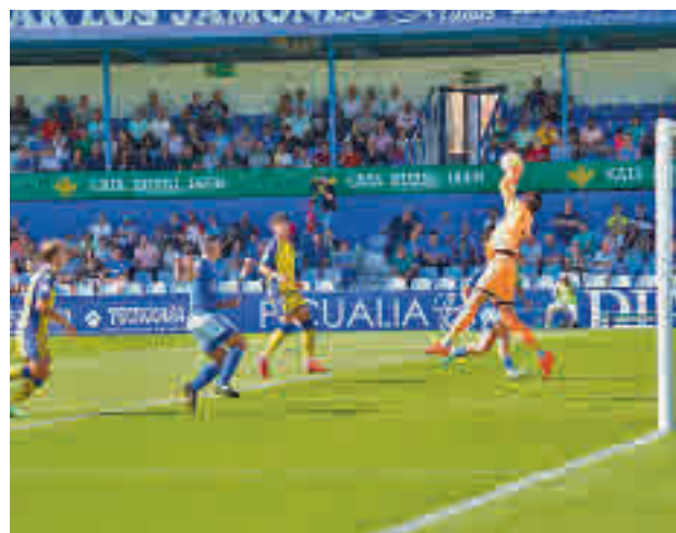
El Alcorcón sumaba su primera derrota del curso

El derbi de este domingo (12 horas) en Santo Domingo servirá, por tanto, para saber