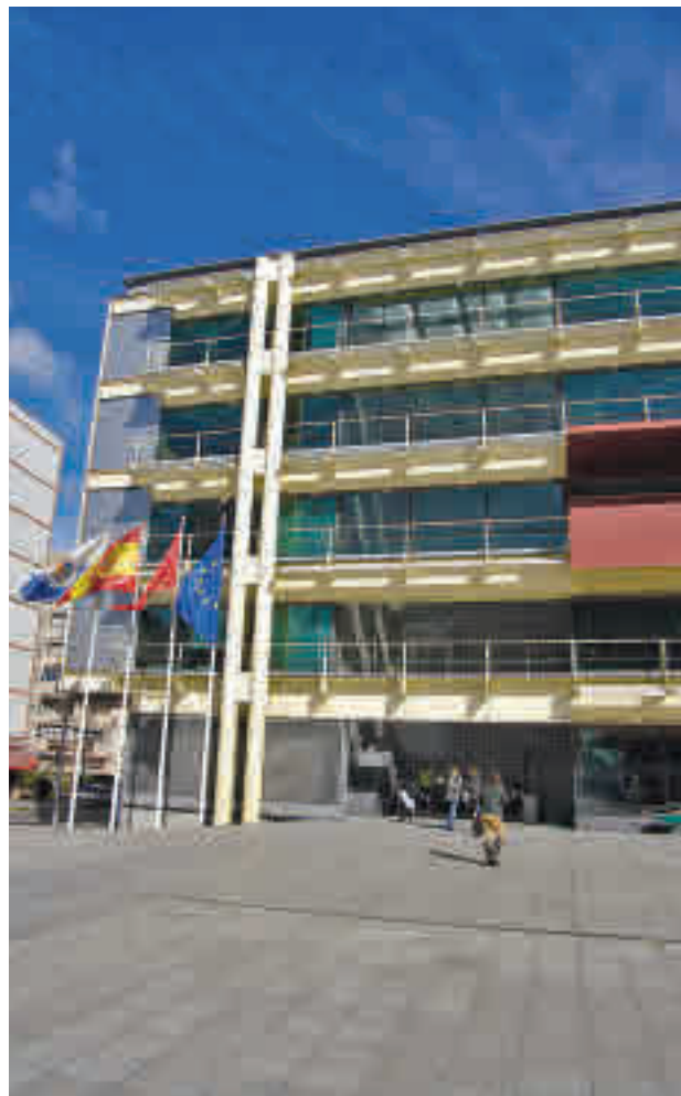
Ayuntamiento de Fuenlabrada

En cuanto al Impuesto de Vehículos de Tracción Mecánica, el 91% de los conductores de la ciudad pagarán menos que este año, ya que se hará una rebaja del 5% a los