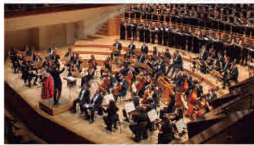
15 OCT. - 20:00 h. ORQUESTA CLÁSICA SANTA CECILIA Las cuatro estaciones (con narrador) - Vivaldi