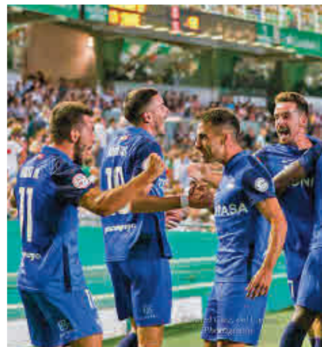
El Sanse dio la sorpresa en Córdoba

Tres triunfos en otras tantas jornadas sitúan al Club de Campo como líder en solitario de la Liga MGS de hockey hierba. Este domingo tiene una salida complicada al campo del Club Egara.