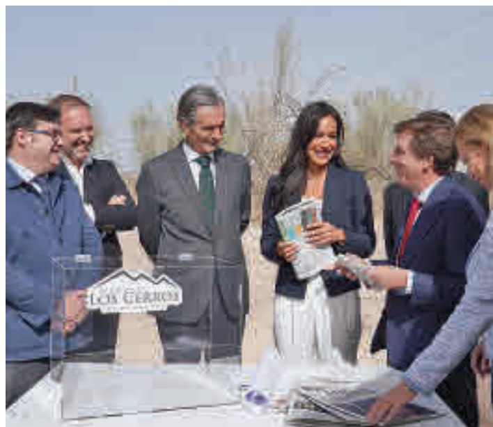
Las autoridades introdujeron en una urna periódicos y monedas

La primera fase durará 16 meses y las primeras viviendas podrían empezar a construirse a finales de 2023 ● El alcalde y la vicealcaldesa pusieron la primera piedra del proyecto