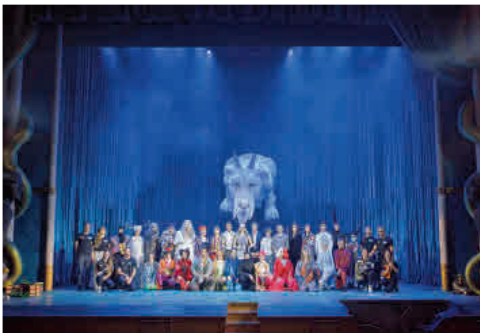
Foto de familia del elenco de 'La historia interminable'

» Teatro Adolfo Marsillach. Sábado 8, 20 horas. Precio: 15 euros.