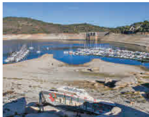
Embalse de la Comunidad de Madrid

madrileños se encontraban ese día al 55,7% de su capacidad máxima, con 525,3 hectómetros cúbicos almacenados, mientras que la media se sitúa en el 60,6% de la capacidad máxima. A pesar de este dato, la situación hidro-