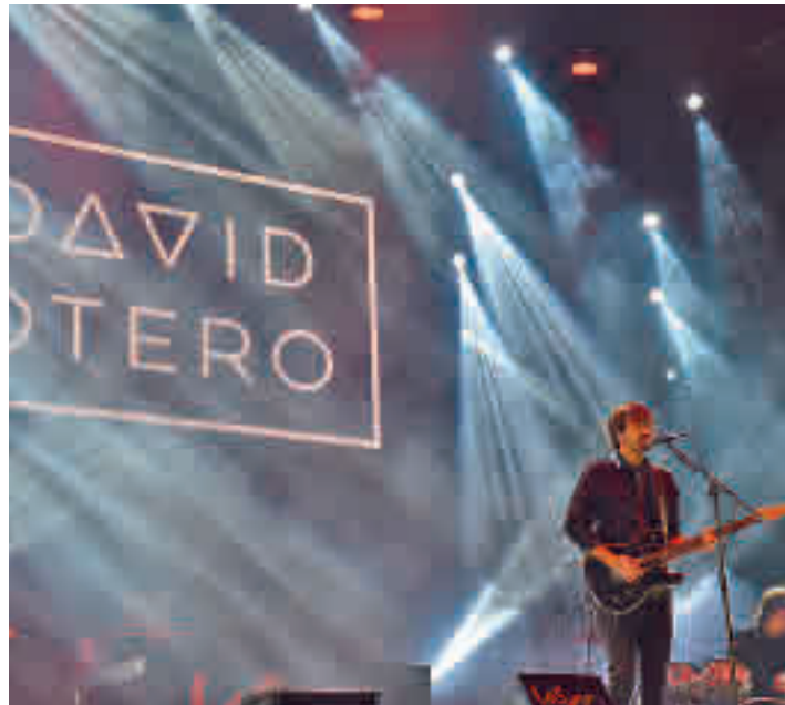
David Otero, ex de El Canto del Loco, en concierto

Ya está todo preparado en el recinto ferial Parque de la Vaguada para acoger la celebración de las Fiestas del Barrio del Pilar, del 7 al 12 de octubre, que regresan tras dos años suspendidas por la pandemia. La programación municipal llega cargada de propuestas con la música como principal protagonista. Los platos fuertes serán los conciertos de Siempre Así (vier-