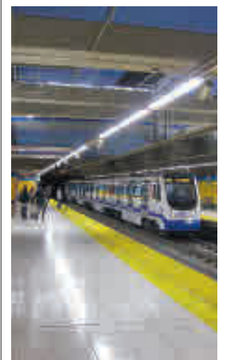
Línea 11 de Metro

La Comunidad de Madrid ha reclamado reiteradamente que se lleve a cabo una revisión técnica "lo antes posible" del uso de las mascarillas, "especialmente en el transporte público", para aprobar su retirada. La ministra de Sanidad ha defendido la necesidad de adoptar una decisión sobre el tema en base a lo que digan los expertos.