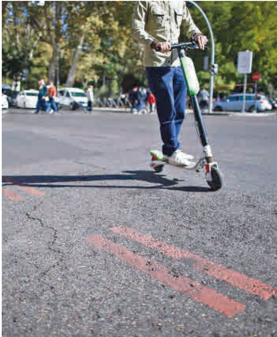
El conductor de un patinete eléctrico, transita por el centro de la capital

Además, los concesionarios deberán contar con los desarrollos tecnológicos ade-