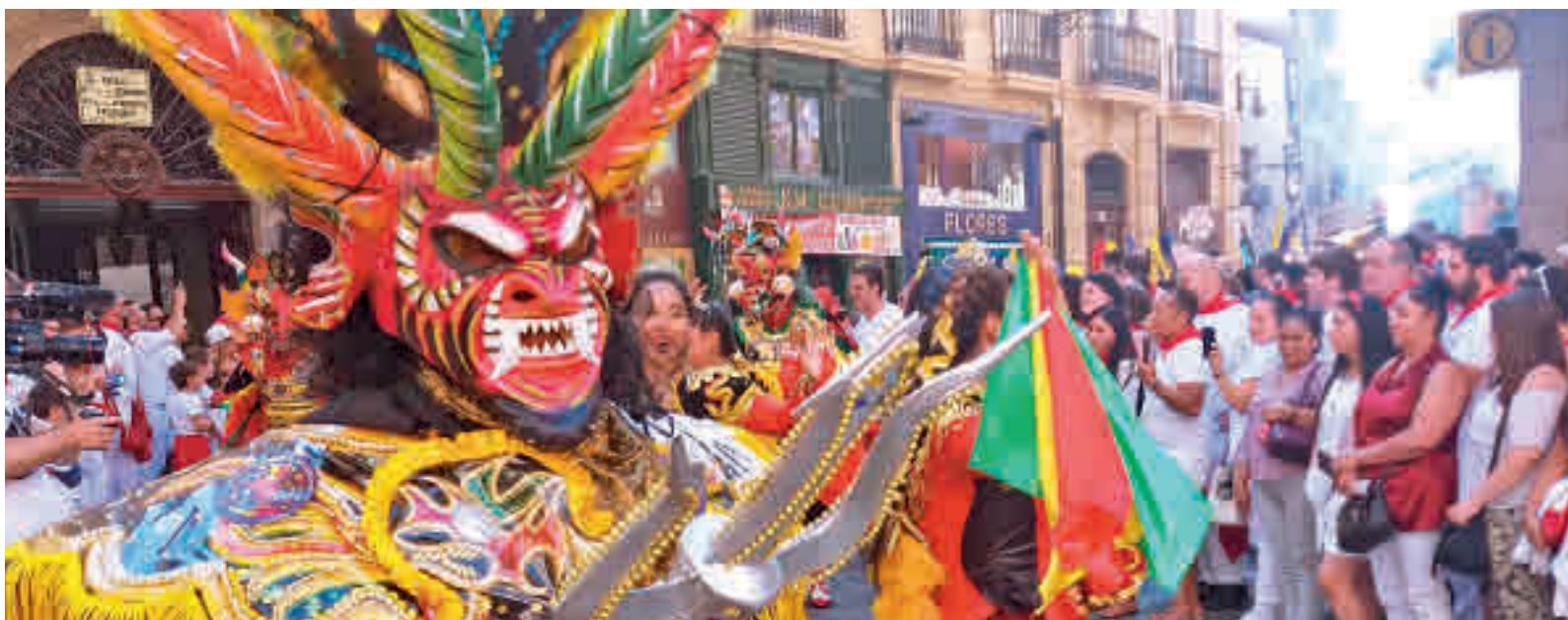
Cabalgata de pasado Festival de la Hispanidad