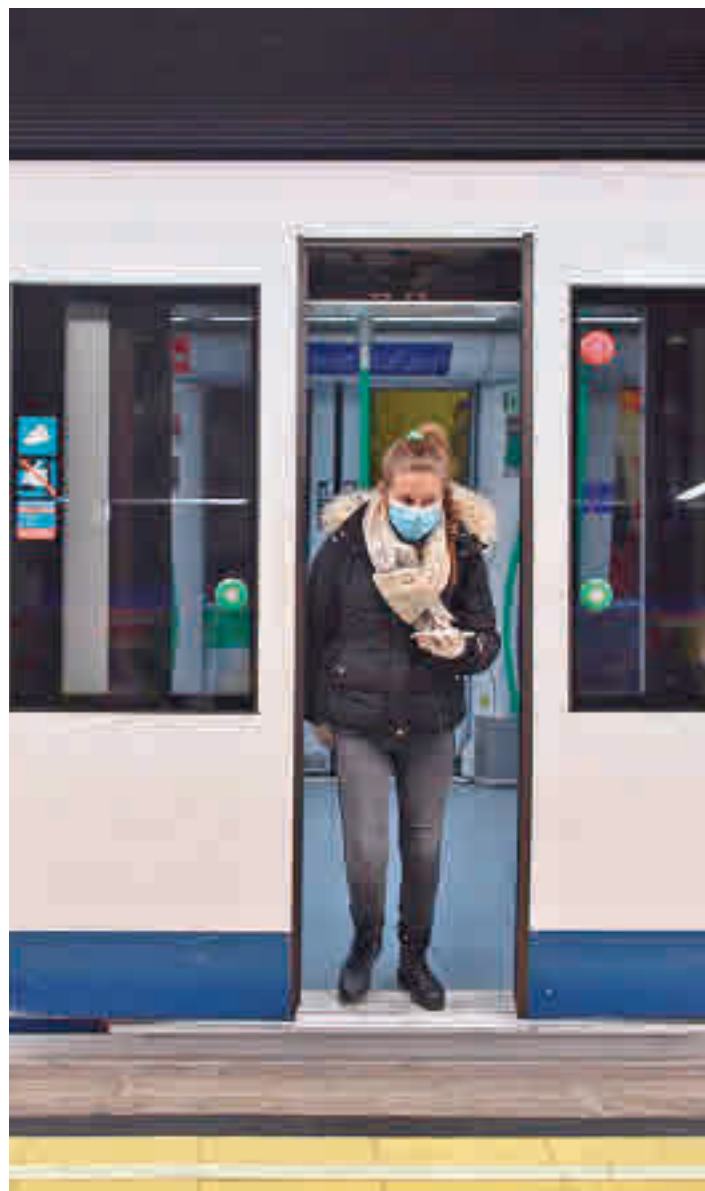
Mascarillas en el transporte público

El Ministerio y las autonomías se reúnen este viernes 7 en Galicia • Solo los técnicos de Madrid y de Murcia se han mostrado partidarios de retirarlas en el transporte público