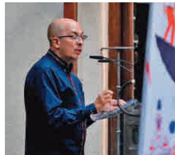
Jorge Volpi, en su pregón

Volpi avisó de que hay “pocas ficciones tan perniciosas” como las religiones y los nacionalismos excluyentes, y de que “asumirnos como herederos” de los conquistadores o indígenas de cinco siglos atrás es “otro feroz acto de imaginación”.