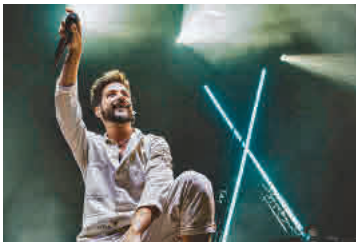
El cantante Camilo

“Hispanidad es la fiesta del español. Una celebración de la cultura común, que se hace entre 22 países, y sobre todo lo que nos une. Unos hechos culturales diversos y parecidos gracias a nuestro idioma, que es el más vivo del mundo”. Con estas palabras definió la consejera regional de Cultura, Marta Rivera de la Cruz, el Festival de la Hispanidad que se celebra en la Comunidad de Madrid hasta el próximo