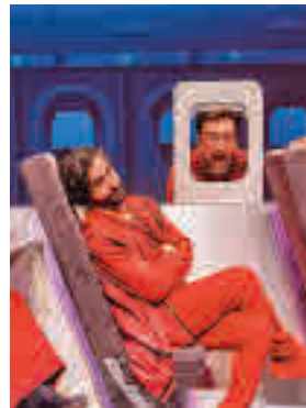
Yllana 'atterriza' en Getafe

» Teatro Municipal. Sábado 8, 19 horas. Precio: 10-12 euros.