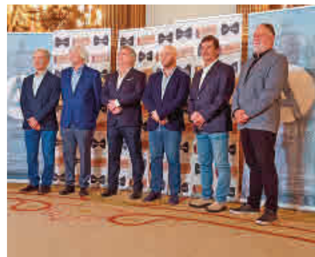
El elenco, en Casa de América GENTE

Todos aquellos que se quieran sumergir en las aventuras de Bastian tienen una cita en el Teatro Calderón, con funciones de martes a domingo (consultar horarios en la web oficial del musical, www.lahistoriainterminable-musical.com ). Las entradas tienen unos precios que oscilan entre los 24,90 euros y los 99,90 de platea preferente.