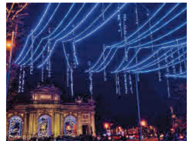
Una de las calles iluminadas el pasado año

El presupuesto del alumbrado de 2022 rondará los 4 millones, una inversión similar a la del año pasado actualizada con la inflación. Las luces llegarán a más de 230 emplazamientos de los 21 distritos, con el 100% de las bombillas de alta eficiencia energética. Repetirán, por ejemplo, la Gran Bola de Gran Vía o la Menina de Colón.