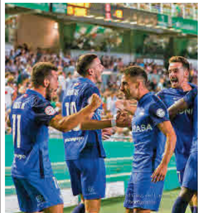
El Sanse dio la sorpresa en Córdoba

Tres triunfos en otras tantas jornadas sitúan al Club de Campo como líder en solitario de la Liga MGS de hockey hierba. Este domingo tiene una salida complicada al campo del Club Egara.