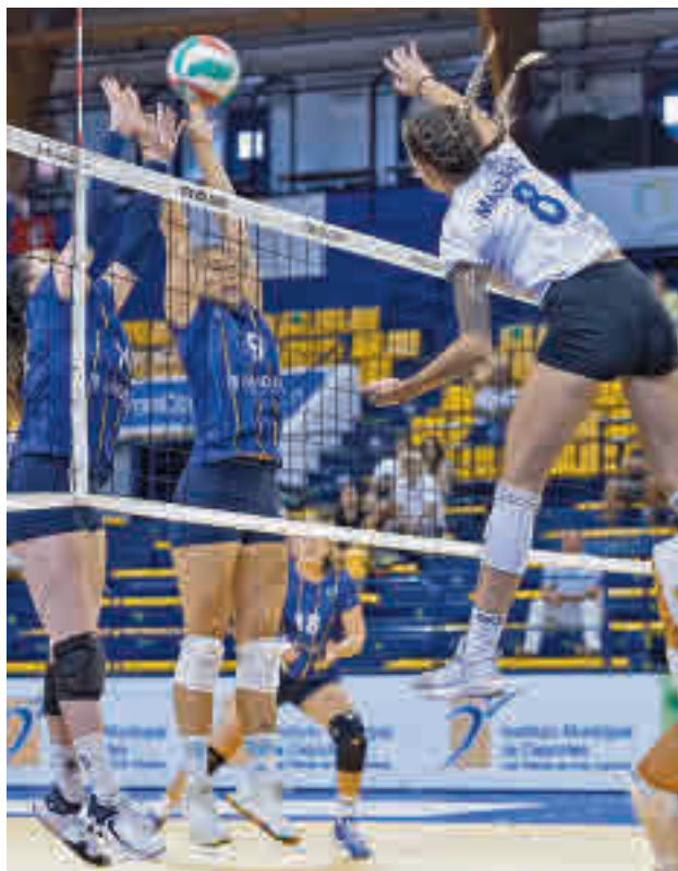
El Madrid Chamberí no pudo con el Gran Canaria

Al margen de la rivalidad vecinal, este choque tendrá un gran interés clasificatorio, dado que ambos equipos cerraron la primera jornada con sendas derrotas. Es cierto que, tras el derbi de este sábado, aún restarán 20 jornadas para el final de la fase regular, tiempo suficiente para enderezar el rumbo, pero no se puede perder de vista que dos tropiezos consecutivos podrían mermar la moral, al tiempo que alejarían al derrotado de ciertos objetivos a corto plazo, como pudiera ser, especialmente en el caso del Depol Feel Alcobendas, el billete