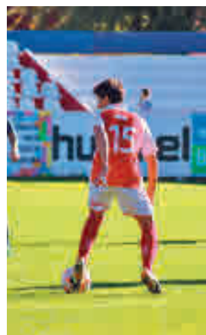
El Alcalá es penúltimo

rantes a disputar el 'play-off' de ascenso a Segunda RFEF. Sin embargo, después de cuatro jornadas disputadas, la realidad clasificatoria dicta