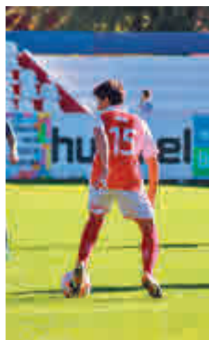
El Alcalá es penúltimo

rantes a disputar el 'play-off' de ascenso a Segunda RFEF. Sin embargo, después de cuatro jornadas disputadas, la realidad clasificatoria dicta