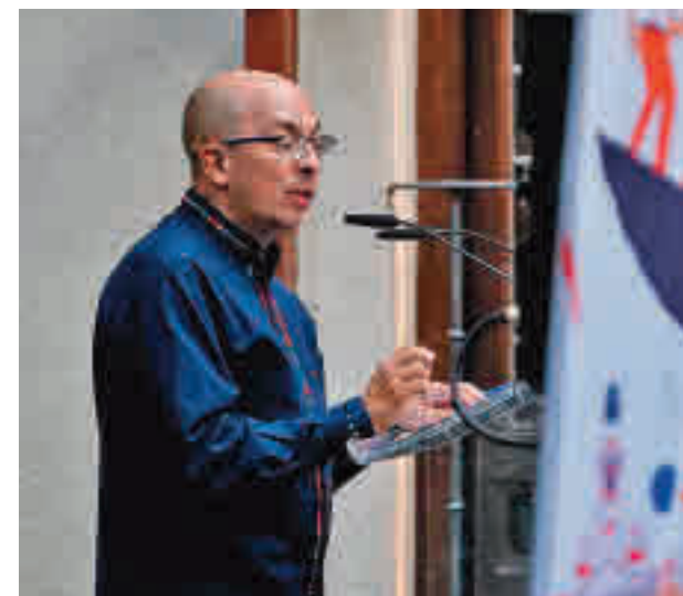
Jorge Volpi, en su pregón

Volpi avisó de que hay “pocas ficciones tan perniciosas” como las religiones y los nacionalismos excluyentes, y de que “asumirnos como herederos” de los conquistadores o indígenas de cinco siglos atrás es “otro feroz acto de imaginación”.