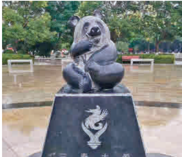
Una escultura de un oso panda será una de las señas de identidad

La instalación de una escultura de un oso panda y la creación de arcos de entrada y salida, entre las actuaciones • Además, el Ayuntamiento prevé peatonalizar la calle Dolores Barranco