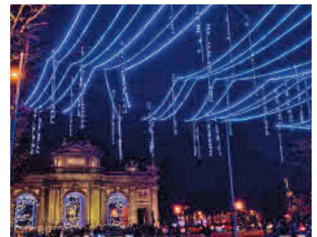
Una de las calles iluminadas el pasado año

El presupuesto del alumbrado de 2022 rondará los 4 millones, una inversión similar a la del año pasado actualizada con la inflación. Las luces llegarán a más de 230 emplazamientos de los 21 distritos, con el 100% de las bombillas de alta eficiencia energética. Repetirán, por ejemplo, la Gran Bola de Gran Vía o la Menina de Colón.