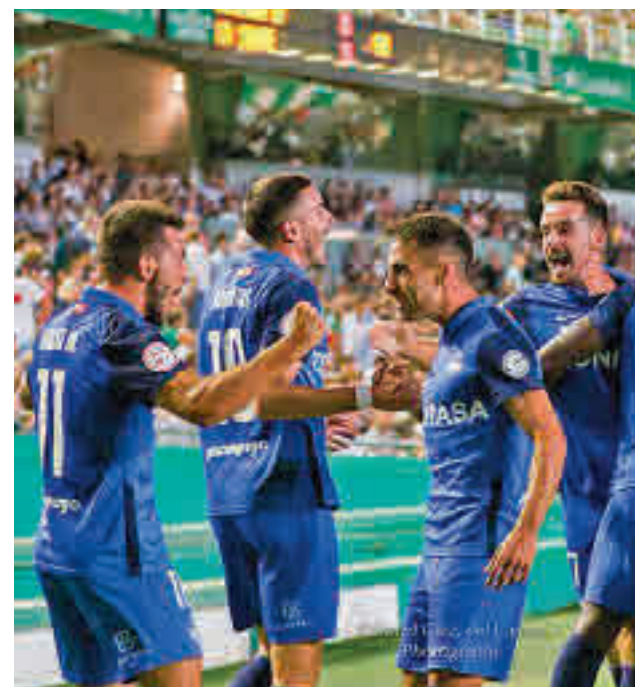
El Sanse dio la sorpresa en Córdoba

Tres triunfos en otras tantas jornadas sitúan al Club de Campo como líder en solitario de la Liga MGS de hockey hierba. Este domingo tiene una salida complicada al campo del Club Egara.