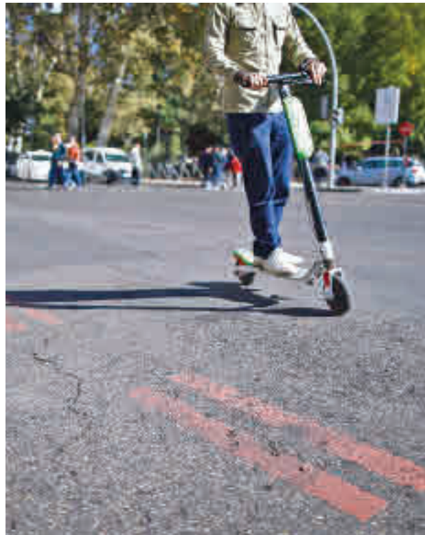
El conductor de un patinete eléctrico, transita por el centro

Además, los concesionarios deberán contar con los desarrollos tecnológicos adecuados para obligar a esta-