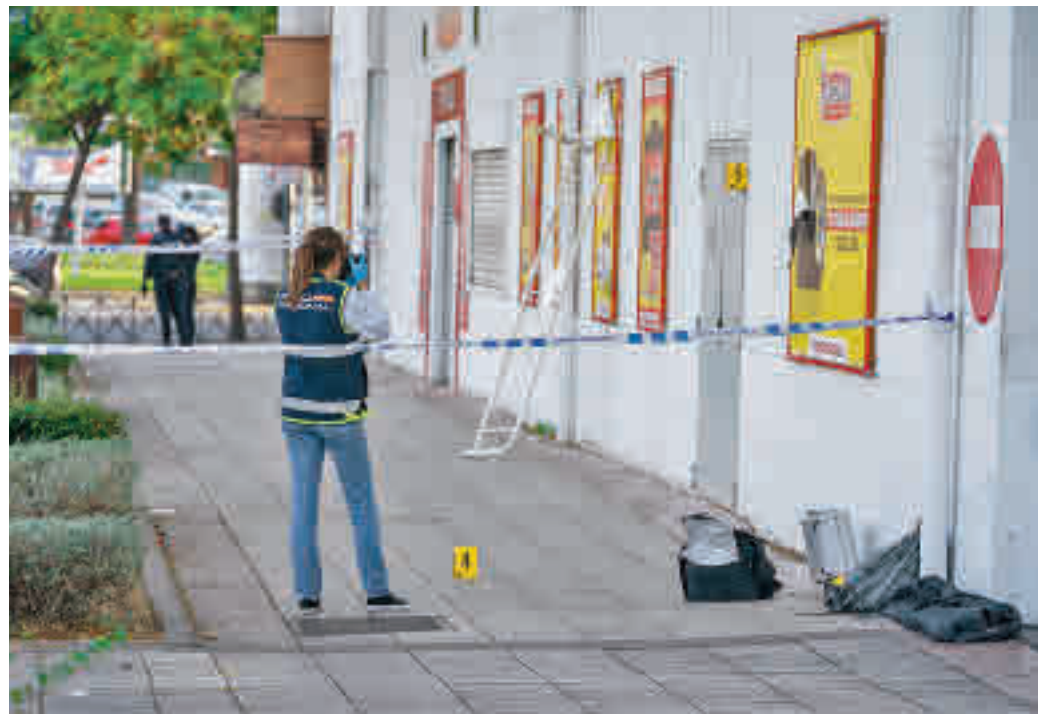
Discoteca de Fuenlabrada donde se produjo uno de los asesinatos

La Policía Nacional ha establecido un grupo conjunto con agentes de Alcorcón y Fuenlabrada para investigar los sucesos.