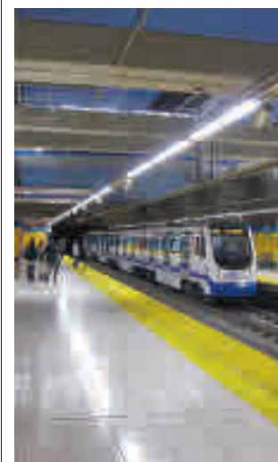
Línea 11 de Metro

La Comunidad de Madrid ha reclamado reiteradamente que se lleve a cabo una revisión técnica "lo antes posible" del uso de las mascarillas, "especialmente en el transporte público", para aprobar su retirada. La ministra de Sanidad ha defendido la necesidad de adoptar una decisión sobre el tema en base a lo que digan los expertos.