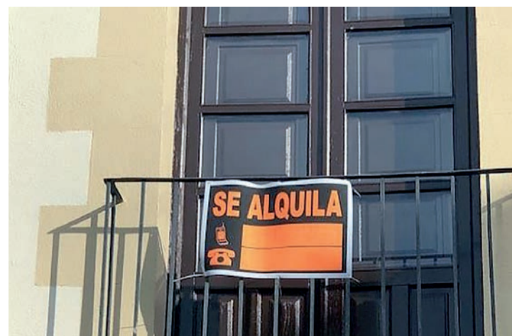
Una vivienda en alquiler en Logroño.