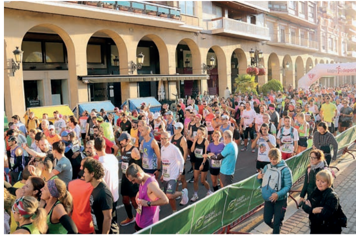
Una imagen de la reciente Maratón de Logroño.

La asociación se despachó contra el partido del primer edil, el PSOE: “Esta formación política ha dado un giro a su política de seguridad pública, ha pasado de no necesitar policías en la calle a utilizarlos para actos multitudinarios de su conveniencia u organizados por empresas poten-