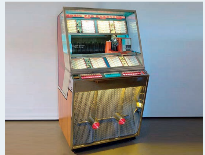
Una gramola o 'jukebox'.