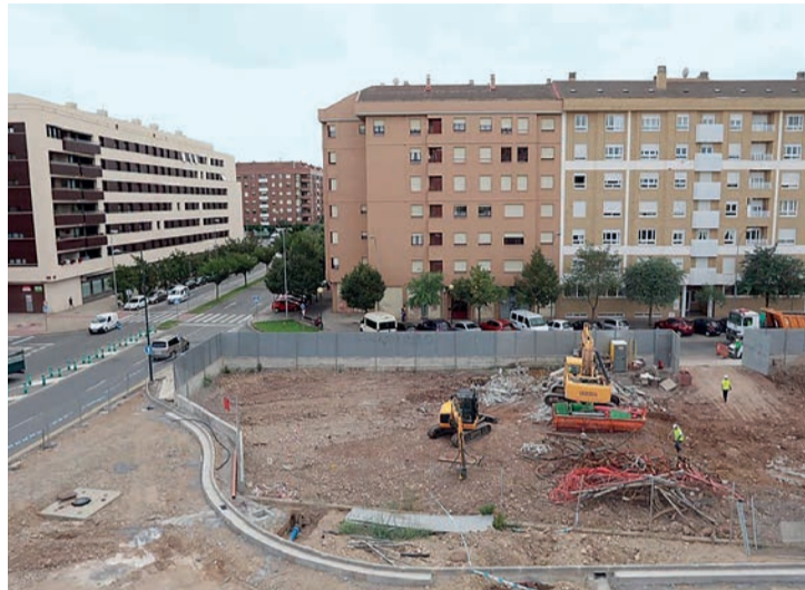
Las obras de desmontaje de la subestación de Cascajos.

“Se trata una legislatura perdida, porque no tenemos fecha para la apertura del conjunto del cruce de Vara de Rey, no tenemos