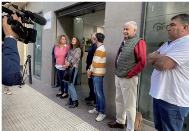
Los afiliados que quieren congreso y no un dedazo, en la sede de los populares.

A sus 50 años, el jarrero afronta un reto mayúsculo debido a la crisis interna de su formación, que además le mira con recelo. El doctor en Historia Moderna y Contemporánea se puso en contacto con los cabezas de cartel populares para transmitirles el "encargo expreso de Núñez Feijóo" para que comande las listas en las elecciones de 2023. Ceniceros, Domínguez y Cuevas re-