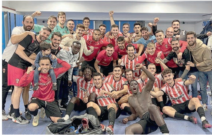
Los jugadores de la Unión Deportiva Logroñés, en el festejo del 3-0 al Sabadell.