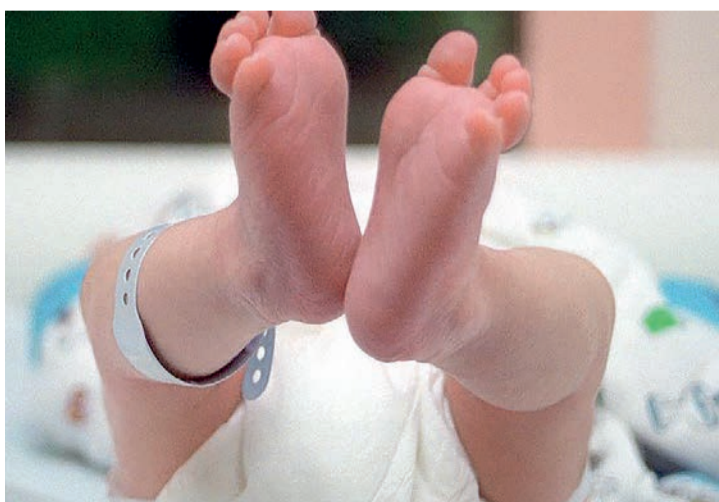
Imagen de un bebé recién nacido.