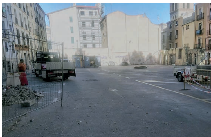
Las obras están iniciadas en el barrio de La Villanueva.

La Junta de Gobierno también aceptó la recepción, de forma pro-