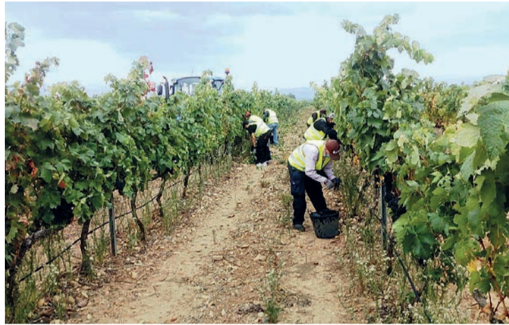
La vendimia, clave en la dinamización del mercado laboral riojano.

El Ejecutivo de Concha Andreu presumió de buena gestión en un comunicado: "Los números señalan que en septiembre de 2022 se contabilizan en La Rioja 745 personas desempleadas menos que el pasado mes, 1.999 menos que hace un año y que se mantiene mes a mes el importante aumen-