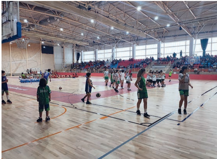
La fallida pista de Lobete acogió el pasado fin de semana un torneo de minibasket.

Un problema para el Logrobasket, que debía debutar este sábado 8 contra el Santurtzi en la nueva temporada de la Liga EBA sobre la remozada superficie, en la que realizó la pretemporada y este último fin de semana se celebró un torneo de minibasket. Así, el Logrobasket jugará el domingo 9, a las 18:00 en el Palacio, un día después del estreno del Clavijo en LEB Plata, a las