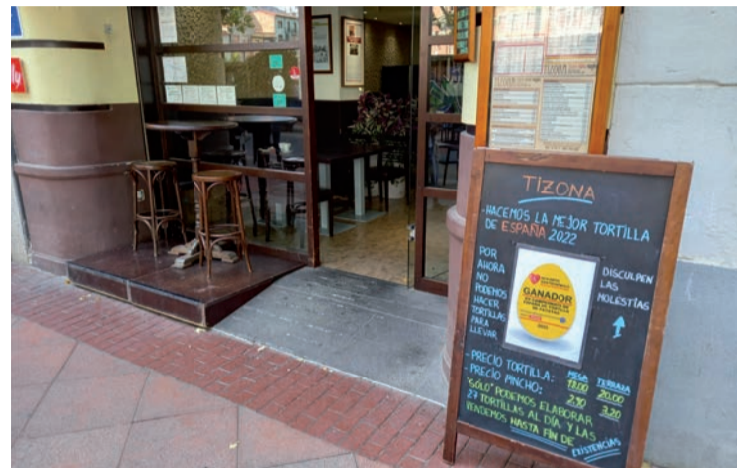
El Tizona, con el cartel en el que explica que sólo se hacen 27 tortillas al día.