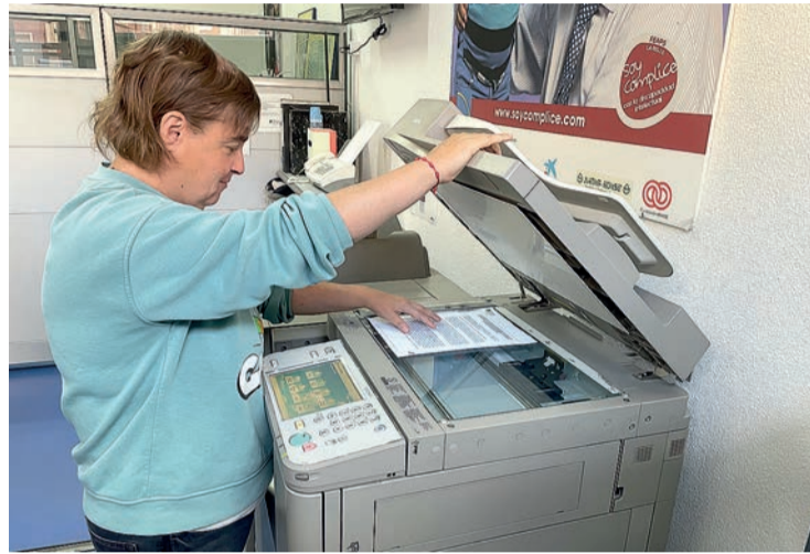
El trabajo inclusivo de Plena Inclusión La Rioja.

La iniciativa permitió formar en esta metodología a 105 profesionales de apoyo a la discapacidad intelectual en todo el país, 27 de ellos de La Rioja. "Pudieron profundizar en un sistema que demuestra resultados para todas las personas, y de forma especial en perfiles con dificultades de empleabilidad debido a sus grandes necesidades de