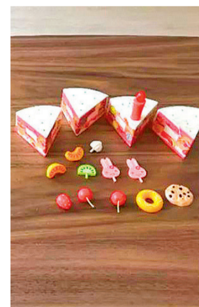
Un juego de montaje

Un equipo de investigación de la Universidad de Almería (UAL) ha desarrollado un estudio que muestra los beneficios de la realización de juegos de montaje dirigidos en la enfermedad de Alzheimer. Los expertos han confirmado