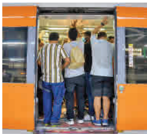
Els retrassos són el pa de cada dia.

EL PERIÓDICO GENTE NO SE RESPONSABILIZA NI SE IDENTIFICA CON LAS OPINIONES QUE SUS LECTORES Y COLABORADORES EXPONGAN EN SUS CARTAS Y ARTÍCULOS