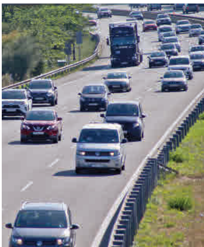
A l'AP-7 hi han mort 22 persones aquests primers nou mesos.

cadascuna. Durant els nou primers mesos de l'any han resultat ferides greus o han mort 642 persones, un 11,4% menys que el 2019, quan n'hi va haver 725. El nombre d'accidents mortals o greus també s'ha reduït un 15,6% en comparativa amb el 2019 (de 609 a 514).