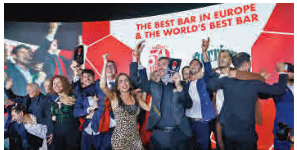
La capital catalana té tres bars entre els deu primers. ACN

En setena posició s'ha situat un altre local de Barcelona, el Two Schmucks. La presència estatal entre els 50 millors bars del món s'ha completat amb el madrileny Salmon Guru, que ha quedat en quinzena posició. Segons ha explicat l'organització, és la primera ocasió que un bar fora de Nova York o Londres aconsegueix el primer lloc del rànquing.