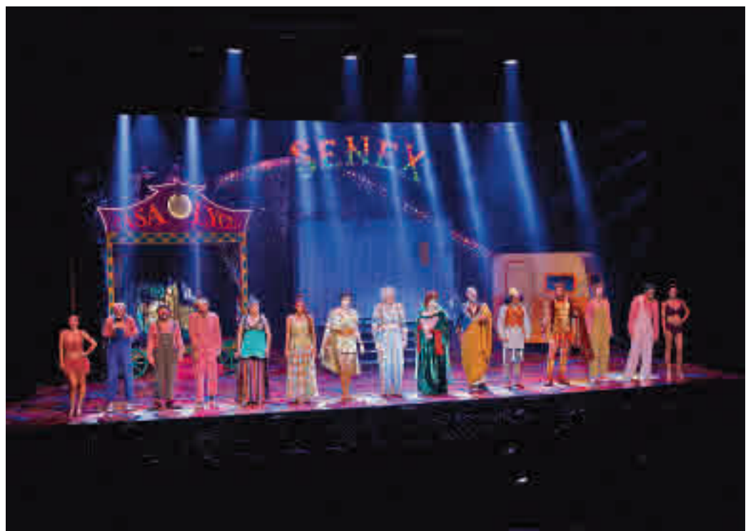
L'espectacle ja es pot veure al Teatre Condal.

Segons han explicat, es tracta de la comèdia musical "més divertida de tots els temps". Està basada "molt lliurement" en les comèdies de