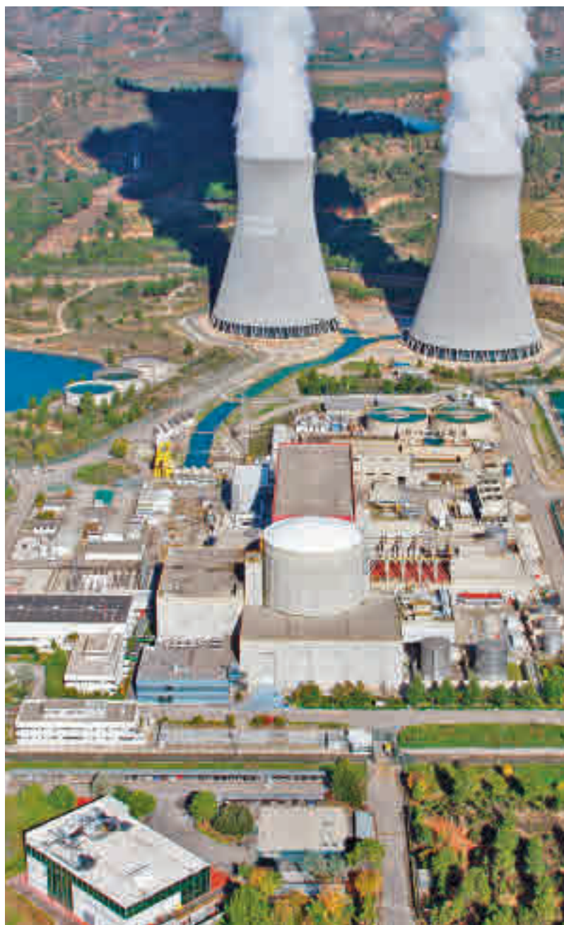
Panorámica de la central nuclear de Cofrentes

El principal inconveniente y el mayor motivo para el desmantelamiento de todas las centrales nucleares es que su combustible, el dióxido de uranio, mantiene su radiactividad durante varios miles de años. Ante la crisis energé-