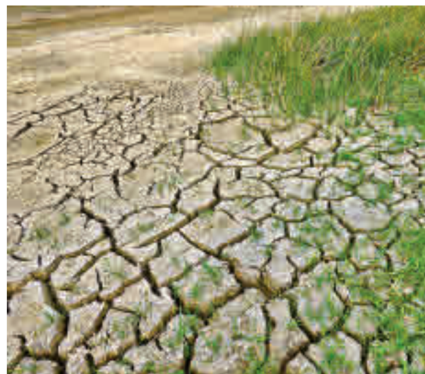
Cada vez aumentan más las zonas en riesgo

mundo en los años venideros. Un estudio de la Universidad de East Anglia (UEA), publicado en la revista Climatic Change , muestra que incluso un modesto aumento de la temperatura de 1,5°C tendrá graves consecuencias en India, China, Etiopía, Ghana, Brasil y Egipto. Si el incremento fuera de dos grados, la probabilidad de sequía se cuadruplicaría en Brasil y