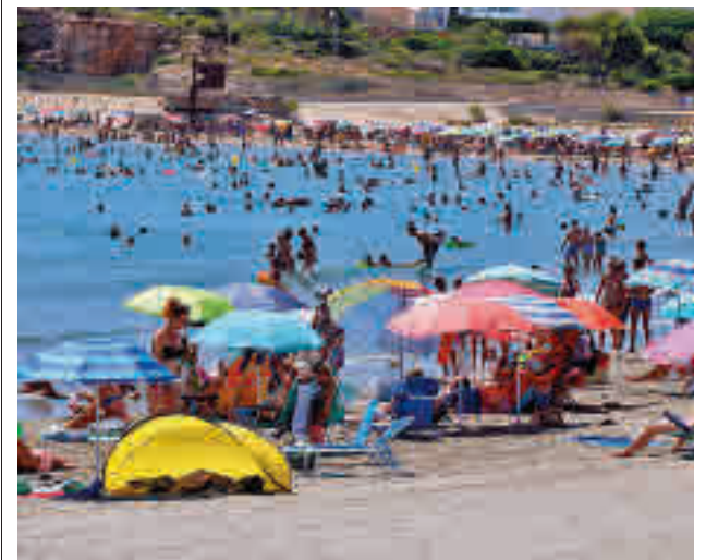
Les platges són un dels punts d'atracció.

Des del Govern català s'ha carregat diverses vegades contra la gratuïtat dels abonaments de Rodalies coincidint amb les múltiples avaries que han patit els passatgers durant aquest setembre. El conseller de Polítiques Digitals i Territori va reclamar, llavors, el traspass de competències per millorar el servei de la xarxa.