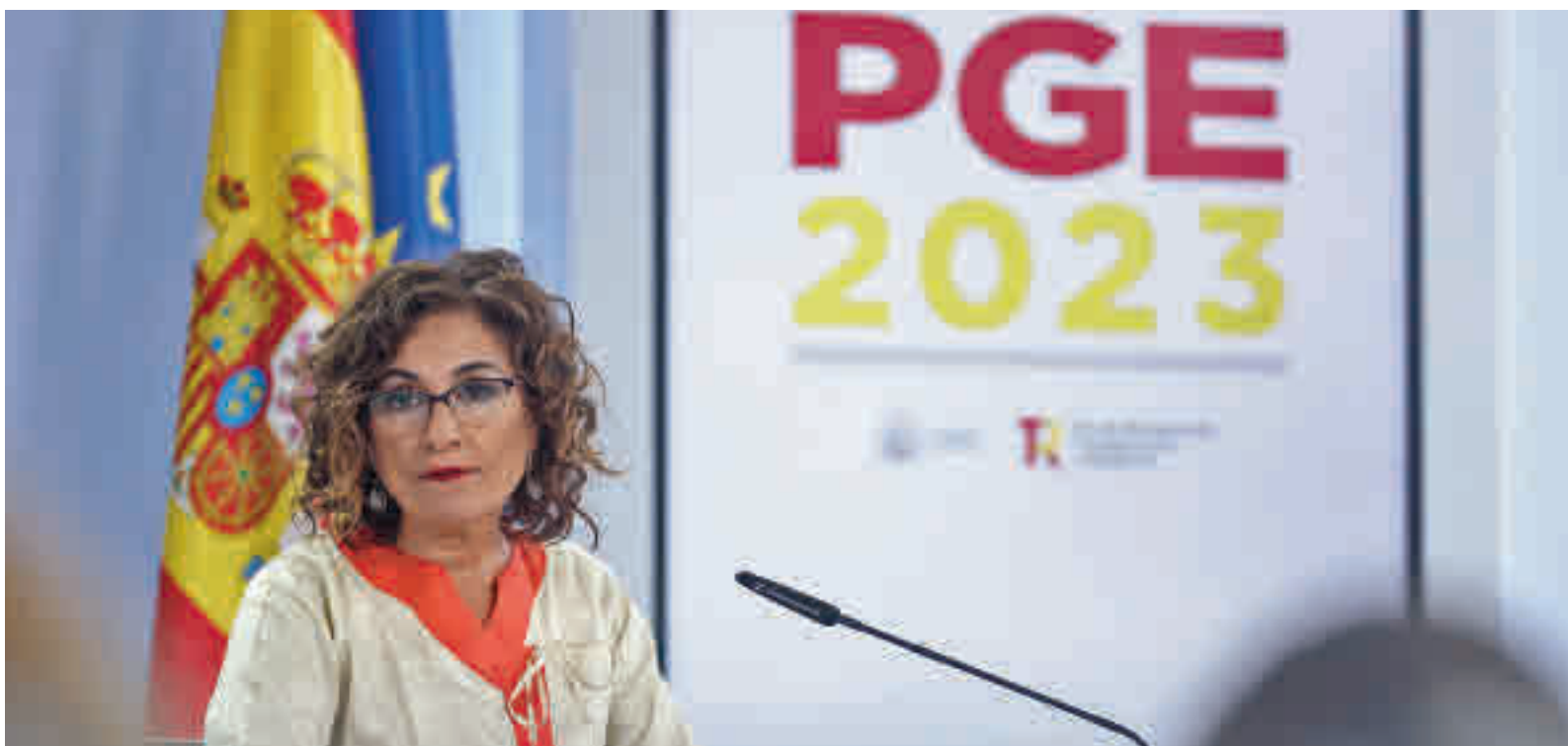
María Jesús Montero presentó los presupuestos de 2023

El refuerzo de la atención sanitaria, fundamentalmente la primaria, las becas, la Educación o la Dependencia son otros de los aspectos fundamentales de las cuentas, que también incrementan el gasto en Defensa.