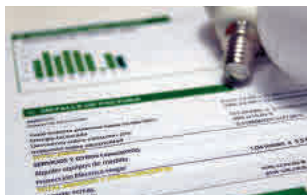
El IVA de la luz se ha rebajado

cias de la guerra en Ucrania. Preguntada por la ausencia de estas herramientas en el proyecto de presupuestos generales, Maroto señaló que ese texto recoge "prioridades estructurales" y que medidas de ese tipo se encuadran en "políticas de choque" por adversidades coyunturales, que