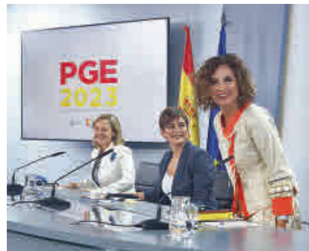
Presentación de los presupuestos