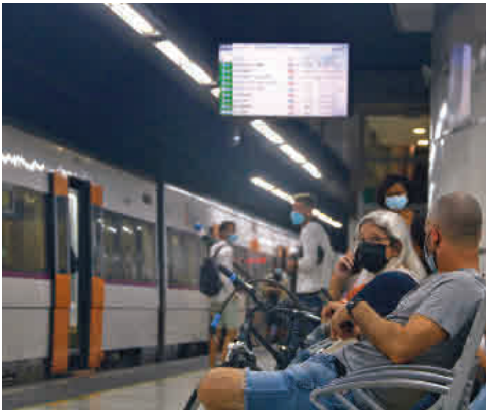
El govern espanyol ha anunciat que mantindrà la gratuïtat.