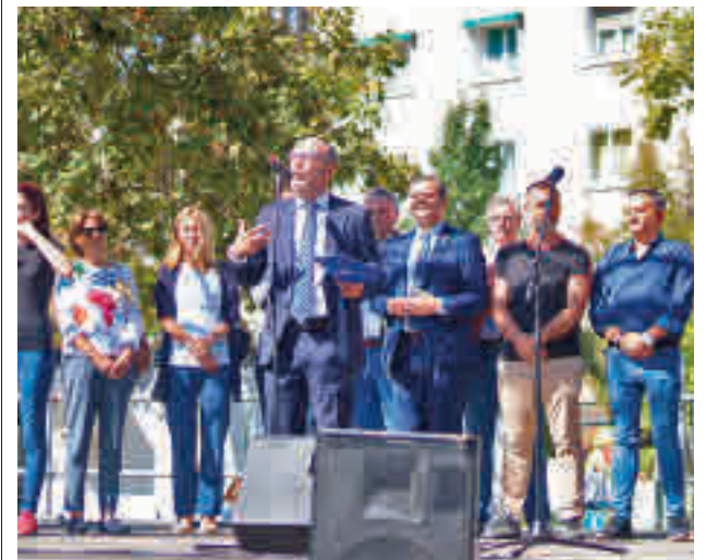
Un momento del pregón oficial de los festejos

gentedigital.es Toda la actualidad de los distritos de Madrid, en nuestra web.