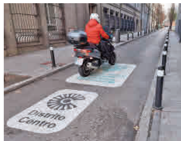
Una motocicleta transita por la zona de bajas emisiones

Con esta información, delimitaron distintas áreas de análisis en función de la concentración de sensores de tráfico en las rutas de acceso a Madrid Central, y posteriormente evaluaron la intensidad de tráfico antes y des-