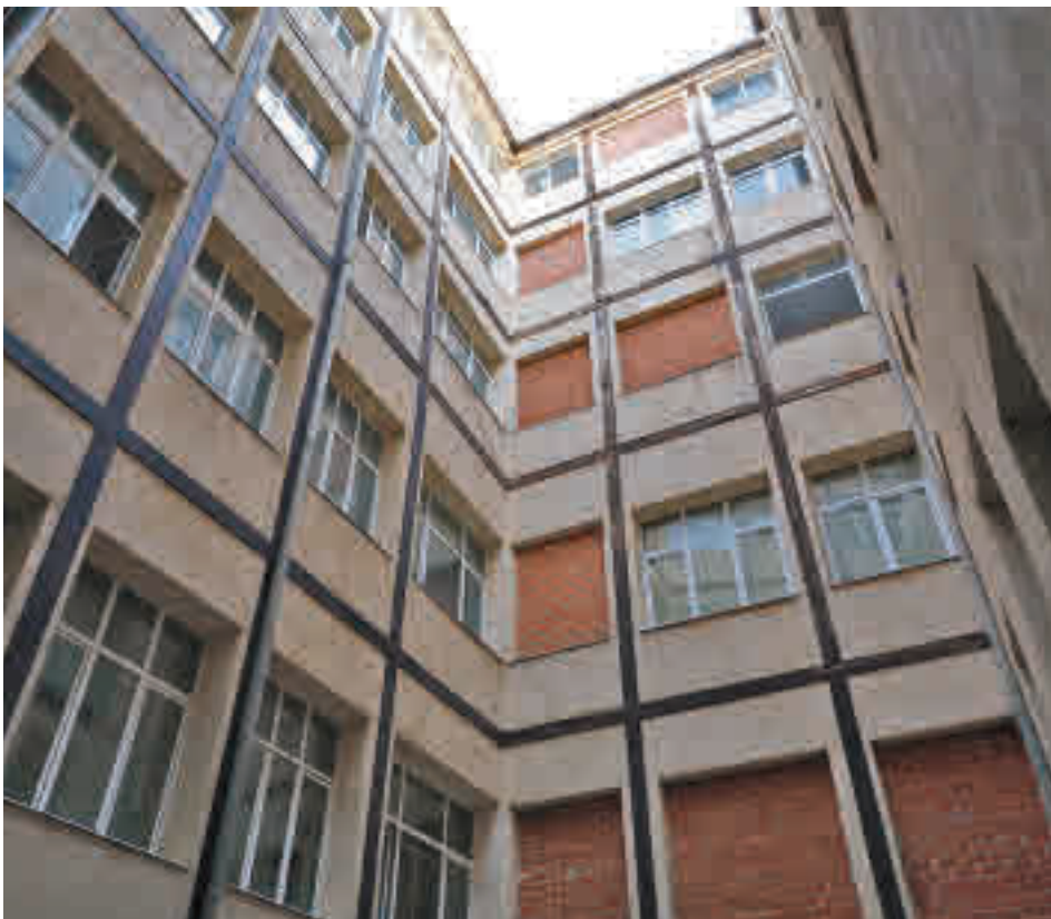
Estado actual del inmueble situado en el distrito Centro