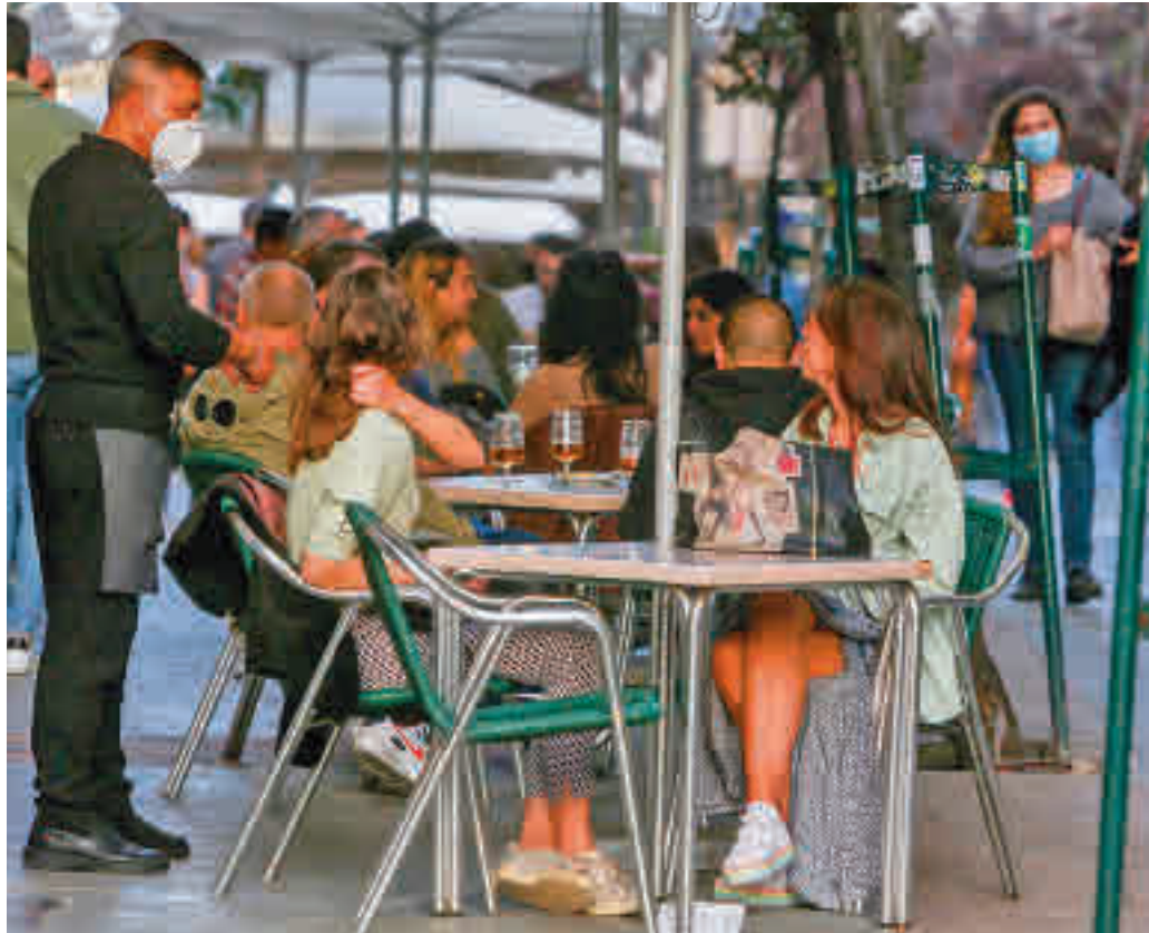
Una terraza de veladores situada en la almendra central de la capital

“Está en juego la viabilidad de muchos locales y no tiene sentido que no se pue-