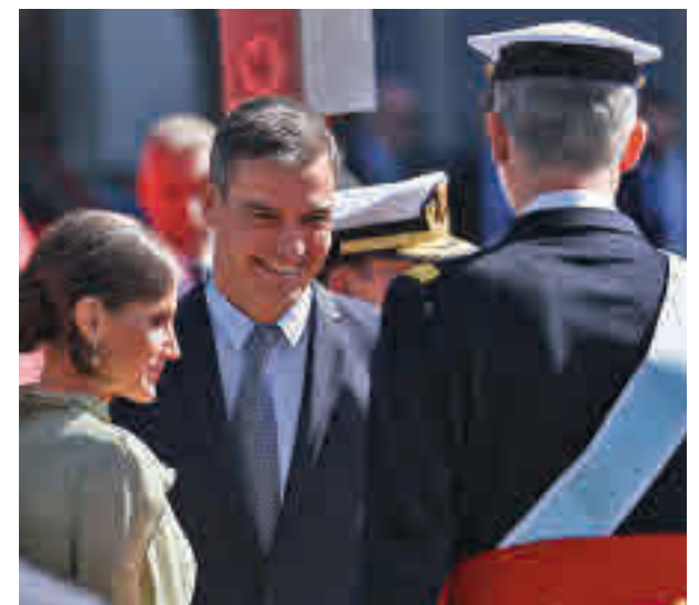
Pedro Sánchez habla con el Rey

Se estrenó en la tribuna como líder de la oposición el nuevo presidente del PP, Alberto Núñez Feijóo, que ya tenía experiencia en el desfile cuando era presidente de Galicia. Junto a él se sentaron Santiago Abascal (Vox), Cuca Gamarra (PP) y el resto de representantes políticos y de la sociedad civil.