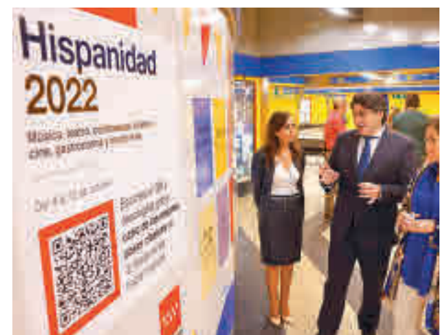
Presentación de la iniciativa

literarias son Plaza Castilla y Menéndez Pelayo (Línea 1), Quevedo y Santo Domingo (Línea 2), Callao y Sol (Línea 3), Colón y Pinar de Chamarín (Línea 4), Rubén Darío y Alameda de Osuna (Línea 5), República Argentina y Moncloa (Línea 6), Cartagena y Antonio Machado (Línea 7), Colombia y Nuevos Ministerios (Línea 8), Avenida de América y Concha Espina (Línea 9), Plaza de España y Cuzco (Línea 10), San Francisco y Plaza Elíptica (Línea 11) y Puerta del Sur y Arroyo Culebro (Línea 12).