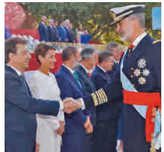
El Rey felicita a los presidentes autonómicos