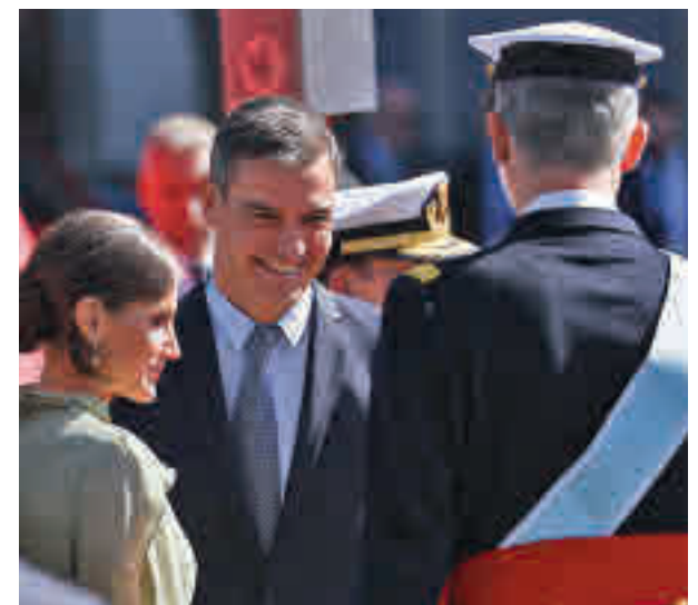
Pedro Sánchez habla con el Rey

Se estrenó en la tribuna como líder de la oposición el nuevo presidente del PP, Alberto Núñez Feijóo, que ya tenía experiencia en el desfile cuando era presidente de Galicia. Junto a él se sentaron Santiago Abascal (Vox), Cuca Gamarra (PP) y el resto de representantes políticos y de la sociedad civil.