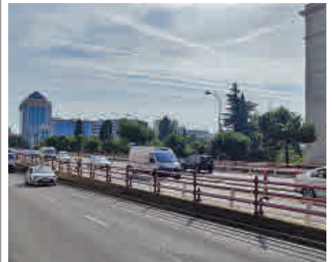
El paso elevado de Raimundo Fernández Villaverde

Como complemento a la actuación realizada, esta semana se han iniciado labores complementarias de limpieza, reparación y mejora estética de la zona inferior, con un presupuesto de 200.000 euros. Estos trabajos tendrán lugar en horario nocturno y no requerirán de cortes de tráfico importantes, ya que solo se darán ocupaciones puntuales y temporales. Su duración será de aproximadamente cinco semanas.