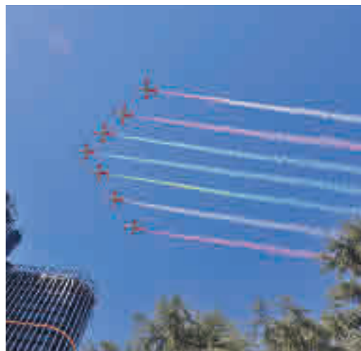
Los aviones surcaron el cielo de Madrid