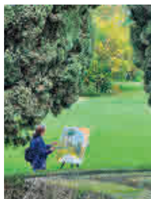
Una participante en 2021

la Junta de distrito en el parque histórico de Barajas podrán inscribirse hasta el 18 de octubre de manera digital a través en la web del Ayuntamiento y de forma presencial en las oficinas de registro municipales, previa cita, o en las dependencias de Correos. El certamen se desa-