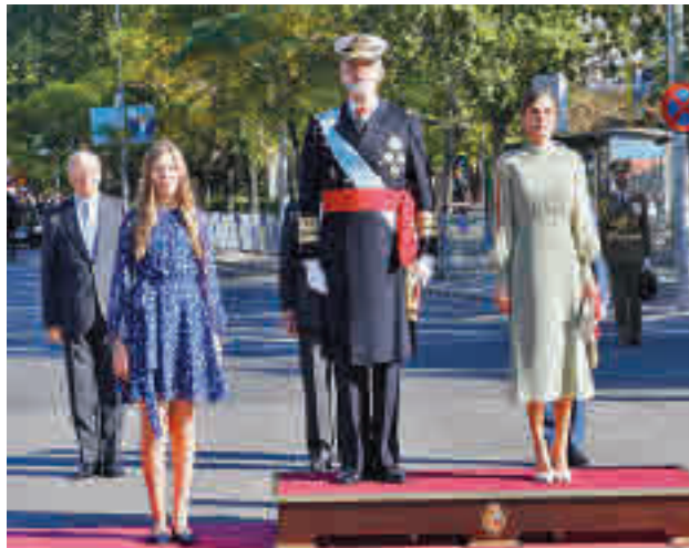
Los Reyes presidieron el desfile

Más allá de ese detalle, que casi se ha convertido en una tradición, Felipe VI y doña Letizia volvieron a presidir un desfile al que acudieron con su hija menor, la Infanta Sofía, en ausencia de la heredera al trono, la Princesa Leonor, que está en Gales. La otra anécdota del día correspondió al paracaidista que se lanzó con la bandera de España, que pudo aterrizar a pesar de un pequeño incidente.