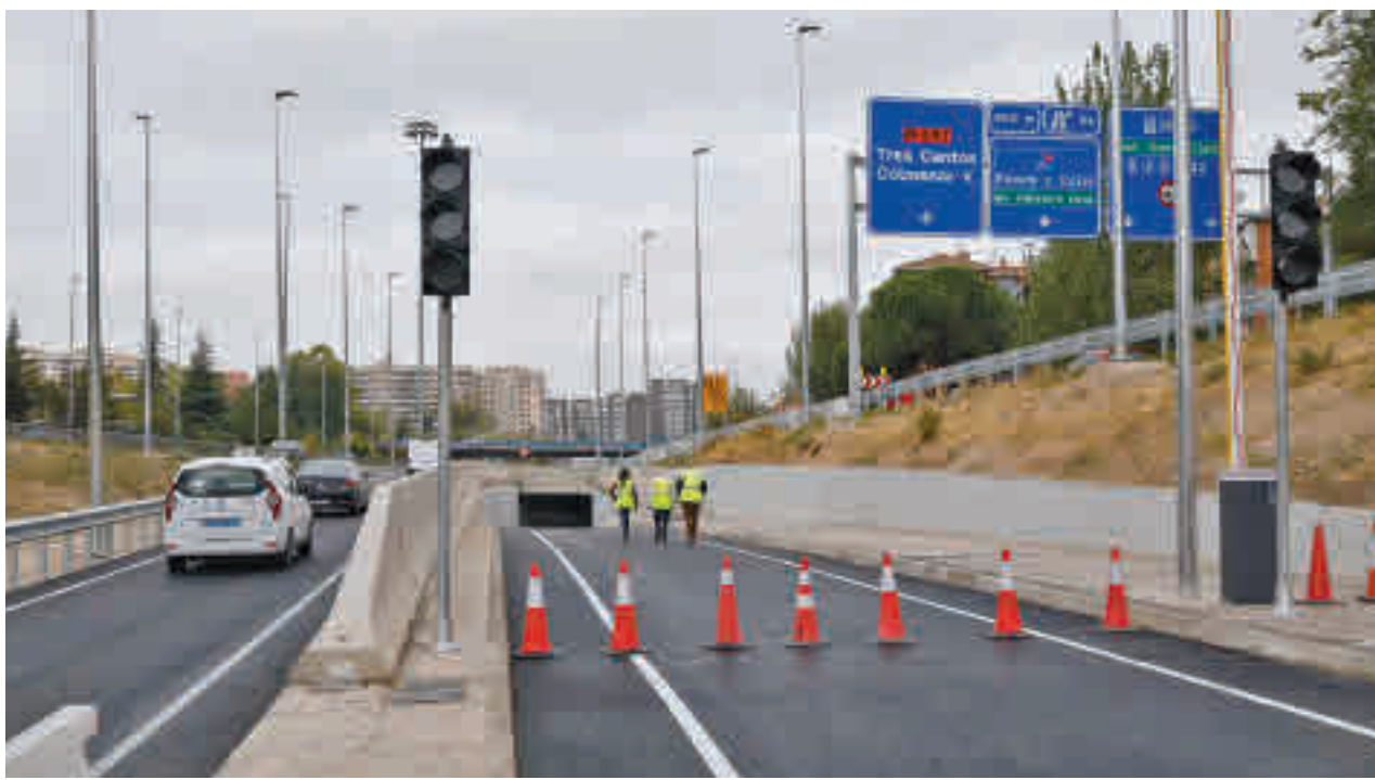
La entrada al túnel, antes de su puesta en funcionamiento