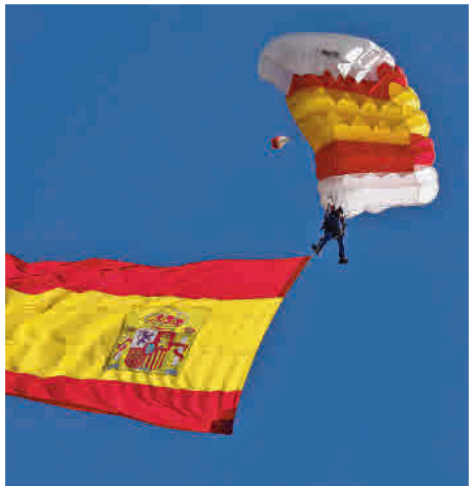
El paracaidista tuvo algún problema para aterrizar en La Castellana