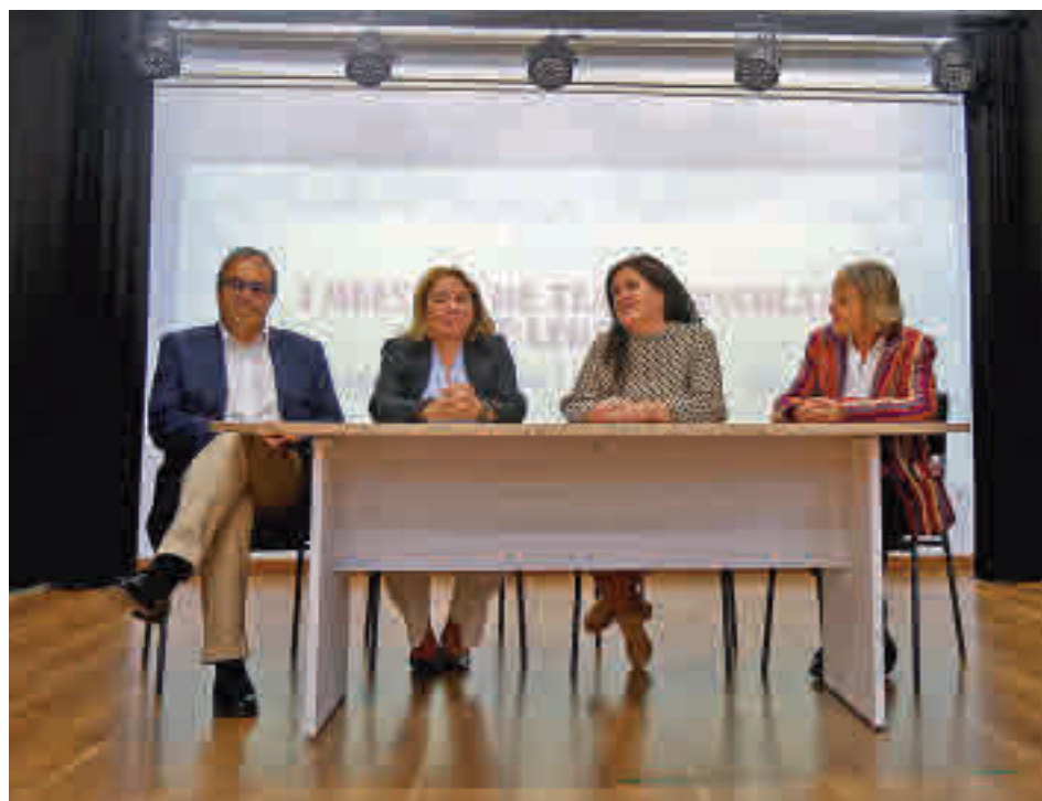
Presentación de la Muestra de Teatro Escolar

Toda la actualidad de Leganés, en nuestra página web