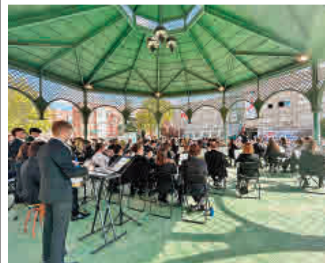
Celebración de los 50 años de la Escuela de Música