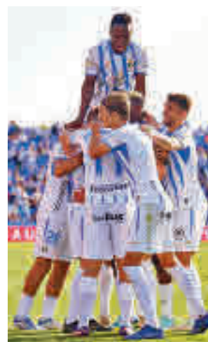
El Leganés ganó al Málaga

Para corroborar esta buena racha, el Leganés viaja este domingo a Valencia para enfrentarse a las 14 horas a uno de los rivales más complicados de la categoría, el Levante. A pesar de no estar cumpliendo con las expectativas, la plantilla granota es una de las que más calidad tiene de la Segunda División.