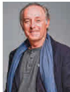
Soto actuará en Boadilla

» Teatro Municipal. Sábado 15, 19 horas. Precio: 14-16 euros.