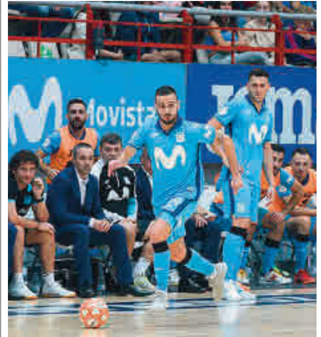
Los de Pato cayeron en su último partido con el Betis

Sin la presencia del jugador de Morata de Tajuña, el Inter visita este viernes 14 (20 horas) la pista de otro histórico en horas bajas, el Xota, que solo ha podido sacar dos puntos en las tres primeras jornadas, merced a sendos empates ante BeSoccer UMA Antequera y Jimbee Cartagena. Además, encajó una derrota en su visita al Quesos Hidalgo Manzanares.