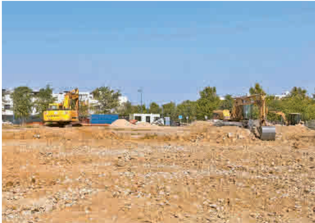
Obras del nuevo espacio de ocio de la calle Osa Menor

Este área se ubicará en una gran parcela municipal que se sitúa en la confluencia de