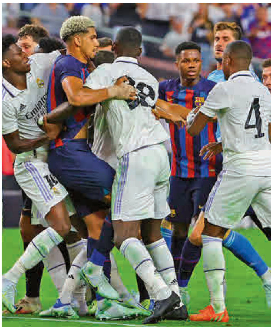
El amistoso de este verano en EEUU dejó algún momento de tensión

Este primer 'Clásico' de la 22-23 no es ajeno a las aperturas de un calendario tremendamente condicionado por el Mundial de Catar. Tanto Madrid como Barça llegan al choque del Santiago Bernabéu después de unos exigentes partidos de Champions ante Shakhtar e Inter, respec-