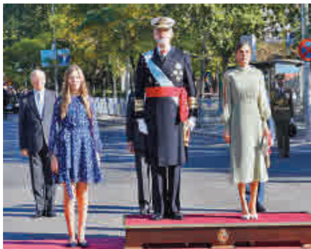
Los Reyes presidieron el desfile

Más allá de ese detalle, que casi se ha convertido en una tradición, Felipe VI y doña Letizia volvieron a presidir un desfile al que acudieron con su hija menor, la Infanta Sofía, en ausencia de la heredera al trono, la Princesa Leonor, que está en Gales. La otra anécdota del día correspondió al paracaidista que se lanzó con la bandera de España, que pudo aterrizar a pesar de un pequeño incidente.