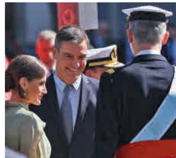
Pedro Sánchez habla con el Rey

Se estrenó en la tribuna como líder de la oposición el nuevo presidente del PP, Alberto Núñez Feijóo, que ya tenía experiencia en el desfile cuando era presidente de Galicia. Junto a él se sentaron Santiago Abascal (Vox), Cuca Gamarra (PP) y el resto de representantes políticos y de la sociedad civil.