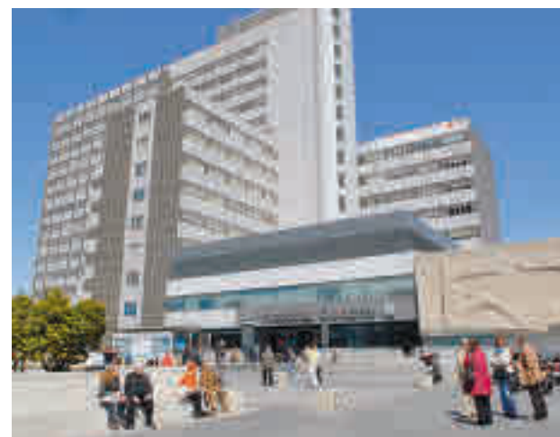
Hospital de La Paz

A pesar de que un 30% de los candidatos fallece en lis-