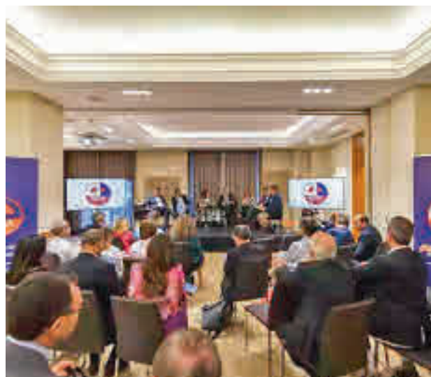
Un momento del coloquio organizado por ANETRA E.P.

En el anteproyecto de ley se introducen una serie de medidas complementarias relativas a infraestructuras y equipamientos para la sostenibilidad del sistema de transportes, como el uso y sumi-