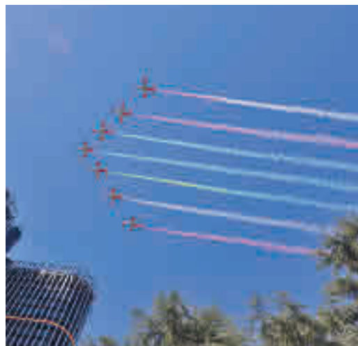
Los aviones surcaron el cielo de Madrid