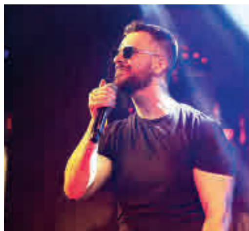
Uno de los miembros del grupo Meconios

EL PERIÓDICO GENTE NO SE RESPONSABILIZA NI SE IDENTIFICA CON LAS OPINIONES QUE SUS LECTORES Y COLABORADORES EXPONGAN EN SUS CARTAS Y ARTÍCULOS