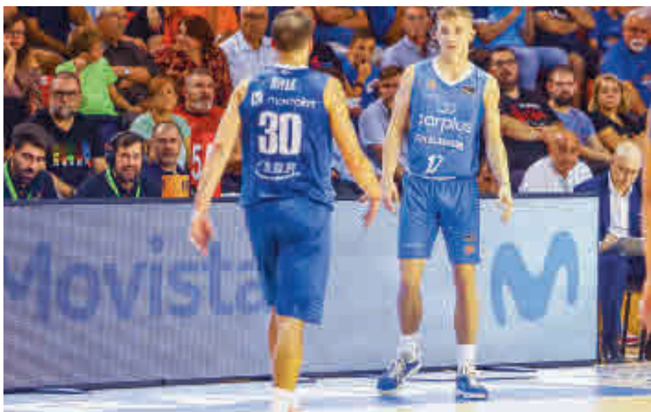
El Carplus Fuenlabrada acumula tres derrotas, dos de ellas en el Fernando Martín