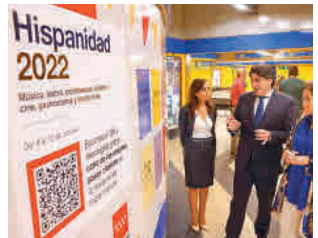
Presentación de la iniciativa

literarias son Plaza Castilla y Menéndez Pelayo (Línea 1), Quevedo y Santo Domingo (Línea 2), Callao y Sol (Línea 3), Colón y Pinar de Chamartín (Línea 4), Rubén Darío y Alameda de Osuna (Línea 5), República Argentina y Moncloa (Línea 6), Cartagena y Antonio Machado (Línea 7), Colombia y Nuevos Ministerios (Línea 8), Avenida de América y Concha Espina (Línea 9), Plaza de España y Cuzco (Línea 10), San Francisco y Plaza Elíptica (Línea 11) y Puerta del Sur y Arroyo Culebro (Línea 12).