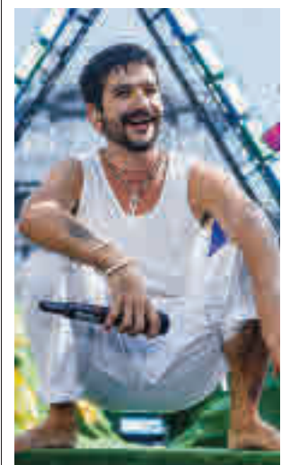
Concierto de Camilo

Por su parte, la ciudad de Madrid registra una incidencia acumulada a 14 días de 184 casos por cada 100.000 habitantes, 34,6 puntos por encima de la comunicada la semana pasada.