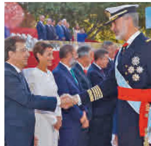
El Rey felicita a los presidentes autonómicos