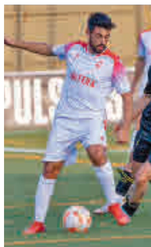
El Ursaria sigue como líder

vez que su inmediato perseguidor, el Getafe B, se dejaba dos puntos en su visita al campo del Canillas (2-2). Este domingo (12 horas), los pupi-