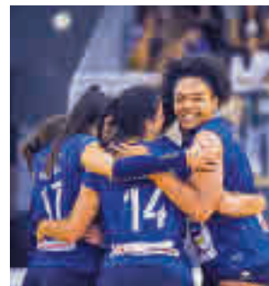
Chamberí ganó el derbi

La primera jornada de la División de Honor femenina de waterpolo depara una salida difícil para el único representante madrileño. El CD Natación Boadilla visita al Sabadell (sábado, 12:45).