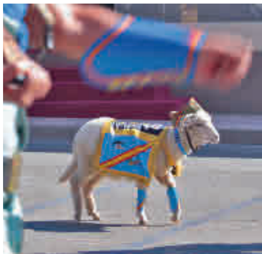
La cabra de la Legión