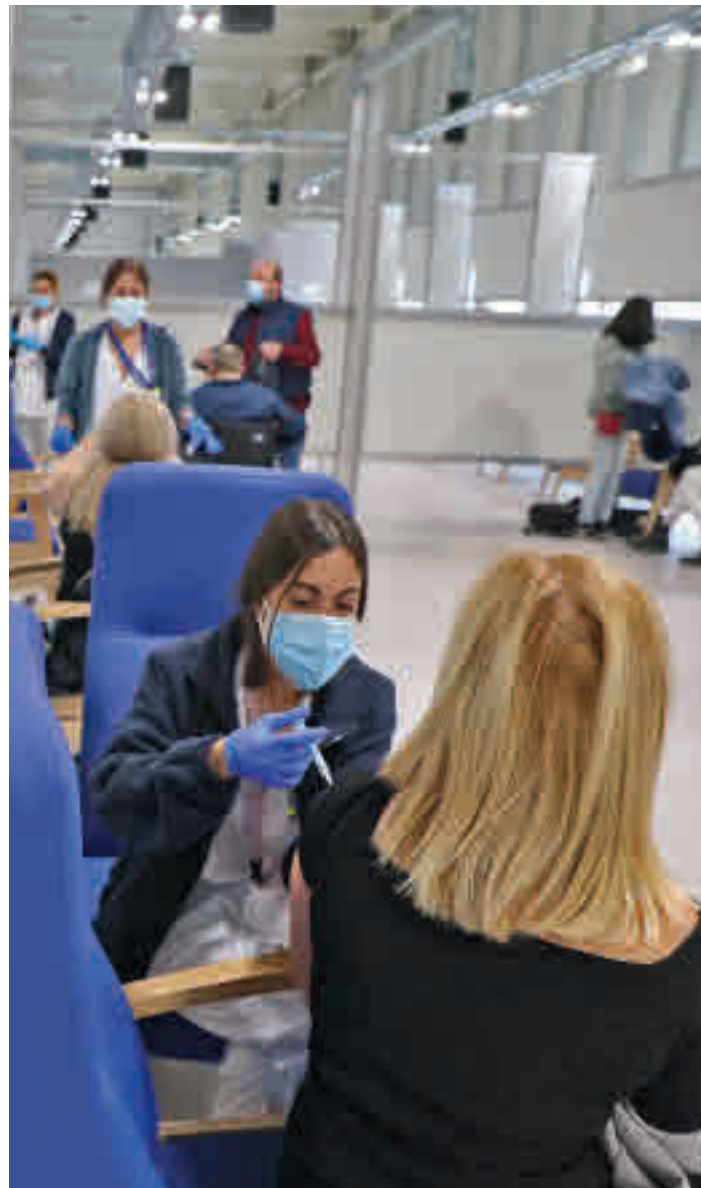
Vacunación en la Comunidad de Madrid

Los datos del informe elaborado por la Consejería de Sanidad muestran un empeoramiento de la situación • Los contagios aumentan un 34% y los ingresos se multiplican por 1,5