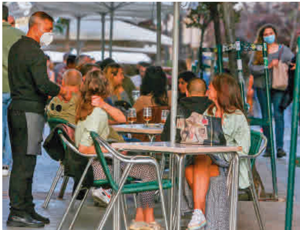
Una terraza de veladores situada en la almendra central de la capital