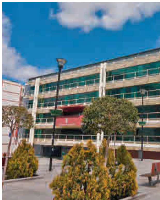
Ayuntamiento de Fuenlabrada

se saldaran con la muerte de un operario corneado por un toro que accedió al callejón del coso provisional. “Las necesidades de los vecinos son otras”, precisó Sebastián, para añadir que el Ayuntamiento seguirá “ayudando y protegiendo a mayores y jóvenes con ayudas como las aprobadas para costear gastos energéticos”. Por su parte, el alcalde, Javier Ayala, opinó que el “debate” sobre una instalación taurina permanente “no está en la calle”. “Es un debate entre PP y Vox, a ver quién es más taurino”, precisó tras preguntar a ambas formaciones de “dónde” saca-