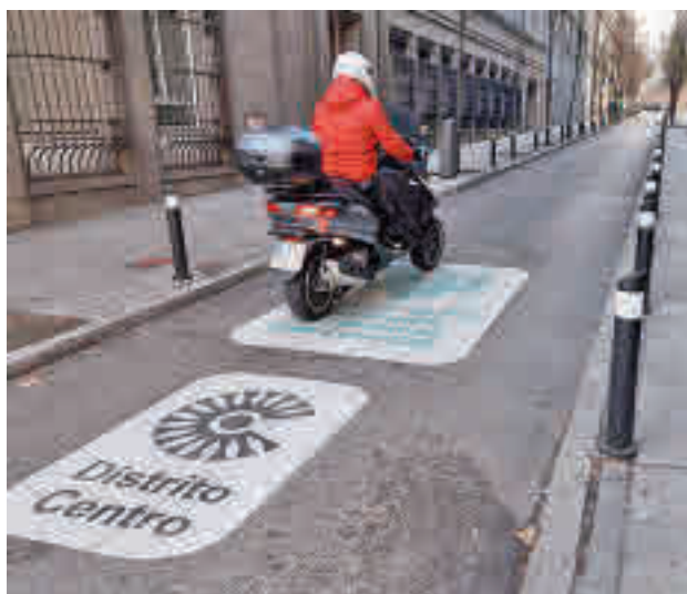
Una motocicleta transita por la zona de bajas emisiones

Con esta información, delimitaron distintas áreas de análisis en función de la con-