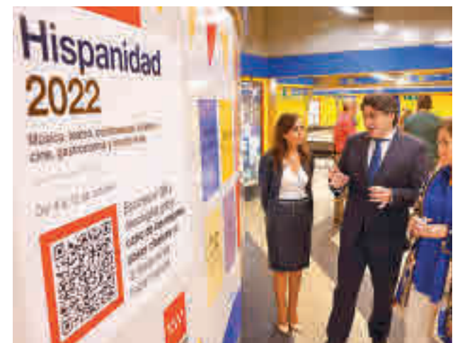
Presentación de la iniciativa

literarias son Plaza Castilla y Menéndez Pelayo (Línea 1), Quevedo y Santo Domingo (Línea 2), Callao y Sol (Línea 3), Colón y Pinar de Chamarín (Línea 4), Rubén Darío y Alameda de Osuna (Línea 5), República Argentina y Moncloa (Línea 6), Cartagena y Antonio Machado (Línea 7), Colombia y Nuevos Ministerios (Línea 8), Avenida de América y Concha Espina (Línea 9), Plaza de España y Cuzco (Línea 10), San Francisco y Plaza Elíptica (Línea 11) y Puerta del Sur y Arroyo Culebro (Línea 12).