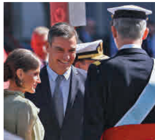
Pedro Sánchez habla con el Rey

Se estrenó en la tribuna como líder de la oposición el nuevo presidente del PP, Alberto Núñez Feijóo, que ya tenía experiencia en el desfile cuando era presidente de Galicia. Junto a él se sentaron Santiago Abascal (Vox), Cuca Gamarra (PP) y el resto de representantes políticos y de la sociedad civil.