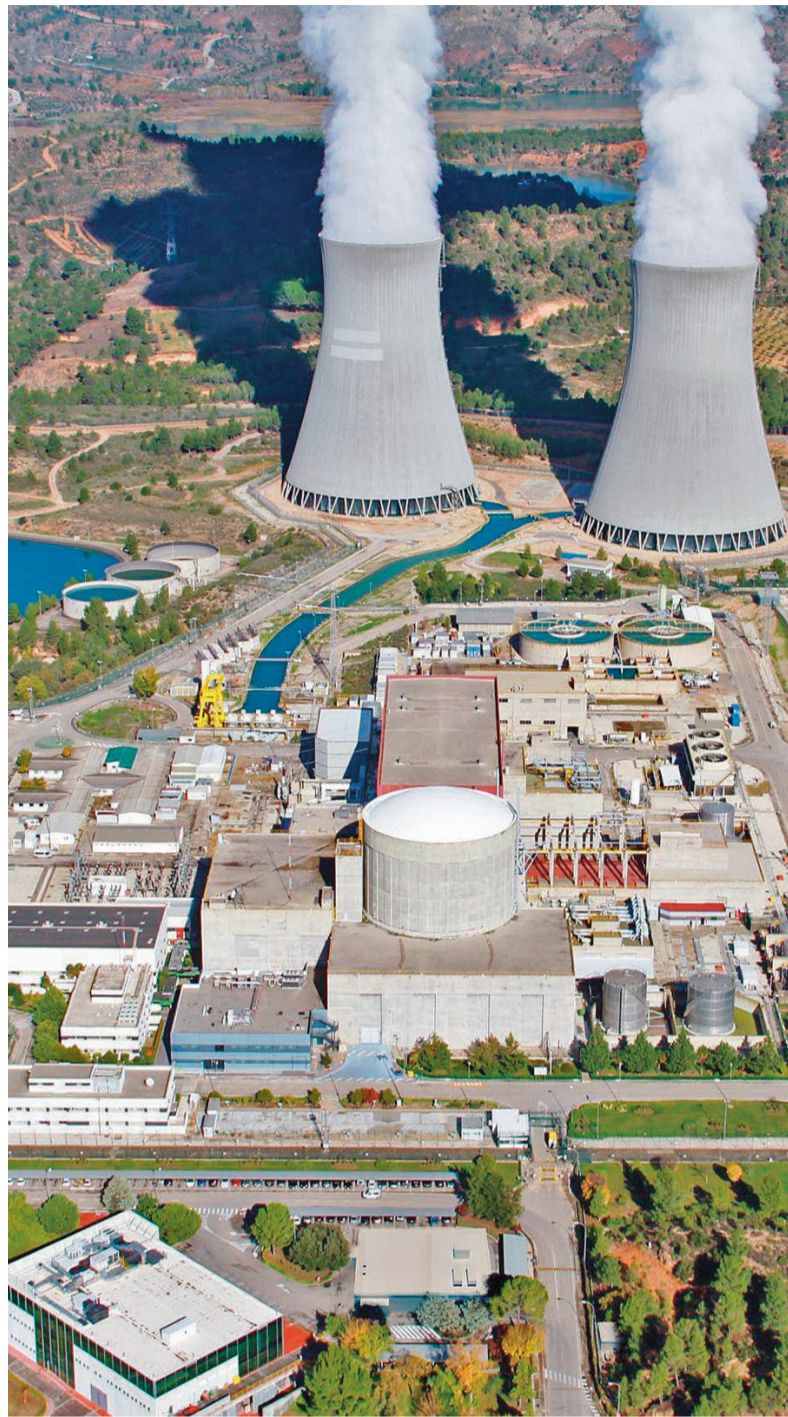
Panorámica de la central nuclear de Cofrentes

El principal inconveniente y el mayor motivo para el desmantelamiento de todas las centrales nucleares es que su combustible, el dióxido de uranio, mantiene su radiactividad durante varios miles de años. Ante la crisis energéti-