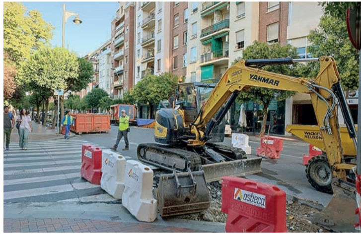
Las recientes obras del nuevo paso de Pérez Galdós.

“El alcalde de Logroño ya sabía que esto iba a ocurrir, y lo sabía porque se le manifestó en una carta enviada el pasado 28 de octubre de 2021, en la que le advertíamos de las dificultades, así como de las injusticias cometidas contra las empresas, para poder presentar ofertas en las licitaciones municipi-