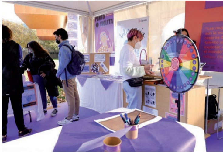
Un punto violeta de información contra la violencia de género en Logroño.

En cuanto al número de mujeres víctimas de violencia de género por cada 10.000 mujeres, La Rioja sigue siendo una de las autonomías con