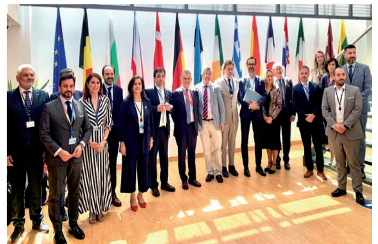
Las expediciones riojana y española, en el Comité de las Regiones en Bruselas.

nes y Ciudades: "Nos marcamos como objetivo que la política de cohesión siga siendo una iniciativa relevante para Europa, con la reconstrucción económica, la digitalización y la sostenibilidad como puntos clave". La Rioja ostenta la Jefatura de la Delegación Española desde el pasado mes de julio y ejercerá esta responsabilidad hasta febrero de 2025.