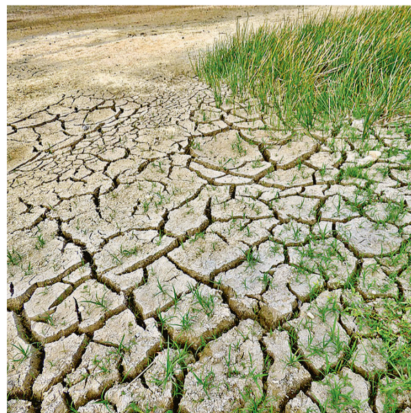
Cada vez aumentan más las zonas en riesgo

mundo en los años venideros. Un estudio de la Universidad de East Anglia (UEA), publicado en la revista Climatic Change, muestra que incluso un modesto aumento de la temperatura de 1,5°C tendrá graves consecuencias en India, China, Etiopía, Ghana, Brasil y Egipto. Si el incremento fuera de dos grados, la probabilidad de sequía se cuadruplicaría en Brasil y