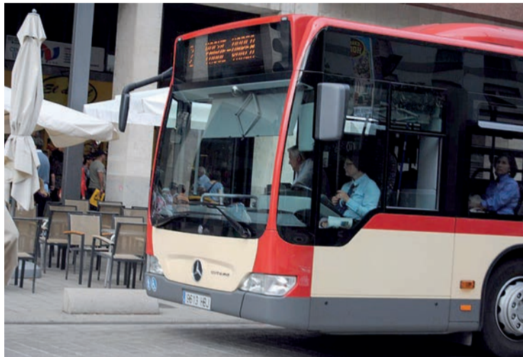
Un bus del transporte público de Logroño.