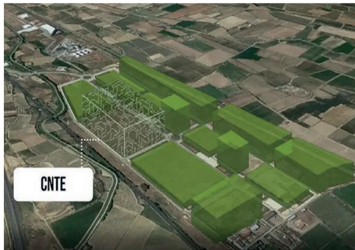
El lugar en el que se ubicará el Centro Nacional de Tecnologías del Envase en Calahorra.

INDUSTRIA | Plan del Ministerio y el Gobierno regional