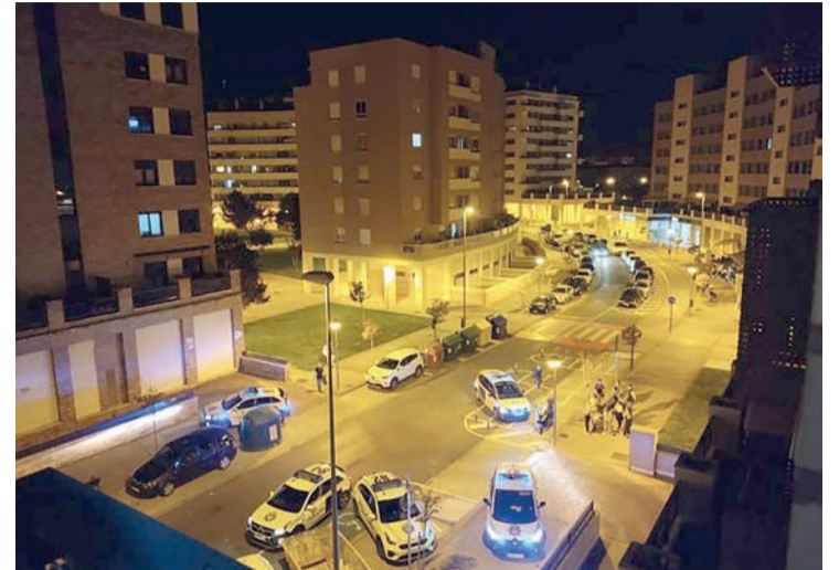
Reciente operativo de la Policía Local en Los Lirios.

tranquilidad". Escobar afirmó que el "conflicto entre el equipo de gobierno y el cuerpo de seguridad tiene un exclusivo origen y una única responsabilidad: la decisión del ejecutivo local de romper un acuerdo vigente que estaba en vigor hasta 2023, acordado con los representantes y que afectaba a diferentes ámbitos". Por eso, "si el PSOE quiere un acuerdo con el PP, hay que recuperar este convenio, roto de forma unilateral y sin aparente negociación ni propuesta encima de la mesa, un trato que podía ser más o menos opinable, pero legítimo".