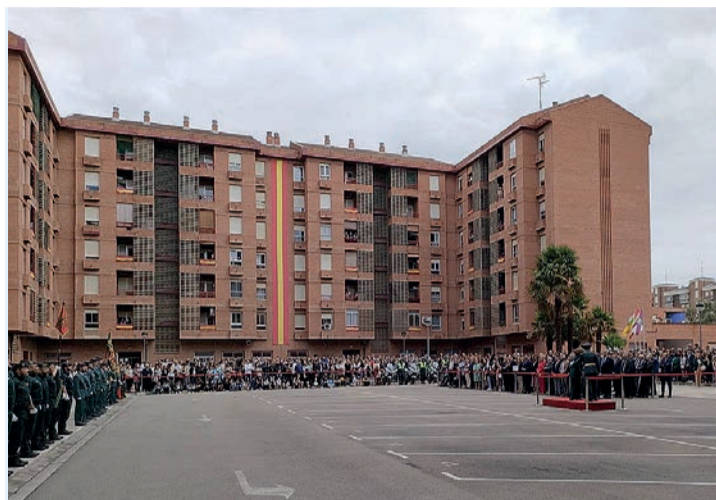
Acto oficial en Logroño por la Virgen del Pilar, Patrona de la Guardia Civil.

La 10ª Zona de la Guardia Civil está compuesta por tres Compañías Territoriales, en Haro, Logroño y Calahorra, además de la Plana Mayor, con residencia en la capital riojana. La unidad se conforma en base a 26 Puestos de Segu-