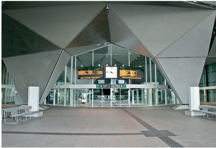
La línea Castejón-Logroño recibirá más de diez millones de euros en los PGE de 2023.

Los PGE recogen una dotación superior a los diez millones de euros para adaptar la línea Castejón-Logroño a la alta velocidad (518 millones para el periodo 2023-2027), a los que se suman más de un millón para la variante de Rincón de Soto y