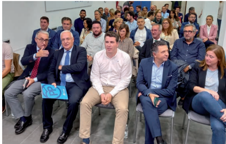
La reunión del Comité Ejecutivo Regional del PP riojano.