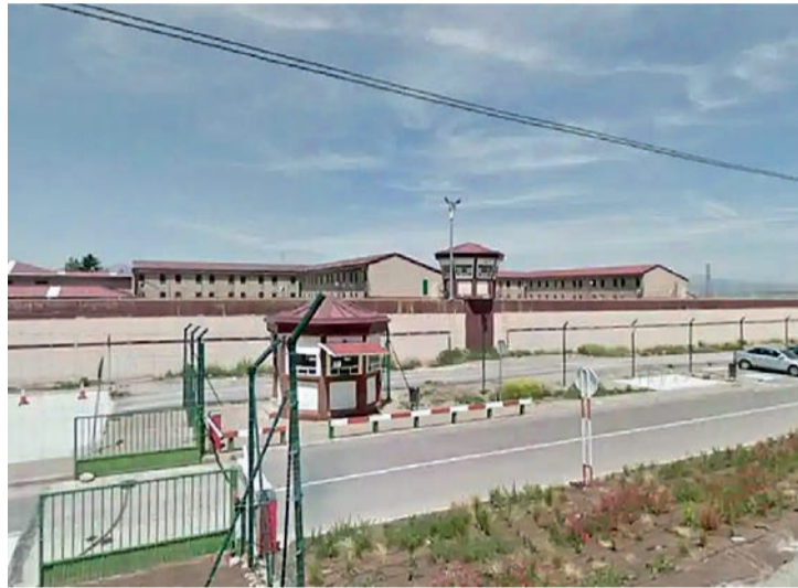
El centro penitenciario de Logroño.

Tras los 20 años por el asesinato de 'El Sevi', a Bailón le condenaron a 20 meses de cárcel por el delito continuado de robo con fuerza, así como otros 20 por el delito de robo con fuerza en casa habitada. Por un delito continuado de hurto le correspondieron nueve meses, a los que sumaron cinco más por un delito de estafa y otros 18 por el delito contra la salud pública. En total,