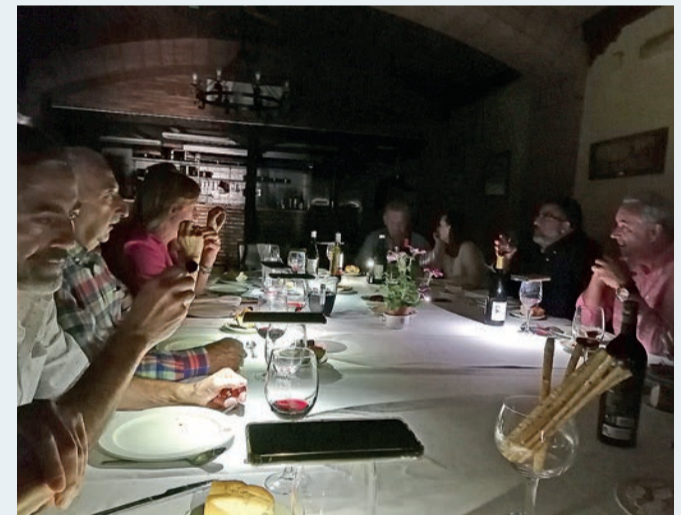
Comiendo con "velas".

gunas distribuidas por la ciudad que repartían la luz. Así que todo el mundo estaba provisto de velas, normalmente puestas en una palmatoria. En mi casa había dos palmatorias y tres o cuatro velas sin estrenar, siempre. De las dos palmatorias, una era para ponerla en la cocina y otra, en el comedor. Todo esto me vino a la cabeza cuando el otro día comiendo con unos amigos en la sociedad gastronómica 'La Rondalosa' se fue la luz y yo me acordé de mi niñez. Pero claro, no había velas de cera. Hoy no hacen falta, dado que todo el mundo lleva la linterna del móvil y seguimos comiendo con "velas". Si es que, como decían en el sainete de la 'Verbena de la Paloma': "Hoy las ciencias adelantan que es una barbaridad".