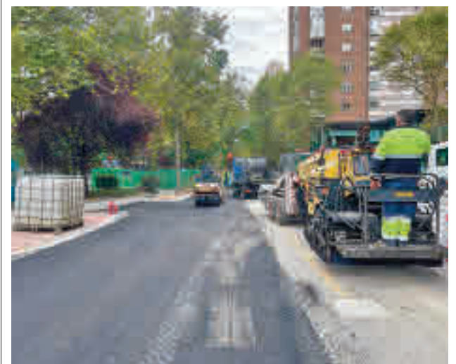
Las obras de construcción del itinerario ciclista

gentedigital.es Toda la actualidad de los distritos de Madrid, en nuestra web