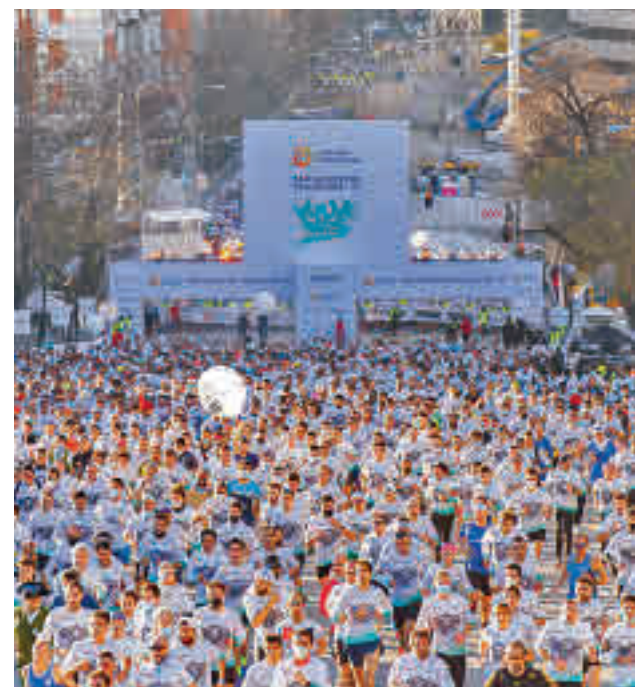
Imagen del año pasado

Después de tres jornadas disputadas, el Depol Feel Alcobendas y el Madrid Chamberí TotalEnergies suman los mismos puntos (3). Esta jornada visitan al CV Tenerife y al CV Sayre, respectivamente.