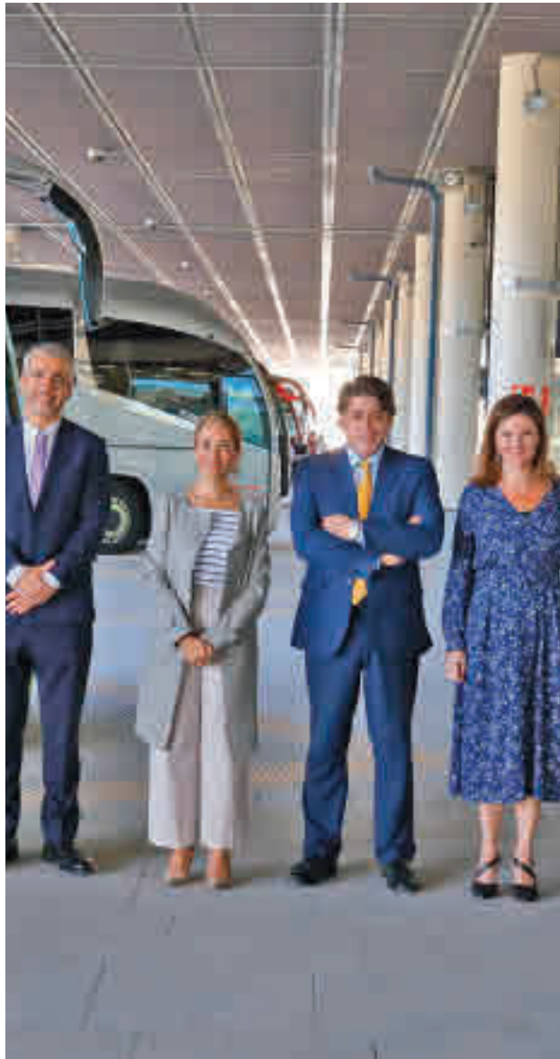
La foto de familia de las autoridades

Las nuevas dependencias constan de un edificio de dos plantas y una cubierta para mantenimiento, dársenas y viales, en la que harán parada autobuses de línea regular, con origen o destino nacional e internacional, así como autobuses discretivos de grupos o excursiones. Actualmente, solo las líneas regulares que operan en el aero-