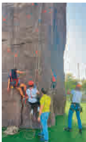
La nueva instalación