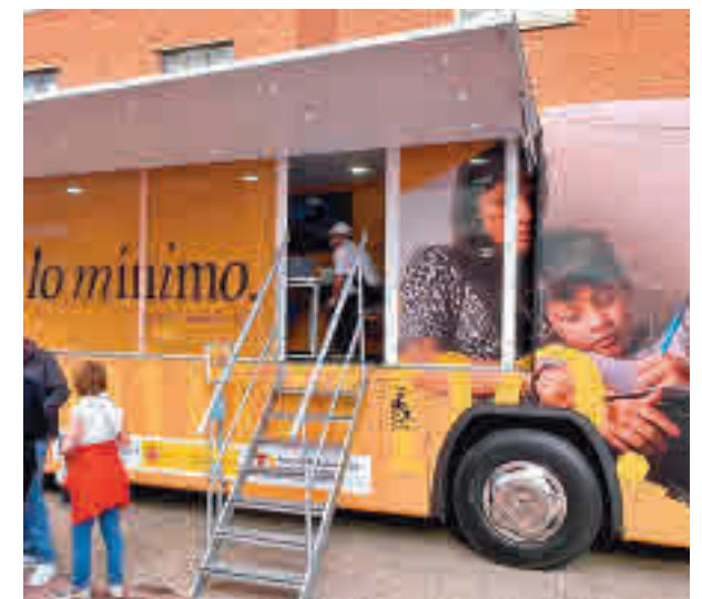
Autobús del Ingreso Mínimo Vital

Son las que en 2020 no estaban en riesgo de de exclusión y entraron en 2021