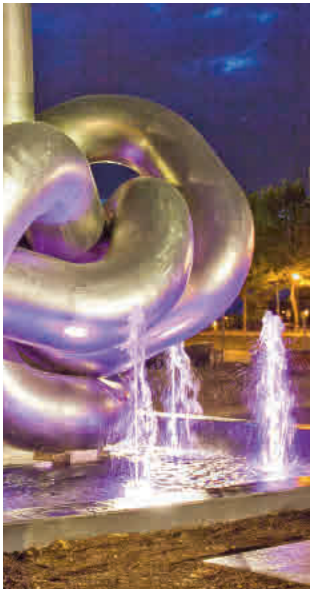
Leganés se iluminó de rosa

Durante todo el día, los edificios municipales y las fuentes ornamentales se iluminaron de color rosa. Un gesto con el que la ciudad se sumó a la campaña 'El rosa es