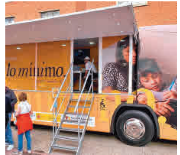
Autobús del Ingreso Mínimo Vital

Son las que en 2020 no estaban en riesgo de de exclusión y entraron en 2021