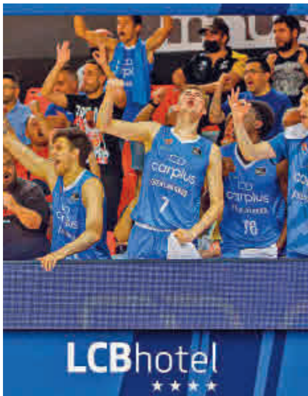
El Carplus Fuenlabrada sumó su primer triunfo del curso

También actuará como visitante el Real Madrid, aunque en su caso la cita tendrá lugar este domingo (19:15 horas). Será en el Buesa Arena donde los hombres de Chus Ma-