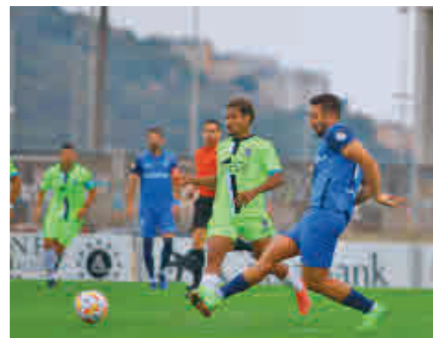
El Sanse selló su tercer triunfo consecutivo

Coruña, respectivamente, aunque en lo que a los intereses madrileños se refiere destaca el derbi de este sábado (19 horas) en el Cerro del Espino entre Rayo Majadahonda y Fuenlabrada. Los locales tomaron aire en Talavera tras firmar su primera victoria del curso (0-2), mientras que los azulones superaban al Badajoz con idéntico resultado.