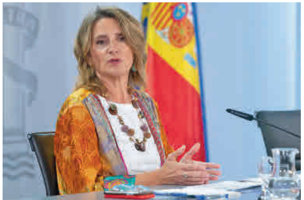
La vicepresidenta Teresa Ribera presenta las medidas

Ahorro Es lo que calcula el Ejecutivo que se puede rebajar la factura en algunos hogares