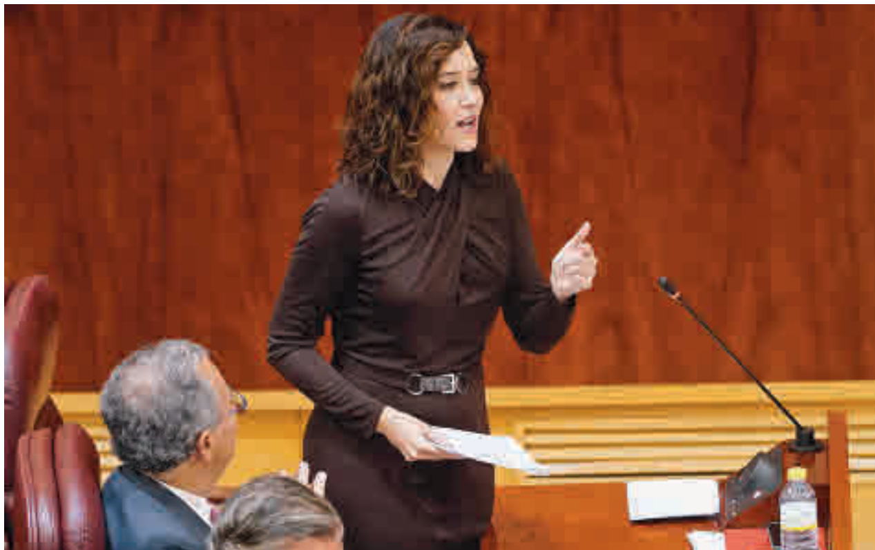
Isabel Díaz Ayuso, durante su intervención en la Asamblea

Tras realizar el anuncio, Ayuso cargó contra los partidos de la oposición por "intentar azuzar y manipular las negociaciones" con los sindicatos sanitarios "para que no salgan", porque se les acabarían