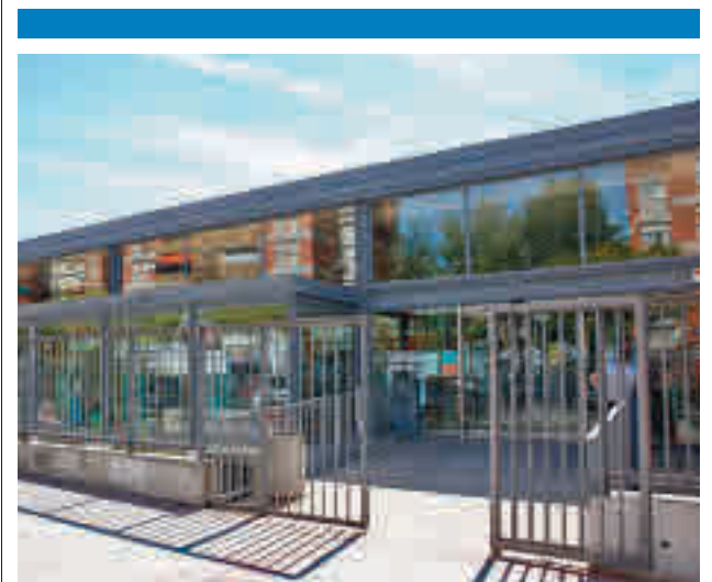
Biblioteca de Fuenlabrada

El programa ‘Fuenconectad@s’, “una iniciativa municipal única en España”, ya permitió una inversión de 950.000 euros durante el pasado curso en los centros escolares de Fuenlabrada y que durante toda la legislatura inyectará cerca de 2 millones de euros para mejorar las capacidades tecnológicas y digitales de los centros en los que estudian los niños y jóvenes de la ciudad como colegios públicos o concertados, institutos o escuelas infantiles.