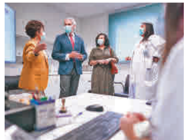
Inicio de la campaña de vacunación

En el caso de Atención Primaria, el usuario debe solicitar cita previa llamando por teléfono a su centro de salud y seleccionando la opción vacuna.