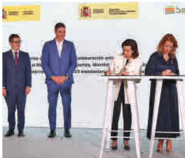
Margarita Robles y Raquel Sánchez firmaron el convenio

Sánchez tomó la palabra tras la firma del acuerdo entre los Ministerios de Defensa y el de Transportes, Movilidad y Agenda Urbana, que se llevó a cabo en el acuartelamiento Los Castillejos, sede de la Jefatura de Cría Caballar