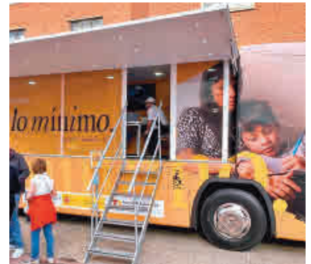
Autobús del Ingreso Mínimo Vital

Son las que en 2020 no estaban en riesgo de de exclusión y entraron en 2021