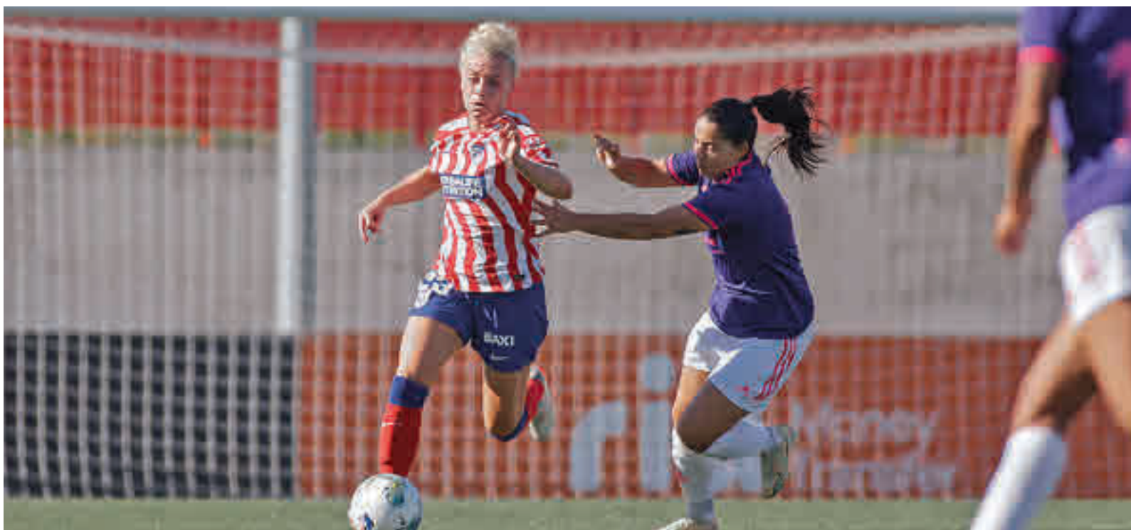
Imagen de un amistoso entre Atlético y Madrid CFF este pasado mes de agosto. ÁLVARO CAMPO / AT. MADRID