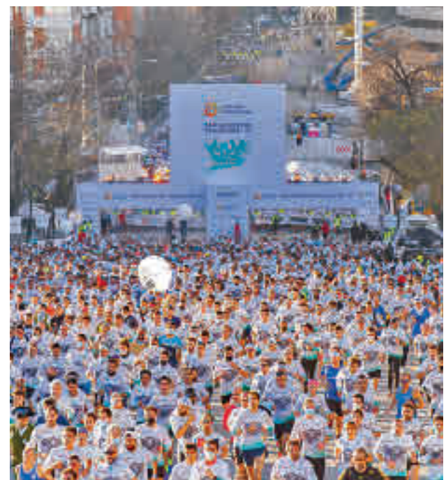
Imagen del año pasado

Después de tres jornadas disputadas, el Depol Feel Alcobendas y el Madrid Chamberí TotalEnergies suman los mismos puntos (3). Esta jornada visitan al CV Tenerife y al CV Sayre, respectivamente.