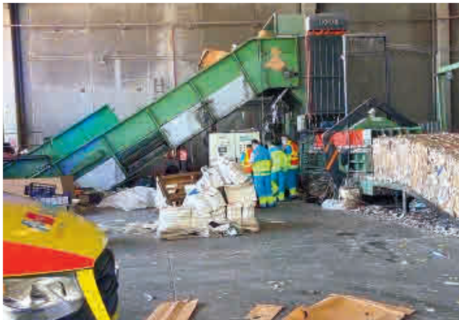
Atención de los servicios de Emergencias

“Nos preocupa el elevado número de accidentes laborales que siguen produciéndose y queremos visibilizar las