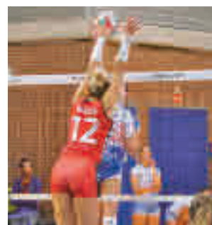
Triunfo del Alcobendas

Los dos equipos madrileños de la Primera masculina ocupan las primeras plazas de la tabla, a la espera de qué resultados obtengan este domingo: Club de Campo-Taburiente y RS Tenis-Sanse Complutense.