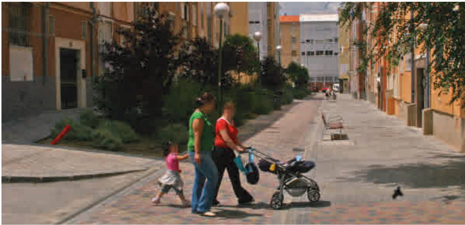
En 2021 aumentó el número de madrileños en riesgo de exclusión